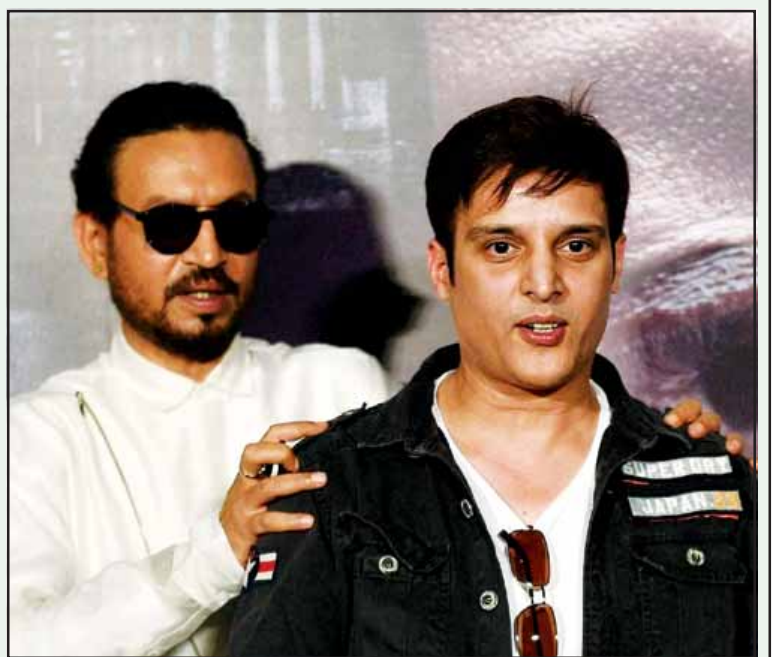
ਅਦਾਕਾਰ ਜ਼ਿੰਮੀ ਸ਼ੇਰਗਿੱਲ ਉਘੇ ਅਦਾਕਾਰ ਇਰਫਾਨ ਖਾਨ ਨਾਲ।

ਜ਼ਿੰਮੀ ਨੇ ਪੌਸਟ ਨੂੰ ਰੀ-ਟਵੀਟ ਕਰਦਿਆਂ ਸੰਦੇਸ਼ ਭੇਜਿਆ ਜਿਸ ਵਿਚ ਉਸ ਨੇ ਲਿਖਿਆ- 'ਉਨ੍ਹਾਂ ਨੂੰ ਮੇਰੀਆਂ ਸੁਭਕਾਮਨਾਵਾਂ।' ਇਸ ਦੇ ਨਾਲ ਹੀ ਜ਼ਿੰਮੀ ਸ਼ੇਰਗਿੱਲ ਨੇ ਹੱਥ ਜੋੜਦਿਆਂ ਤੇ ਹੱਸਦਿਆਂ ਦੀ ਇਮੋਜੀ ਵੀ ਸਾਂਝੀ ਕੀਤੀ। 52 ਸਾਲਾ ਸ਼ੇਰਗਿੱਲ ਨੇ ਆਖ਼ਰੀ ਵਾਰ ਸੁਦੀਪਤੋ ਸਰਕਾਰ ਦੀ 'ਅਪ੍ਰੇਸ਼ਨ ਮੇਅਫੇਅਰ' ਵਿਚ ਕੰਮ ਕੀਤਾ ਸੀ। ਜ਼ਿੰਮੀ ਨੇ ਆਪਣੇ ਫਿਲਮੀ ਕਰੀਅਰ ਦੀ ਸ਼ੁਰੂਆਤ 1996 'ਚ ਆਈ ਫਿਲਮ 'ਮਾਚਿਸ' ਨਾਲ ਕੀਤੀ ਸੀ। ਉਸ ਨੇ ਬਾਅਦ ਵਿਚ 'ਮੁਹੱਬਤੋ', 'ਮੇਰੇ ਯਾਰ ਕੀ ਸ਼ਾਦੀ ਹੈ', 'ਮੁੰਨਾ ਬਾਈ ਐੱਮ.ਬੀ.ਬੀ.ਐੱਸ.', 'ਹਮ ਤੁਮ', 'ਏ ਵੈਡਨਸਡੇਅ' 'ਤਨੂ ਵੈਡਜ਼ ਮਨੂੰ' 'ਸਪੈਸ਼ਲ 26', 'ਮਾਈ ਨੇਮ ਇਜ਼ ਖਾਨ' ਆਦਿ ਫਿਲਮਾਂ ਵਿਚ ਕੰਮ ਕੀਤਾ।