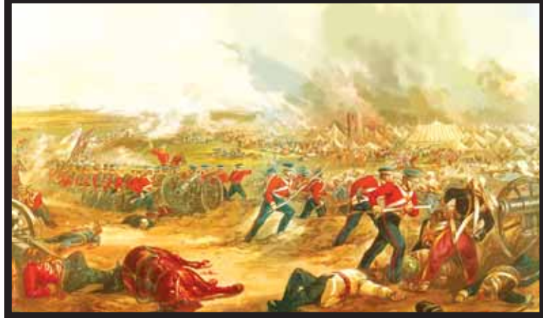
ਅੰਗਰੇਜ਼ ਅਤੇ ਸਿੱਖਾਂ ਵਿਚਕਾਰ ਹੋਈ ਪਹਿਲੀ ਜੰਗ ਇਕ ਚਿੱਤਰਕਾਰ ਦੀਆਂ ਨਜ਼ਰਾਂ ਵਿਚ।