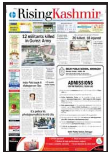
‘ਦਿ ਰਾਈਜ਼ਿੰਗ ਕਸ਼ਮੀਰ’ ਅਖਬਾਰ ਦਾ ਪਹਿਲਾ ਪੰਨਾ।