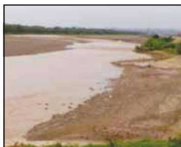
ਅਧਿਐਨ ਰਿਪੋਰਟ ਮੁਤਾਬਕ ਸਿਫਾਰਸ਼ਾਂ ਨੂੰ ਲਾਗੂ ਕਰਨਾ ਚਾਹੀਦਾ ਹੈ ਤਾਂ ਜੋ ਘੱਗਰ ਦਰਿਆ 'ਚ