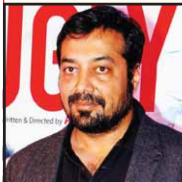
ਨਿਰਦੇਸ਼ਕ ਅਨੁਰਾਗ ਕਸ਼ਯਪ

ਚੁਟਕੀ ਲੈ ਰਹੇ ਕਿ ਲੋਕਾਂ ਨੇ ਅਨੁਰਾਗ ਦੀ ਇਹ ਗੱਲ ਮੰਨ ਲਈ ਅਤੇ ਸਿਨੇਮਾ ਘਰਾਂ ਅੰਦਰ ਫਿਲਮ ਦੇਖਣ ਹੀ ਨਹੀਂ ਗਏ।