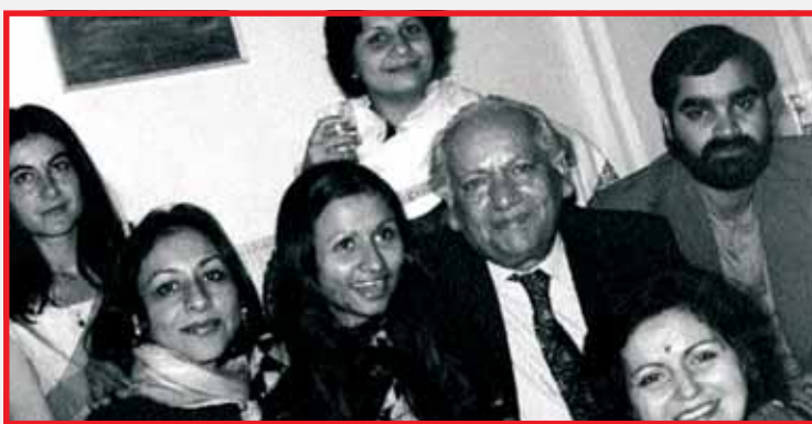
ਨੱਯਾਰਾ ਨੂਰ ਅਤੇ (ਸੱਜੇ) ਨੱਯਾਰਾ ਨੂਰ ਮਸ਼ਹੂਰ ਸਾਇਰ ਫੈਜ਼ ਅਹਿਮਦ ਫੈਜ਼ ਤੇ ਹੋਰਾਂ ਨਾਲ।