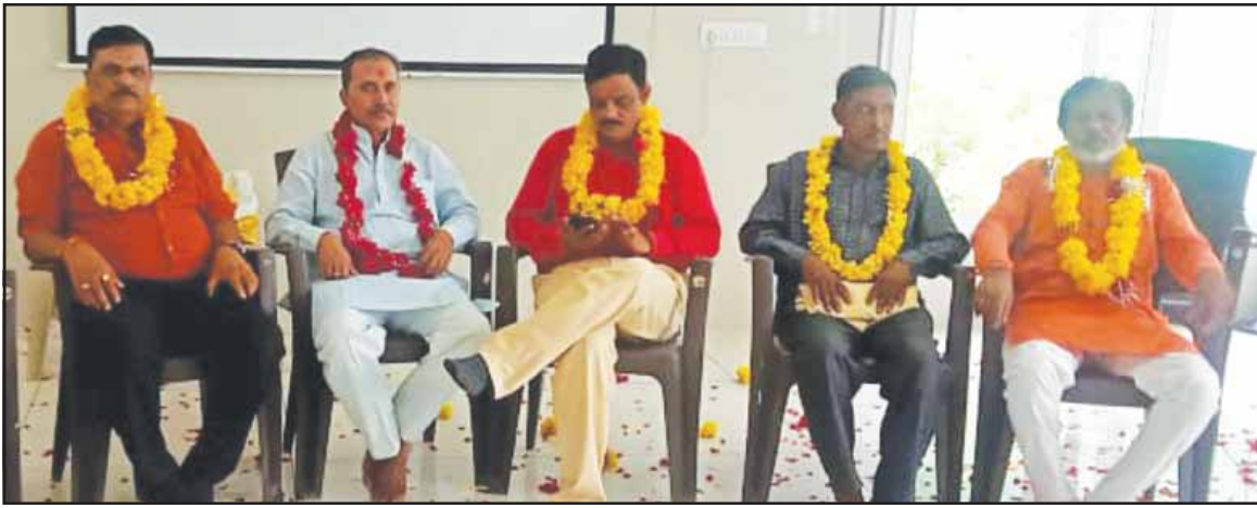
ਬਿਲਕੀਸ ਬਾਨੋ ਬਲਾਤਕਾਰ ਕੇਸ ਦੇ ਮੁਜਰਮਾਂ ਨੂੰ ਰਿਹਾਅ ਹੋਣ ਤੋਂ ਬਾਅਦ ਹਾਰ ਪਹਿਨਾਏ ਗਏ।

ਐਤਕੀਂ ਆਜ਼ਾਦੀ ਦਿਵਸ ਮੌਕੇ ਗੁਜਰਾਤ ਸਰਕਾਰ ਵੱਲੋਂ ਬਿਲਕੀਸ ਬਾਨੋ ਕੇਸ ਦੇ 11 ਮੁਜਰਮਾਂ ਦੀ ਸਜ਼ਾ ਮੁਆਫੀ ਨਾਲ ਸਮੁੱਚਾ ਭਾਰਤ ਝੰਜੋੜਿਆ ਗਿਆ ਹੈ। ਇਨ੍ਹਾਂ ਮੁਜਰਮਾਂ ਉਤੇ ਬਲਾਤਕਾਰ ਅਤੇ ਕਤਲ ਦੇ ਦੋਸ਼ ਸਾਬਤ ਹੋ ਚੁੱਕੇ ਹਨ ਪਰ ਇਨ੍ਹਾਂ ਨੂੰ ਸ਼ਰੇਆਮ ਮੁਆਫੀ ਦੇ ਦਿੱਤੀ ਗਈ। ਸਾਡੇ ਕਾਲਮਨਵੀਸ ਬੂਟਾ ਸਿੰਘ ਮਹਿਮੂਦਪੁਰ ਨੇ ਆਪਣੇ ਇਸ ਕੇਸ ਵਿਚ ਇਸ ਕੇਸ ਅਤੇ ਹਿੰਦੂਵੀ ਸਿਆਸਤ ਬਾਰੇ ਤਫਸੀਲ ਵਿਚ ਵਿਚਾਰ-ਚਰਚਾ ਕੀਤੀ ਹੈ।