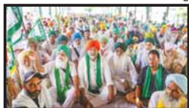
ਅਜੇ ਤੱਕ ਮੁਆਵਜ਼ਾ ਦੇਣ ਦਾ ਵਾਅਦਾ ਵਾਅਦਾ ਵੀ ਪੂਰਾ ਨਹੀਂ ਕੀਤਾ।

ਕੇਂਦਰ ਸਰਕਾਰ ਵੱਲੋਂ ਐਮ.ਐਸ.ਪੀ. ਬਾਰੇ ਬਣਾਈ ਕਮੇਟੀ ਅਤੇ ਇਸ ਦਾ ਐਲਾਨਾ ਏਜੰਡਾ ਕਿਸਾਨ ਮੰਗਾਂ ਦੇ ਉਲਟ ਹੈ। ਇਸ ਕਮੇਟੀ ਨੂੰ ਰੱਦ ਕਰਕੇ ਸਾਰੀਆਂ ਫਸਲਾਂ ਦੀ ਘੱਟੋ-ਘੱਟ ਸਮਰਥਨ ਮੁੱਲ 'ਤੇ ਵਿਕਰੀ ਦੀ ਗਾਰੰਟੀ ਦੇਣ ਲਈ ਕਮੇਟੀ ਦਾ ਮੁੜ ਗਠਨ ਕਰਨਾ ਬਣਦਾ ਹੈ। ਸਰਕਾਰ ਨੂੰ ਆਪਣੇ ਵਾਅਦੇ ਅਨੁਸਾਰ ਕਿਸਾਨ ਅੰਦੋਲਨ ਦੌਰਾਨ ਰਾਜਾਂ ਅਤੇ ਕੇਂਦਰ ਸ਼ਾਸਤ ਪ੍ਰਦੇਸ਼ਾਂ ਵਿਚ ਕਿਸਾਨਾਂ ਖਿਲਾਫ ਦਰਜ ਸਾਰੇ ਪੁਲਿਸ ਕੇਸ ਵਾਪਸ ਲੈਣੇ ਬਣਦੇ ਸਨ। ਅਜੇ ਤੱਕ ਵੀ ਸਾਰੇ ਕੇਸਾਂ ਦੀ ਵਾਪਸੀ ਨਹੀਂ ਹੋਈ ਹੈ।