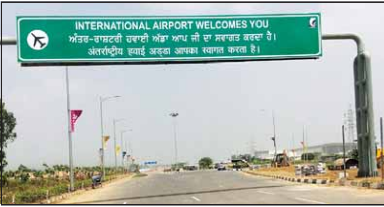
ਨੂੰ ਪੱਤਰ ਭੇਜਣਗੀਆਂ। ਇਸ ਤੋਂ ਬਾਅਦ ਹੀ ਚੰਡੀਗੜ੍ਹ ਕੌਮਾਂਤਰੀ ਹਵਾਈ ਅੱਡੇ ਦਾ ਨਾਮ ਬਦਲਿਆ ਜਾ ਸਕਦਾ ਹੈ। ਗੌਰਤਲਬ ਹੈ ਕਿ ਚੰਡੀਗੜ੍ਹ ਕੌਮਾਂਤਰੀ ਹਵਾਈ ਅੱਡੇ ਦਾ ਨਾਮ ਸ਼ਹੀਦ ਭਗਤ ਸਿੰਘ ਦੇ ਨਾਂ 'ਤੇ ਰੱਖਣ ਲਈ ਕਾਫੀ ਸਮੇਂ ਤੋਂ ਮੰਗ ਉੱਠ ਰਹੀ ਹੈ। ਇਸ ਮਾਮਲੇ 'ਤੇ ਕੇਂਦਰ ਸਰਕਾਰ ਨੇ ਪੰਜਾਬ ਅਤੇ ਹਰਿਆਣਾ ਦੀਆਂ ਸਰਕਾਰਾਂ ਤੋਂ ਸਹਿਮਤੀ ਮੰਗੀ ਸੀ।

ਚੰਡੀਗੜ੍ਹ: ਚੰਡੀਗੜ੍ਹ ਕੌਮਾਂਤਰੀ ਹਵਾਈ ਅੱਡੇ ਦਾ ਨਵਾਂ ਨਾਮ ਹੁਣ ਸ਼ਹੀਦ ਭਗਤ ਸਿੰਘ ਦੇ ਨਾਂ 'ਤੇ ਹੋਵੇਗਾ। ਇਸ ਸਬੰਧੀ ਪੰਜਾਬ ਅਤੇ ਹਰਿਆਣਾ ਵਿਚਾਲੇ ਸਹਿਮਤੀ ਬਣ ਗਈ ਹੈ। ਪੰਜਾਬ ਦੇ ਮੁੱਖ ਮੰਤਰੀ ਭਗਵੰਤ ਮਾਨ ਦੀ ਰਿਹਾਇਸ਼ 'ਤੇ ਹਰਿਆਣਾ ਦੇ ਉਪ ਮੁੱਖ ਮੰਤਰੀ ਦੁਸ਼ਯੰਤ ਚੌਟਾਲਾ ਨਾਲ ਚੰਡੀਗੜ੍ਹ ਕੌਮਾਂਤਰੀ ਹਵਾਈ ਅੱਡੇ ਦਾ ਨਾਮ ਸ਼ਹੀਦ ਭਗਤ ਸਿੰਘ ਦੇ ਨਾਂ 'ਤੇ ਰੱਖਣ ਲਈ ਚਰਚਾ ਹੋਈ।