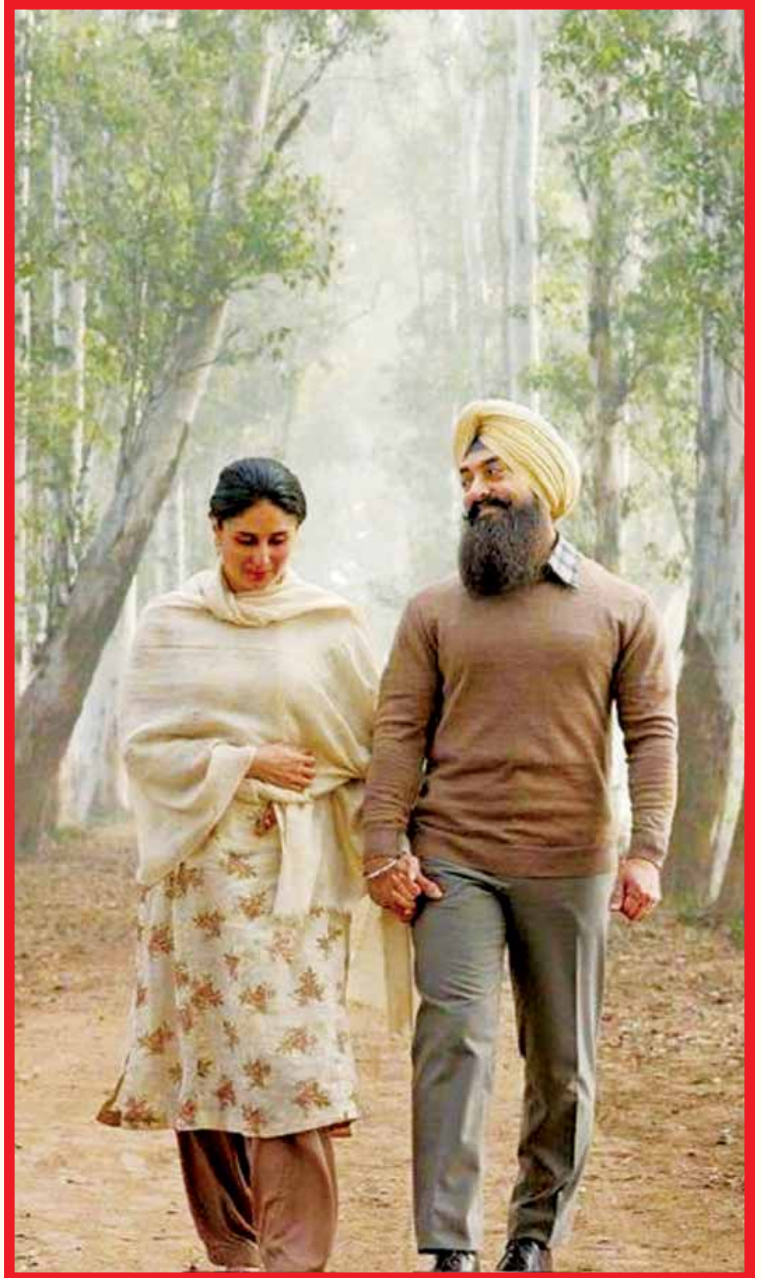
11 ਅਗਸਤ ਨੂੰ ਰਿਲੀਜ਼ ਹੋਣ ਤੋਂ ਪਹਿਲਾਂ ਦੀ ਚਰਚਿਤ ਹੋਈ ਫਿਲਮ ‘ਲਾਲ ਸਿੰਘ ਚੱਢਾ’ ਦੇ ਇਕ ਦ੍ਰਿਸ਼ ਵਿਚ ਆਮਿਰ ਖਾਨ ਅਤੇ ਕਰੀਨਾ ਕਪੂਰ।

ਫਿਲਮ ‘ਲਾਲ ਸਿੰਘ ਚੱਢਾ’ ਦਾ ਨਿਰਦੇਸ਼ਨ ਅਦਵੈਤ ਚੰਦਨ ਨੇ ਕੀਤਾ ਹੈ। ਇਸ ਵਿਚ ਕਰੀਨਾ ਕਪੂਰ ਦਾ ਵੀ ਅਹਿਮ ਰੋਲ ਹੈ।