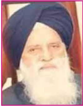
Jathedar Tara Singh