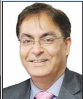
Amit Kumar Consul General (Chicago)