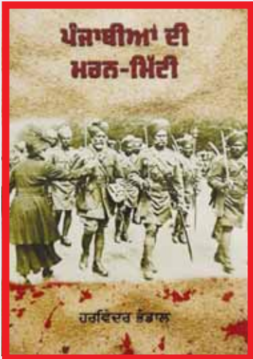
ਕਿਤਾਬ ਦਾ ਮੁਖੜਾ।