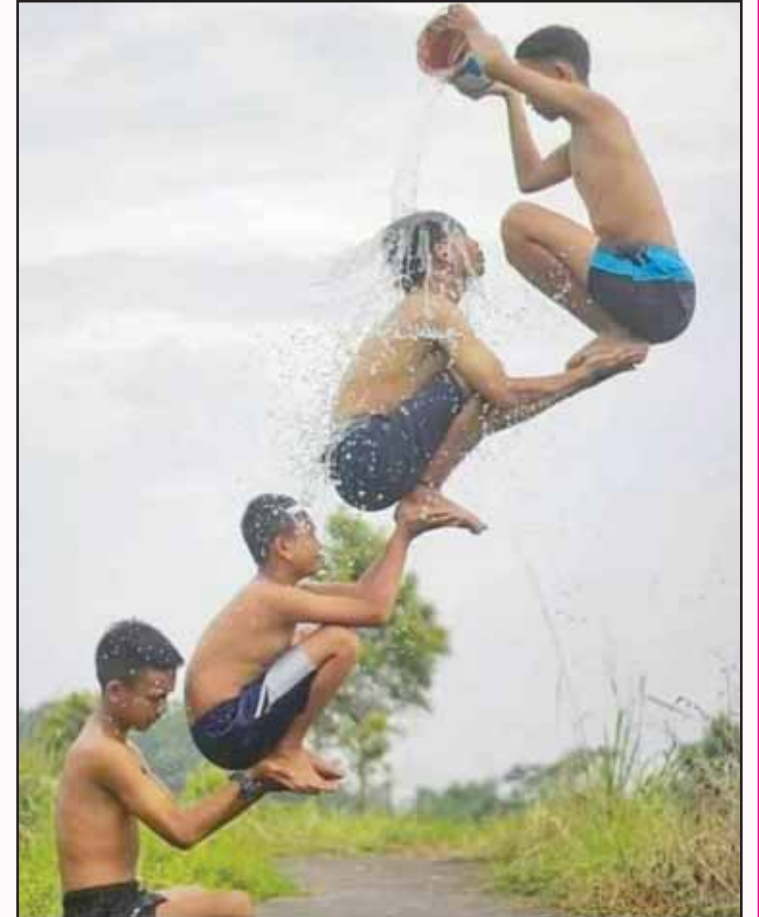
ਤਸਵੀਰ ਵਾਲੇ ਨੇ ਕਮਾਲ ਹੈ ਕੀਤੀ, ਬੜਾ ਕੁਝ ਕਹਿ ਗਈ ਚੁੱਪ-ਚੁਪੀਤੀ। ਕਹਿੰਦੇ ਪਵਨ ਗੁਰੂ ਪਾਣੀ ਹੈ ਪਿਤਾ, ਸ੍ਰਿਸ਼ਟੀ ਰਚ ਜਿਸ ਜੀਵਨ ਹੈ ਦਿੱਤਾ।