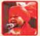
ਵਾਇਕ ਸੰਤੀ ਪਾਵਲਾ

4.0 ਜੀ. ਪੀ. ਏ. ਗਰੇਡ ਵਾਲੇ ਹਾਈ ਸਕੂਲ ਦੇ ਵਿਦਿਆਰਥੀਆਂ ਦਾ ਵਿਸ਼ੇਸ਼ ਸਨਮਾਨ ਕੀਤਾ ਜਾਵੇਗਾ। Note: Students with 4.0 grade should register at IAHForum@gmail.com