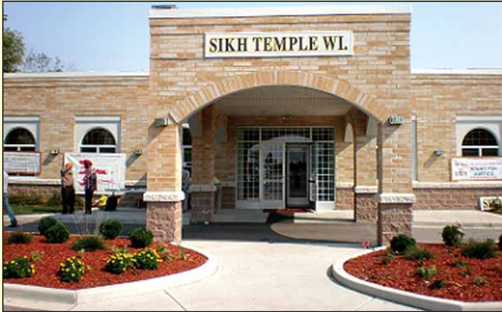
ਗੁਰਦੁਆਰਾ ਸਿੱਖ ਟੈਂਪਲ, ਓਕ ਕਰੀਕ

ਜਿਨਾ ਸਾਸਿ ਗਿਰਾਸਿ ਨਾ ਵਿਸਰੈ ਹਰਿ ਨਾਮਾ ਮਨਿ ਮੰਤੁ॥ ਧੰਨੁ ਸਿ ਸੇਈ ਨਾਨਕਾ ਪੂਰਨੁ ਸੇਈ ਸੰਤੁ॥