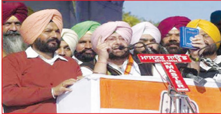
ਗੁਟਕਾ ਹੱਥ ਵਿਚ ਫੜ ਕੇ ਸਹੁੰ ਚੁਕਦੇ ਹੋਏ ਕੈਪਟਨ ਅਮਰਿੰਦਰ ਸਿੰਘ।