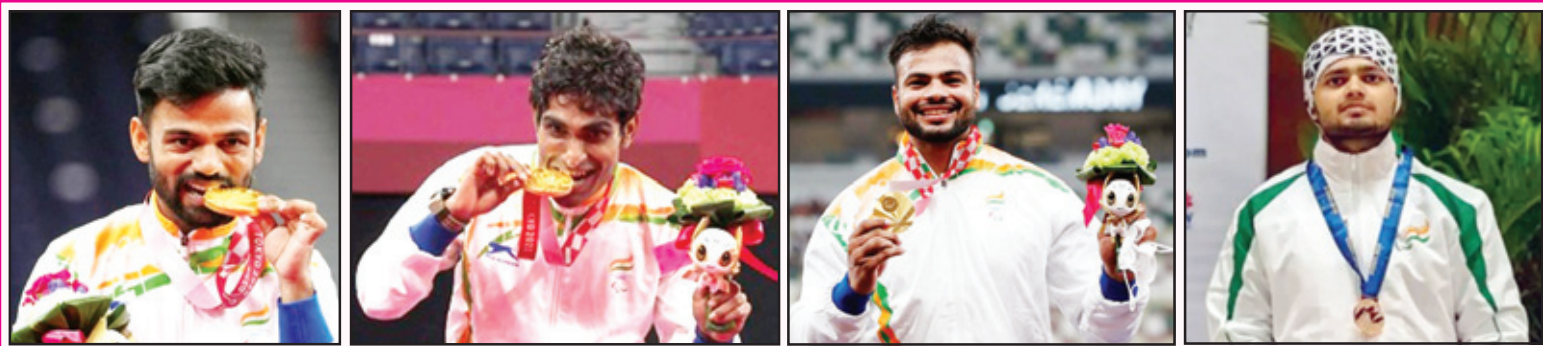
ਟੋਕੀਓ ਪੈਰਾਲੰਪਿਕਸ ਵਿਚ ਤਗਮੇ ਜਿੱਤਣ ਵਾਲੇ ਭਾਰਤੀ ਖਿਡਾਰੀ

ਟੈਨਿਸ ਖੇਡਣ ਵਾਲੀ ਭਾਵਨਾ ਪਟੇਲ ਸਾਲ 2013 ਵਿਚ ਵਿਸ਼ਵ ਦੀ ਨੰਬਰ ਦੋ ਖਿਡਾਰਨ ਰਹਿ ਚੁਕੀ ਹੈ। ਉਸ ਨੇ ਟੇਬਲ ਟੈਨਿਸ ਵਿਚ ਤਗਮਾ ਜਿੱਤਣ ਵਾਲੀ ਪਹਿਲੀ ਭਾਰਤੀ ਮਹਿਲਾ ਅਤੇ ਪੈਰਾਲੰਪਿਕਸ ਇਤਿਹਾਸ ਵਿਚ ਤਗਮਾ ਜਿੱਤਣ ਵਾਲੀ ਦੂਜੀ ਭਾਰਤੀ ਮਹਿਲਾ ਹੋਣ ਦਾ ਮਾਣ ਹਾਸਿਲ ਕੀਤਾ। ਭਾਰਤ ਵਲੋਂ ਪਹਿਲੀ ਤਗਮਾ ਜਿੱਤਣ ਵਾਲੀ ਮਹਿਲਾ ਦੀਪਿਕਾ ਮਲਿਕ ਸੀ, ਜਿਸ ਨੇ 2016 ਵਿਚ ਸ਼ਾਟ ਪੁੱਟ ਵਿਚ ਚਾਂਦੀ ਦਾ ਤਗਮਾ ਜਿੱਤਿਆ ਸੀ।