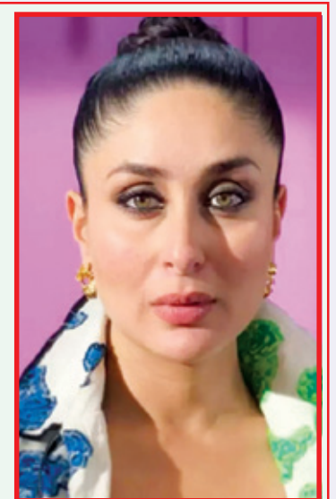
ਹੰਸਲ ਮਹਿਤਾ ਅਤੇ ਕਰੀਨਾ ਕਪੂਰ

'ਚਮੇਲੀ' ਆਈ ਤਾਂ ਉਸ ਦੇ ਸੁਹੱਪਣ ਦੇ ਨਾਲ-ਨਾਲ ਉਸ ਦੀ ਉਮਦਾ ਅਦਾਕਾਰੀ ਦੀ ਗੱਲ ਵੀ ਚੱਲੀ। ਇਸੇ ਸਾਲ ਹੀ ਉਸ ਦੀ ਇਕ ਹੋਰ ਫਿਲਮ 'ਦੇਵ' ਆਈ ਜਿਸ ਵਿਚ ਉਸ ਨੇ ਇਕ ਦੰਗਾ ਪੀੜਤ ਦਾ ਕਿਰਦਾਰ ਨਿਭਾਇਆ। ਇਸ ਫਿਲਮ ਤੋਂ ਬਾਅਦ ਫਿਲਮੀ ਦੁਨੀਆਂ ਵਿਚ ਉਸ ਦੀ ਵਾਹਵਾ ਪੈਂਠ ਬਣ ਗਈ। ਇਸ ਤੋਂ ਬਾਅਦ ਤਾਂ ਚੱਲ ਸੇ ਚੱਲ। 'ਓਮਕਾਰਾ', 'ਜਬ ਵੁਈ ਸੈੱਟ', 'ਕੁਰਬਾਨ', 'ਤਲਾਸ਼', 'ਹੀਰੋਇਨ', 'ਉਤਤਾ ਪੰਜਾਬ', 'ਸਿੰਘਮ ਚਿਟਰਨਜ਼', '3