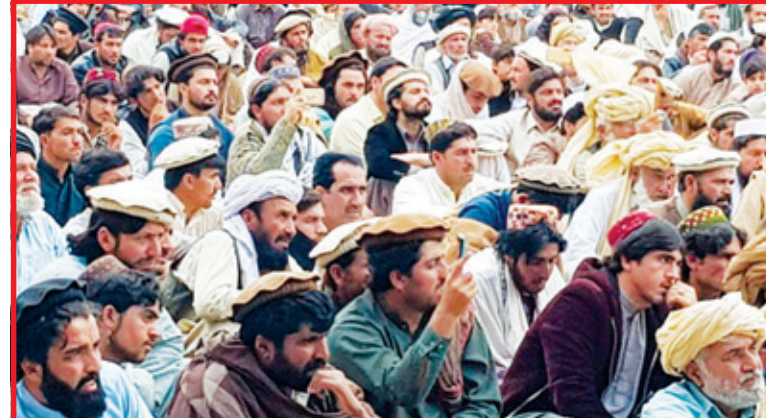
'ਬਫਰ' ਇਲਾਕੇ ਬਣਾ ਲਿਆ।

ਢਿੱਲੀ-ਮੱਠੀ ਚੱਲਣ ਵਾਲੀ ਇਹ ਪਖਤੂਨ ਮੁਹਿੰਮ ਪਾਕਿਸਤਾਨ ਅਤੇ ਅਫਗਾਨਿਸਤਾਨ ਦਰਮਿਆਨ ਸਰਹੱਦ ਤੈਅ ਕਰਦੀ 2670 ਕਿਲੋਮੀਟਰ ਲੰਮੀ ਡੂਰੰਡ ਲਕੀਰ ਨੂੰ ਨਹੀਂ ਮੰਨਦੀ। ਇਹ ਲਕੀਰ 1893 'ਚ ਇਕ ਅੰਗਰੇਜ਼ ਅਫਸਰ