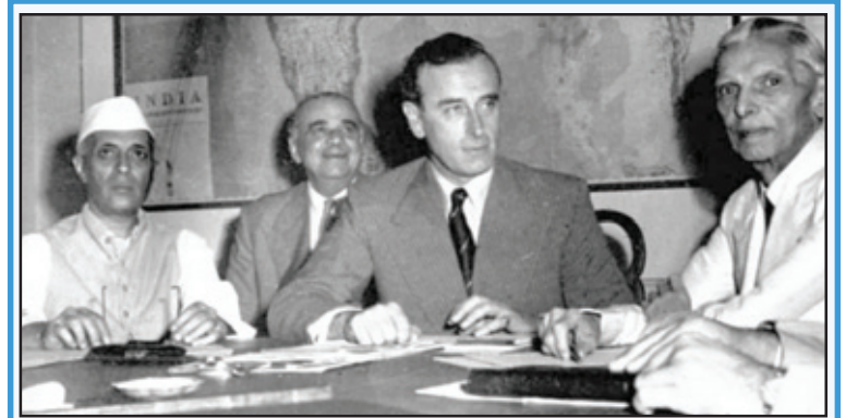
ਇਕ ਮੀਟਿੰਗ ਦੌਰਾਨ ਜਵਾਹਰ ਲਾਲ ਨਹਿਰੂ, ਸਰ ਸਿਰਿਲ ਰੈਡਕਲਿਫ ਅਤੇ ਮੁਹੰਮਦ ਅਲੀ ਜਿੰਨਾਹ।

ਕੀਰਤਨ ਦੌਰਾਨ ਕਹੀ ਸੀ ਕਿ ਸਿੱਖਾਂ ਵਿਚ ਹੀਣ-ਭਾਵਨਾ ਭਰੀ ਜਾ ਰਹੀ ਹੈ ਕਿ ਤੁਹਾਡੇ ਦੁੱਖਾਂ ਲਈ ਤੁਸੀਂ ਖੁਦ ਜ਼ਿੰਮੇਵਾਰ ਹੋ, ਇਹਦਾ ਸ਼ਿਕਾਰ 1947 ਦੇ ਪ੍ਰਸੰਗ ਵਿਚ ਮਾਸਟਰ ਤਾਰਾ ਸਿੰਘ ਵੀ ਬਣਿਆ ਹੈ। ਇਸ ਗੱਲ ਦੇ ਦਰਜਨਾਂ ਸਬੂਤ ਹਨ ਕਿ ਸਿੱਖ ਆਗੂ ਵੱਖਰਾ ਸਿੱਖ ਰਾਜ ਮੰਗ ਰਹੇ ਸਨ, ਇਸ ਗੱਲ ਦੇ ਵੀ ਸਬੂਤ ਹਨ ਕਿ ਅੰਗਰੇਜ਼ ਸਿੱਖਾਂ ਨੂੰ ਵੱਖਰਾ ਰਾਜ ਦੇਣ ਤੋਂ ਇਨਕਾਰੀ ਸਨ ਪਰ ਜਿਨ੍ਹਾਂ ਦਾ ਹੁਣ ਤੱਕ ਦਾ ਕੋਰਸ ਇਹ ਰਿਹਾ ਕਿ ਅੰਗਰੇਜ਼ ਬੜੇ ਚੰਗੇ ਸਨ, ਸਾਡੇ ਲੀਡਰ ਹੀ ਗੱਦਾਰ ਨਿਕਲੇ, ਉਹ ਮੰਨਦੇ ਨਹੀਂ। ਅੰਗਰੇਜ਼ ਤਾਂ ਹਿੰਦੋਸਤਾਨ ਦਾ