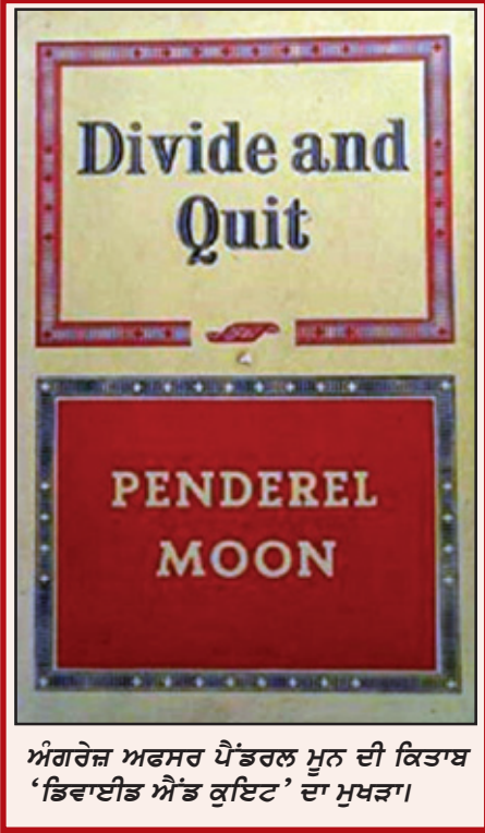
ਅੰਗਰੇਜ਼ ਅਫਸਰ ਪੈਂਡਰਲ ਮੂਨ ਦੀ ਕਿਤਾਬ 'ਡਿਵਾਈਡ ਐਂਡ ਕੁਇਟ' ਦਾ ਮੁਖੜਾ।