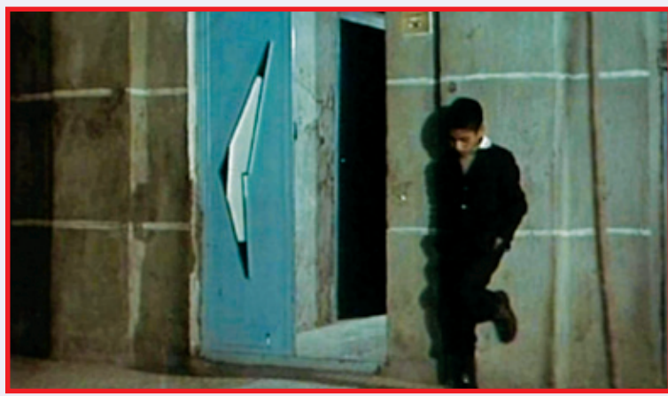
ਸੋਹਰਾਬ ਸ਼ਾਹਿਦ ਸਲੇਸ ਦੀ ਫਿਲਮ 'ਏ ਸਿੱਪਲ ਈਵੈਟ' ਦਾ ਦ੍ਰਿਸ਼ ਅਤੇ (ਸੱਜੇ) 'ਡਾਇਰੀ ਆਫ ਏ ਲਵਰ ਦਾ ਪੋਸਟਰ।

ਪ੍ਰਸਿੱਧ ਮੀਡੀਆ ਅਦਾਰੇ ਬੀ.ਬੀ.ਸੀ. ਨੇ ਆਪਣੇ ਇੱਕ ਮਹੱਤਵਪੂਰਨ ਲੇਖ ਵਿਚ ਇਸ ਤੱਥ ਦੀਆਂ ਤਹਿਤੀਆਂ ਫਰੋਲਣ ਦੀ ਕੋਸ਼ਿਸ਼ ਕੀਤੀ ਹੈ ਕਿ ਆਖਿਰ ਇਰਾਨੀ ਸਿਨੇਮਾ ਆਪਣੇ ਸੀਮਤ ਸਾਧਨਾਂ ਅਤੇ ਸਿਆਸੀ ਦਬਾਉ ਦੇ ਬਾਵਜੂਦ ਇੰਨੀਆਂ ਚੰਗੀਆਂ ਤੇ ਅਸਰਦਾਰ ਫਿਲਮਾਂ ਕਿਵੇਂ ਬਣਾ ਲੈਂਦਾ ਹੈ? ਇਸ ਲੇਖ ਵਿਚ ਇਰਾਨੀ ਸਿਨੇਮਾ ਦੀਆਂ ਜੜ੍ਹਾਂ ਬਾਰੇ ਬੀ.ਬੀ.ਸੀ. ਦੀ ਟਿੱਪਣੀ ਹੈ ਕਿ ਇਰਾਨੀ ਸਿਨੇਮਾ ਦੀ ਪਹਿਲੀ ਸਾਊਂਡ ਫਿਲਮ 1932 ਵਿਚ ਭਾਰਤ ਵਿਚ ਵਸੇ ਇਰਾਨੀ ਮੂਲ ਦੇ ਨਿਰਦੇਸ਼ਕ ਅਰਦੇਸ਼ਰ ਇਰਾਨੀ ਨੇ ਬੰਬਈ ਦੀ ਇੰਪੀਰੀਅਲ ਫਿਲਮ ਕੰਪਨੀ ਦੇ ਸਟੂਡੀਓ ਵਿਚ ਬਣਾ ਕੇ ਤਿਆਰ ਕੀਤੀ। ਇਸ ਤੱਥ ਰਾਹੀਂ ਬੀ.ਬੀ.ਸੀ. ਨੇ ਇਹ ਕਹਿਣ ਦੀ ਕੋਸ਼ਿਸ਼ ਕੀਤੀ ਹੈ ਕਿ ਇਰਾਨੀ ਸਾਹਿਤ, ਕਲਾਵਾਂ ਤੇ ਸਭਿਆਚਾਰ ਸਿਰਫ ਇਰਾਨ ਤੱਕ ਸੀਮਤ ਨਹੀਂ ਸਗੋਂ ਇਸ ਦਾ ਪਸਾਰ ਏਸ਼ੀਆਈ ਖਿੱਤਿਆਂ