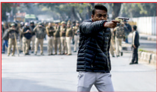
ਦਿੱਲੀ ਵਿਚ ਵਿਦਿਆਰਥੀਆਂ 'ਤੇ ਗੋਲੀ ਚਲਾ ਰਿਹਾ ਇਕ ਕੱਟੜਪੰਥੀ ਅਤੇ (ਸੱਜੇ) ਇਰਾਕ ਦੀ ਇਕ ਝਲਕ।