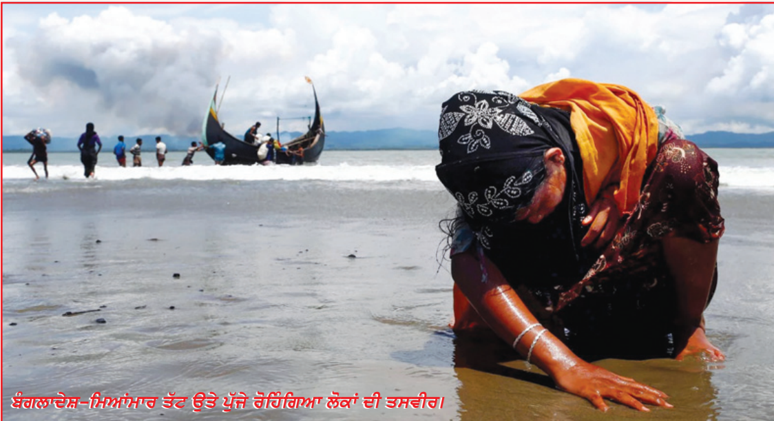
ਬੰਗਲਾਦੇਸ਼-ਮਿਆਂਮਾਰ ਝੱਟ ਉਤੇ ਪੁੱਜੇ ਰੋਹਿੰਗਿਆ ਲੋਕਾਂ ਦੀ ਤਸਵੀਰ।