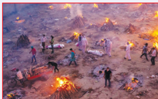
ਕਰੋਨਾ ਵਾਇਰਸ ਕਾਰਨ ਹੋਈਆਂ ਮੌਤਾਂ ਕਾਰਨ ਬਲ ਰਹੇ ਸ਼ਮਸ਼ਾਨਘਾਟ। ਇਨ੍ਹਾਂ ਤਸਵੀਰਾਂ ਨੇ ਭਾਰਤ ਸਰਕਾਰ ਦੀ ਨਾ-ਅਹਿਲੀਅਤ ਦੀ ਗੱਲ ਸੰਸਾਰ ਭਰ ਵਿਚ ਪੁੱਜਦੀ ਕਰ ਦਿੱਤੀ ਸੀ।