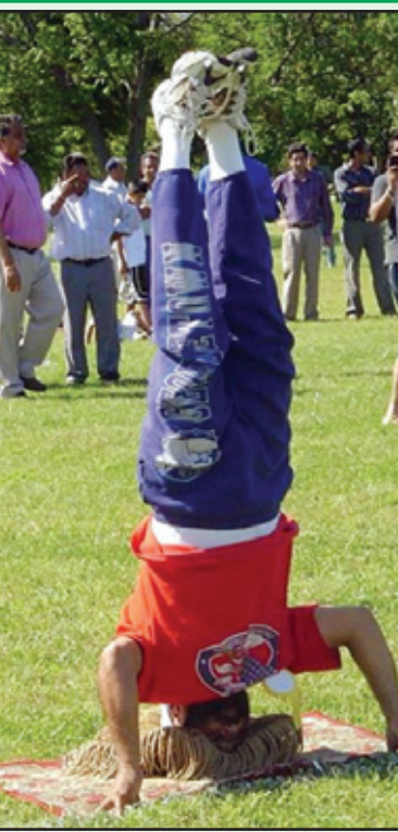
ਸਿਰ ਭਾਰ ਖੜ੍ਹ ਕੇ ਖੇਡ ਮੇਲੇ 'ਚ ਜੌਹਰ ਵਿਖਾਉਂਦਿਆਂ...