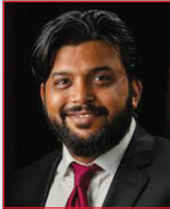
ਮਿਸਾਲੀ ਫੋਟੋਗ੍ਰਾਫਰ ਦਾਨਿਸ਼ ਸਿੱਦੀਕੀ ਦੀਆਂ ਦੋ ਵੱਖ-ਵੱਖ ਤਸਵੀਰਾਂ।