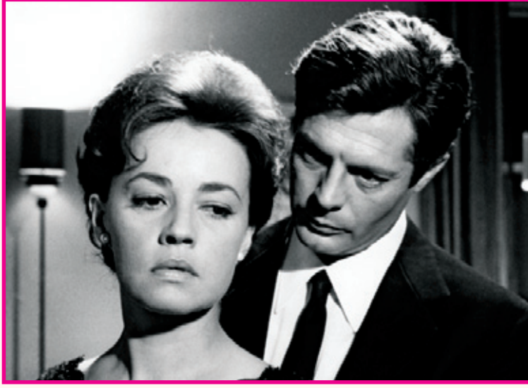
ਫਿਲਮ 'ਲਾ ਨੌਟੇ' ਦਾ ਇਕ ਹੋਰ ਦ੍ਰਿਸ਼।

ਫਿਲਮ ਵਿਚ ਵਿਚਾਰਧਾਰਕ ਤੌਰ 'ਤੇ ਦੂਜਾ ਨੁਕਤਾ ਪੁੰਜੀਵਾਦ ਦੁਆਰਾ ਵਿਅਕਤੀਆਂ ਨੂੰ ਕੁਦਰਤ ਨਾਲੋਂ ਨਿਖੇੜ ਕੇ ਗੈਰ-ਕੁਦਰਤੀ ਜੀਵਨ ਢੰਗ ਵੱਲ ਧੱਕਣ ਦਾ ਹੈ। ਇਸ ਨੂੰ ਇਸ ਫਿਲਮ ਦੇ ਮੀਂਹ ਵਾਲੇ ਦ੍ਰਿਸ਼ ਰਾਹੀਂ ਸਮਝਿਆ ਜਾ ਸਕਦਾ ਹੈ। ਇੱਕ ਉਚ ਵਰਗੀ ਘਰ ਵਿਚ ਪਾਰਟੀ ਹੋ ਰਹੀ ਹੈ। ਘਰ ਦੇ ਐਨ ਵਿਚਕਾਰ ਨਹਾਉਣ ਲਈ ਤਲਾਅ ਦਾ ਪ੍ਰਬੰਧ ਹੈ ਪਰ ਇਹ ਸਾਫ-ਸਫਾਫ ਪਾਣੀ ਮਹਿਮਾਨਾਂ ਦੇ ਸਿਰਫ ਦੇਖਣ ਲਈ ਹੈ। ਅਚਾਨਕ ਮੀਂਹ ਪੈਣਾ ਸ਼ੁਰੂ ਹੋ ਜਾਂਦਾ ਹੈ। ਪਾਰਟੀ ਦੀ ਮਨਸੂਈ ਸਜਾਵਟ ਵਿਗੜਨ ਲੱਗਦੀ ਹੈ। ਮੇਕਅੱਪ ਦੇ ਉਹਲਿਓ ਅਸਲੀ ਮੁਸਕਾਨਾਂ ਬਾਹਰ ਆਉਣ ਲੱਗਦੀਆਂ ਹਨ। ਹੁਣ ਉਨ੍ਹਾਂ ਨੂੰ ਖੁਸ਼ ਹੋਣ ਲਈ ਸ਼ਰਾਬ, ਸਿਗਰਟ ਜਾਂ ਫੈਸ਼ਨ ਦੀ ਜ਼ਰੂਰਤ ਨਹੀਂ। ਮੀਂਹ ਨੇ ਜਿਵੇਂ ਉਨ੍ਹਾਂ ਦੀ ਤਰਤੀਬਦਾਰ ਉਦਾਸੀ ਅਤੇ ਆਤਮ-ਮੁਗਧ ਹੋਣ ਦੀ ਹਾਲਤ ਨੂੰ ਤਹਿਸ-ਨਹਿਸ ਕਰ ਦਿੱਤਾ ਹੈ। ਉਹ ਸਾਰੇ ਮੇਲੇ ਵਿਚ ਗੁਆਚੇ ਬੱਚਿਆਂ ਵਾਂਗ ਮੀਂਹ ਤੋਂ ਬਚਣ ਲਈ ਭੱਜ ਰਹੇ ਹਨ, ਹੜਦੁੰਗ ਕਰ ਰਹੇ ਹਨ ਪਰ ਅੰਦਰੋਂ ਇਸੇ ਵਿਚ ਗੁੱਝ ਹੋਣਾ ਚਾਹੁੰਦੇ ਹਨ। ਮੀਂਹ ਨੇ ਕੁਝ ਦੇਰ ਲਈ ਉਨ੍ਹਾਂ ਦੇ ਜਮਾਤੀ ਲਕਬ ਅਤੇ ਨਕਾਬ ਨੱਚ ਸੁੱਟੇ ਹਨ। ਉਨ੍ਹਾਂ ਵਿਚੋਂ ਕੁਝ ਫਰਸਾਂ 'ਤੇ ਹੀ ਲਿਟਣ ਲੱਗਦੇ ਹਨ ਤੇ ਕੁਝ ਇੱਕ-ਦੂਜੇ ਨੂੰ ਤਲਾਬ ਵਿਚ ਸੁੱਟਣ ਤੱਕ ਜਾਂਦੇ ਹਨ। ਇਹ ਅਰਾਜਕ ਹਾਲਤ ਹੈ ਪਰ ਸ਼ਾਇਦ ਇਹੀ ਆਦਰਸ਼ਕ ਹਾਲਤ ਵੀ ਹੈ।