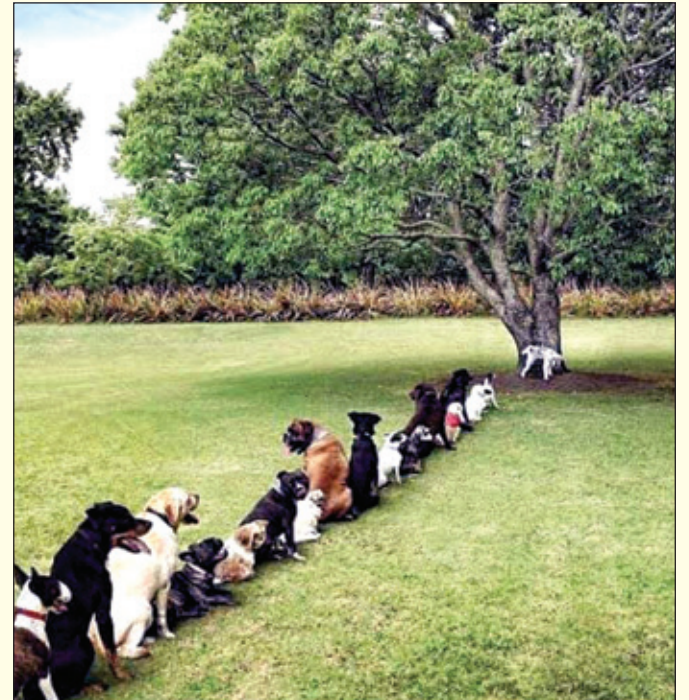
ਫੋਟੋ ਖਿੱਚੀ ਹੈ ਭਾਵੇਂ ਰਤਾ ਜ਼ੋਰ ਲਾ ਕੇ, ਪਰ ਸੁਨੇਹੇ ਦਾ ਕੋਈ ਜਵਾਬ ਨਾਹੀਂ। ਕਹਿੰਦੇ ਸਬਰ-ਸੰਜਮ ਦੀਆਂ ਬਰਕਤਾਂ ਨੇ, ਇਹਦੇ ਜਿਹਾ ਕੋਈ ਸਵਾਬ ਨਾਹੀਂ।