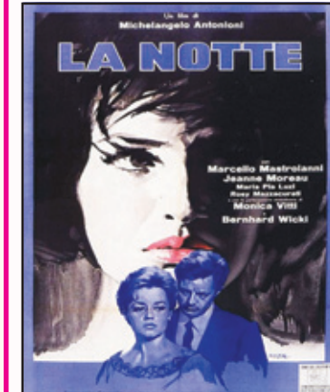
ਫਿਲਮ 'ਲਾ ਨੌਟੇ' ਦਾ ਪੋਸਟਰ ਅਤੇ (ਸੱਜੇ) ਸੰਸਾਰ ਦਾ ਉਘਾ ਫਿਲਮਸਾਜ਼ ਮਾਈਕਲਏਂਜਲੋ ਅੰਤੋਨੀਓਨੀ।