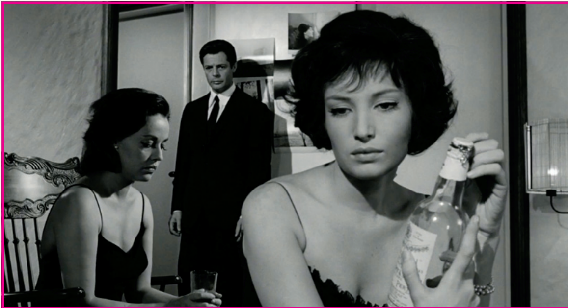
ਫਿਲਮਸਾਜ਼ ਮਾਈਕਲਏਂਜਲੋ ਅੰਤੋਨੀਓਨੀ ਦੀ ਫਿਲਮ 'ਲਾ ਨੌਟੇ' ਦਾ ਇਕ ਦ੍ਰਿਸ਼।