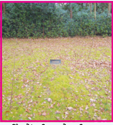
ਇੰਗਲੈਂਡ ਵਿਚ ਹੁਸੈਨ ਦੀ ਕਬਰ।