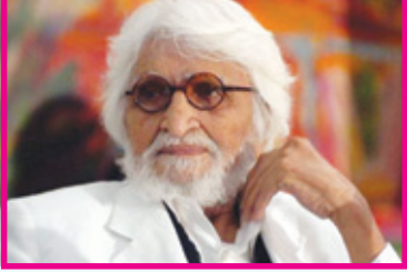
ਮਕਬੂਲ ਫਿਦਾ ਹੁਸੈਨ