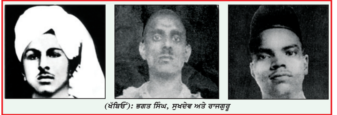
(ਖੱਬਿਓ): ਭਗਤ ਸਿੰਘ, ਸੁਖਦੇਵ ਅਤੇ ਰਾਜਗੁਰੂ

ਇਹ ਲੜਾਈ ਪ੍ਰਗਟ ਰੂਪ ਵਿਚ ਹੋਵੇ, ਕਦੀ ਖੁਫੀਆ, ਕਦੀ ਨਿਰੋਲ ਅੰਦੋਲਨਕਾਰੀ ਤੇ ਕਦੇ ਇਹ ਇੰਨੀ ਭਿਆਨਕ ਹੋਵੇ ਕਿ ਜੀਵਨ ਤੇ ਮੌਤ ਦੀ ਬਾਜ਼ੀ ਲੱਗ ਜਾਵੇ ਪਰ ਇਹ ਕਿਹੋ ਜਿਹਾ ਰੂਪ ਧਾਰਦੀ ਹੈ, ਖੂਨੀ ਜਾਂ ਬੋਝੂ ਸ਼ਾਂਤੀਪੂਰਨ, ਇਸ ਦੀ ਚੋਣ ਤੁਹਾਡੇ 'ਤੇ ਨਿਰਭਰ ਹੈ। ਸੋ, ਤੁਸੀਂ ਇਸ ਦੇ ਰੂਪ ਦੇ ਚੋਣ ਆਪਣੀ ਮਰਜ਼ੀ ਮੁਤਾਬਕ ਕਰ ਸਕਦੇ ਹੋ ਪਰ ਇਹ ਜੰਗ, ਐਵੇਂ ਨਿੱਕੀਆਂ-ਨਿੱਕੀਆਂ ਗੱਲਾਂ ਵਿਚ ਪਏ ਬਗੈਰ ਤੇ ਬੇਮਤਲਬ ਨੈਤਿਕ ਸਿਧਾਂਤਾਂ ਵਿਚ ਉਲਝੇ ਬਿਨਾਂ ਲਗਾਤਾਰ ਚਲਦੀ ਰਹੇਗੀ। ਜਦ ਤਕ ਸਮਾਜਵਾਦੀ ਲੋਕਰਾਜ ਸਥਾਪਤ ਨਹੀਂ ਹੋ ਜਾਂਦਾ, ਤੇ ਸਮਾਜ ਦਾ ਵਰਤਮਾਨ ਢਾਂਚਾ ਖਤਮ ਕਰ ਕੇ ਉਸ ਦੀ ਥਾਂ ਸਮਾਜ ਖੁਸ਼ਹਾਲੀ ਤੇ ਆਧਾਰਤ ਨਵਾਂ ਸਮਾਜਕ ਢਾਂਚਾ ਨਹੀਂ ਉਸਰ ਜਾਂਦਾ, ਜਦ ਤਕ ਹਰ ਕਿਸਮ ਦੀ ਲੁੱਟ-ਖਸੁੱਟ ਅਸੰਭਵ ਬਣਾ ਕੇ ਮਨੁੱਖਤਾ ਉਤੇ ਅਸਲ ਤੇ ਸਥਾਈ ਅਮਨ ਦੀ ਛਾਂ ਨਹੀਂ ਹੁੰਦੀ, ਤਦ ਤਕ ਇਹ ਜੰਗ ਹੋਰ ਨਵੇਂ ਜੋਸ਼, ਹੋਰ ਵਧੇਰੀ ਨਿਡਰਤਾ, ਬਹਾਦਰੀ ਤੇ ਅਟੱਲ ਇਰਾਦੇ ਨਾਲ ਲੜੀ ਜਾਂਦੀ ਰਹੇਗੀ। ਨਿਕਟ ਭਵਿੱਖ ਵਿਚ ਆਖਰੀ ਯੁੱਧ ਲੜਿਆ ਜਾਵੇਗਾ ਤੇ ਉਹ ਫੈਸਲਾਕੁਨ ਹੋਵੇਗਾ।