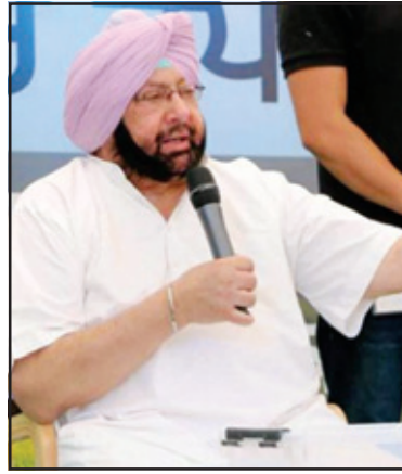
ਕੀਤਾ ਹੈ ਤਾਂ ਉਸ ਨੂੰ ਇਸ ਦੀ ਕੀਮਤ ਚੁਕਾਉਣੀ ਪਵੇਗੀ।

ਨਸ਼ਿਆਂ ਦੇ ਖਾਤਮੇ ਬਾਰੇ ਅੰਕੜੇ ਪੇਸ਼ ਕਰਦਿਆਂ ਅਮਰਿੰਦਰ ਨੇ ਕਿਹਾ ਕਿ ਨਕਲੀ ਸ਼ਰਾਬ ਦੇ ਦੁਖਾਂਤ ਦੇ ਸਾਰੇ ਦੋਸ਼ੀਆਂ ਅਤੇ ਖੰਨਾ ਗੈਰ-ਕਾਨੂੰਨੀ ਫੈਕਟਰੀ ਕੇਸ ਦੀ ਸ਼ਨਾਖਤ ਕਰ ਕੇ ਚਾਰਜਸ਼ੀਟ ਕਰਨ ਦੇ ਨਾਲ ਸਪਲਾਈ ਚੇਨ ਤੋੜੀ ਗਈ ਹੈ। ਉਨ੍ਹਾਂ ਦਾਅਵੇ ਨਾਲ ਕਿਹਾ ਕਿ ਵੱਖ-ਵੱਖ ਮਾਫੀਆ (ਰੇਤ, ਸਰਾਬ, ਟਰਾਂਸਪੋਰਟ, ਨਸ਼ਾ ਆਦਿ) ਨੂੰ ਖਤਮ ਕਰਨ ਦਾ ਅਮਲ ਨਿਰੰਤਰ ਜਾਰੀ ਹੈ। ਉਨ੍ਹਾਂ ਨਸ਼ਾ ਤਸਕਰੀ ਬਾਰੇ ਪੁਲਿਸ ਅਫਸਰਾਂ ਦੀਆਂ ਬੰਦ ਰਿਪੋਰਟਾਂ ਬਾਰੇ ਵੀ ਕੋਈ ਗੱਲ ਨਹੀਂ ਕੀਤੀ। ਮੁੱਖ ਮੰਤਰੀ ਨੇ ਗੈਂਗਸਟਰ ਮੁਖਤਾਰ ਅੰਸਾਰੀ ਬਾਰੇ ਮਾਮਲਾ ਅਦਾਲਤ ਵਿਚ ਵਿਚਾਰ ਅਧੀਨ ਹੋਣ ਦੀ ਗੱਲ ਆਖੀ ਅਤੇ ਇਹ ਵੀ ਕਿਹਾ ਕਿ ਜੇ ਅੰਸਾਰੀ ਨੇ ਪੰਜਾਬ ਵਿਚ ਜੁਰਮ