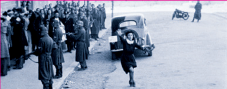
ਫਿਲਮ 'ਰੋਮ, ਓਪਨ ਸਿਟੀ' ਦਾ ਦ੍ਰਿਸ਼।

ਫਿਲਮ ਵਿਚ ਕਮਿਊਨਿਸਟਾਂ ਵਲੋਂ ਆਮ ਲੋਕਾਂ ਵਿਚ ਜਗਾਈ ਉਮੀਦ ਅਤੇ ਫਾਸ਼ੀਵਾਦੀਆਂ ਦਾ ਡੱਟਵਾਂ ਵਿਰੋਧ ਕਰਨ ਲਈ ਤਤਪਰਤਾ ਚਿੱਟੇ ਦਿਨ ਵਾਂਗ ਸਾਫ਼ ਹੈ। ਫਾਸ਼ੀਵਾਦੀਆਂ ਦੁਆਰਾ ਅੰਨ੍ਹਾ ਤਸੱਦਦ ਕਰਨ ਦੇ ਬਾਵਜੂਦ ਫਿਲਮ ਦੇ ਮੁੱਖ ਕਿਰਦਾਰ ਵਲੋਂ ਆਪਣੇ ਸਿਰਤ ਤੋਂ ਨਾ ਬਿੜਕਣਾ, ਬੱਚਿਆਂ ਦੁਆਰਾ ਛੋਟੇ-ਛੋਟੇ ਬੰਬ ਬਣਾ ਕੇ ਫਾਸ਼ੀਵਾਦੀਆਂ ਨੂੰ ਆਪਣੀ ਜ਼ਮੀਨ ਤੋਂ ਉਖਾੜਨ ਦੀ ਜੱਦੋਜਹਿਦ ਤੇ ਔਰਤਾਂ ਵਲੋਂ ਬਿਨਾ ਡਰੇ ਫਾਸ਼ੀਵਾਦੀਆਂ ਦੀਆਂ ਅੱਖਾਂ ਵਿਚ ਅੱਖਾਂ ਪਾ ਕੇ ਦੇਖਣ ਦਾ ਵਲ, ਇਹ ਸਾਰਾ ਕੁਝ ਇੰਨੀ ਸਹਿਜਤਾ ਅਤੇ ਵਿਦਰੋਹੀ ਸੂਰ ਵਿਚ ਵਧਦਾ ਹੈ ਕਿ ਇੱਕ ਦ੍ਰਿਸ਼ ਤੋਂ ਬਾਅਦ ਦੂਜੇ ਦ੍ਰਿਸ਼ ਤੱਕ ਪਹੁੰਚਦੇ ਦਰਸ਼ਕਾਂ ਅੱਗੇ ਇਤਿਹਾਸ ਦੇ ਸਾਰੇ ਵਰਕੇ ਖੁੱਲ੍ਹਦੇ ਜਾਂਦੇ ਹਨ। ਉਹ ਇਸ ਫਿਲਮ ਦੇ ਕਿਰਦਾਰਾਂ ਦੀਆਂ ਨਾਲ ਵਾਪਰ ਰਹੀ ਅਣਹੋਣੀ ਦਾ ਗਵਾਹ ਬਣ ਜਾਂਦਾ ਹੈ। ਫਿਲਮ ਵਿਚ ਬਹੁਤੇ ਅਦਾਕਾਰ ਆਮ ਲੋਕ ਹਨ। ਫਿਲਮ ਜ਼ਿਆਦਾਤਰ ਗਲੀਆਂ ਅਤੇ ਸਾਧਾਰਨ ਥਾਵਾਂ 'ਤੇ ਫਿਲਮਾਈ ਗਈ ਹੈ। ਕਿਤੇ ਵੀ ਕੋਈ ਵੀ ਸ਼ਬਦ ਜਾਂ ਦ੍ਰਿਸ਼ ਵਾਧੂ ਨਹੀਂ ਭਾਸਿਆ। ਇਸ ਤਰ੍ਹਾਂ ਤੇ ਸਿਨੇਮਾ ਨੂੰ ਪੌਪਕੋਰਨ ਖਾਂਦੇ ਹੋਏ ਜਾਂ ਪੈਪਸੀ ਪੀਂਦਿਆਂ ਨਹੀਂ ਦੇਖਿਆ ਜਾ ਸਕਦਾ। ਇਹ ਫਿਲਮ ਬਹੁਤ ਕੁਝ ਅਣਕਿਹਾ ਜਾ ਛੱਡ ਜਾਂਦੀ ਹੈ। ਫਿਲਮ ਦੇਖਦੇ ਸਮੇਂ ਫਿਲਮਸਾਜ਼ ਦੀ ਸਿਆਸੀ ਅਤੇ ਸਮਾਜਕ ਸਮਝ 'ਤੇ ਰਸ਼ਕ ਆਉਂਦਾ ਹੈ। ਇਸੇ ਕਰ ਕੇ ਉਸ ਨੂੰ ਨਵ-ਯੁਗਰਥਵਾਦੀ ਸਿਨੇਮਾ ਦਾ ਪਿਤਾ ਕਿਹਾ ਜਾਂਦਾ ਹੈ।