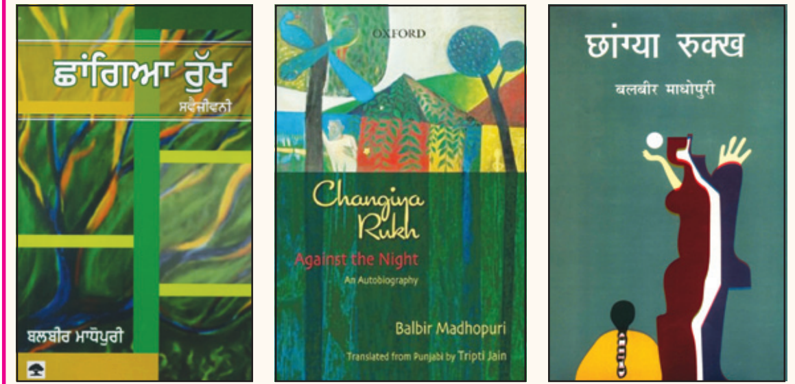
ਛਾਂਗਿਆ ਰੁੱਖ: (ਖੱਬਿਓ) ਪੰਜਾਬੀ, ਅੰਗਰੇਜ਼ੀ ਅਤੇ ਹਿੰਦੀ ਵਿਚ ਛਪੀਆਂ ਕਿਤਾਬਾਂ ਦੇ ਮੁਖੜੇ।

ਸਾਨੂੰ ਨਫਰਤ ਕਰਦੇ ਹਨ ਅਤੇ ਇਸੇ ਕਰ ਕੇ ਸਾਡੇ ਅਤੇ ਉਨ੍ਹਾਂ ਦੇ ਸਿਵੇ ਅਲੱਗ-ਅਲੱਗ ਹਨ। ਜਦੋਂ ਵੱਡਾ ਹੋ ਰਿਹਾ ਸਾਂ, ਭਾਈਏ ਅਤੇ ਤਾਏ ਦੇ ਪੁੱਤਾਂ ਮੁਤਾਬਕ ‘ਮੈਂ ਪੰਜਾਲੀ ਖਿੱਚਣ ਜੋਗਾ ਹੋ ਗਿਆ’, ਤਾਂ ਆਪਣੇ ਪਿੰਡ ਤੇ ਨਾਲ ਦੇ ਪਿੰਡਾਂ ਦੇ ਜ਼ਿੰਮੀਦਾਰਾਂ ਦੇ ਖੇਤ ਮਜ਼ਦੂਰੀ ਕਰਨ