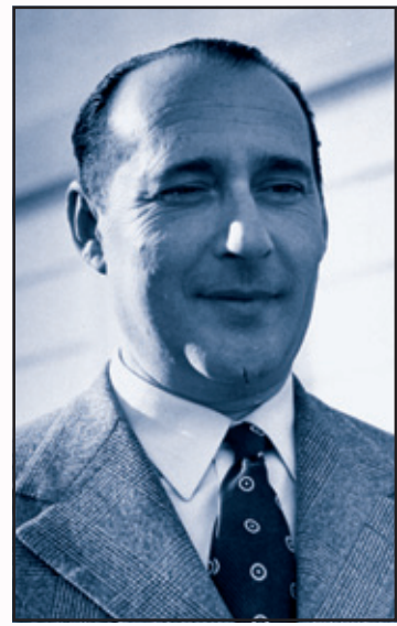
ਫਿਲਮਸਾਜ਼ ਰੋਬਰਤੋ ਰਸੋਲਿਨੀ (ਖੱਬੇ) ਅਤੇ 'ਰੋਮ, ਓਪਨ ਸਿਟੀ' ਦਾ ਪੋਸਟਰ।