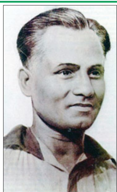
ਧਿਆਨ ਸਿੰਘ ਉਰਫ ਧਿਆਨ ਚੰਦ