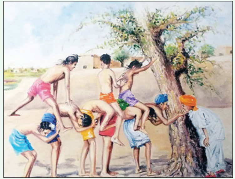
ਹੁਣ ਤਾਂ ਮੋਬਾਈਲਾਂ ਨੇ ਹੈਨ ਮੱਤਾਂ ਮਾਰੀਆਂ। ਹੋ ਗਈਆਂ ਅਲੋਪ ਖੇਡਾਂ ਇਹ ਪਿਆਰੀਆਂ!