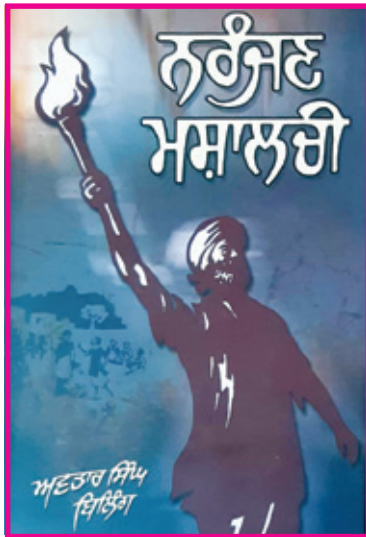
ਅਵਤਾਰ ਬਿਲਿੰਗ ਦੇ ਪਹਿਲੇ ਨਾਵਲ 'ਨਰੰਜਣ ਮਸਾਲਚੀ' ਦਾ ਮੁਖੜਾ।