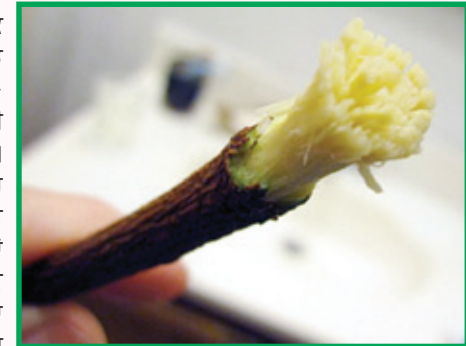
ਨਿੱਮ ਦੀ ਦਾੜਣ

ਸੁਬੂ ਦੀਆਂ ਪਕਾਈਆਂ ਰੋਟੀਆਂ ਦੁਪਹਿਰੇ ਲੂਣ, ਮਿਰਚ ਭੁੱਕ ਕੇ ਚਾਹ ਨਾਲ ਖਾ ਲੈਣੀਆਂ, ਕਈ ਕੋਕਲੀ ਬਣਾ ਕੇ ਚਾਹ ਦੇ ਗਲਾਸ ਵਿਚ ਡੁਬੋ-ਡੁਬੋ ਕੇ ਵੀ ਖਾਂਦੇ ਹੁੰਦੇ ਸੀ। ਕੋਕਲੀ ਨੂੰ ਨਵਾਂ ਜ਼ਮਾਨਾ ਹੁਣ ‘ਰੋਲ’ ਕਹਿੰਦਾ ਏ। ਗੰਢੇ ਨੂੰ