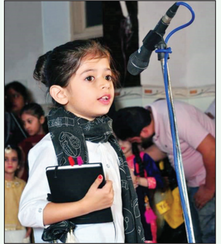
ਦਿਲ ਆਪਣਾ ਰਹੋ ਅੱਪਡੇਟ ਕਰਦੇ, ਦਕਿਆਨੁਸੀ ਵਿਚਾਰਾਂ ਨੂੰ ਕੱਢ ਦੇਵੋ। ਜੁੱਗ ਆ ਗਿਆ ਨਵੇਂ ਸਵੇਰਿਆਂ ਦਾ, ਧੀਆਂ-ਪੁੱਤਾਂ ਦੇ ਫਰਕ ਨੂੰ ਛੱਡ ਦੇਵੋ!