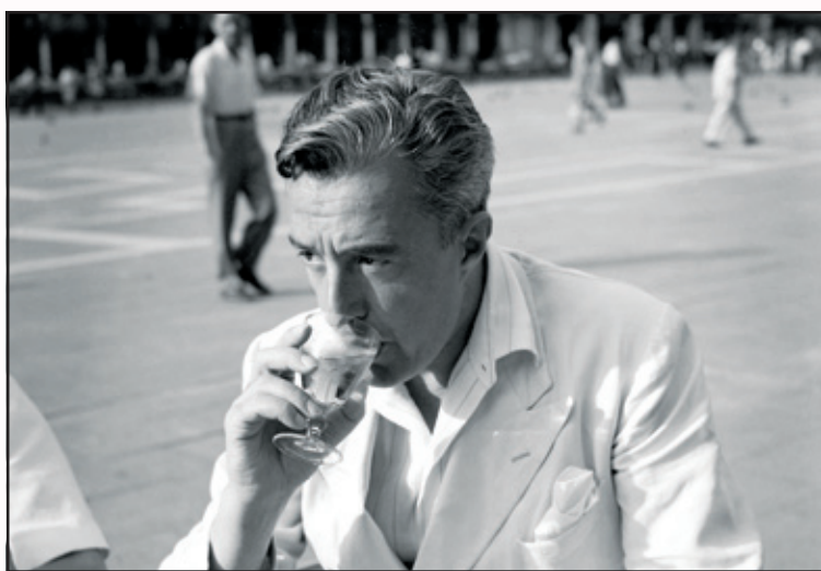
ਫਿਲਮ 'ਅੰਬੈਰਟੋ-ਡੀ' ਦਾ ਪੋਸਟਰ ਅਤੇ ਫਿਲਮਸਾਜ਼ ਵਿਤੋਰੀਓ ਦਿ ਸੀਕਾ।

ਬਿਲਕੁਲ ਸੰਭਵ ਹੈ ਜਿਸ ਵਿਚ ਪੂਰੀ ਫਿਲਮ ਦੌਰਾਨ ਮੁੱਖ ਕਿਰਦਾਰ ਕੋਈ ਵੀ ਕੰਮ ਨਾ ਕਰੇ। ਇਸ ਫਿਲਮ ਦਾ ਮੁੱਖ ਕਿਰਦਾਰ ਜਿਸ ਦੀ ਭੂਮਿਕਾ ਵਿਤੋਰੀਓ ਦਿ ਸੀਕਾ ਦੇ ਇੱਕ ਅਧਿਆਪਕ ਨੇ ਨਿਭਾਈ ਹੈ, ਸਾਰੀ ਫਿਲਮ ਵਿਚ ਸਿਰਫ ਜਿਉਣ ਦੇ ਬਹਾਨੇ ਲੱਭਦਾ ਫਿਰਦਾ ਹੈ। ਹੁਣ ਧਿਆਨ ਦੇਣ ਯੋਗ ਗੱਲ ਇਹੀ ਹੈ: ਕੀ ਜ਼ਿੰਦਗੀ ਜਿਉਣ ਦੇ ਹੀਲੇ-ਵਸੀਲੇ ਲੱਭਣ ਦੀ ਤਲਾਸ਼ ਨੂੰ ਕੰਮ ਦੇ ਤੌਰ 'ਤੇ ਗਿਣਿਆ ਜਾ ਸਕਦਾ ਹੈ?