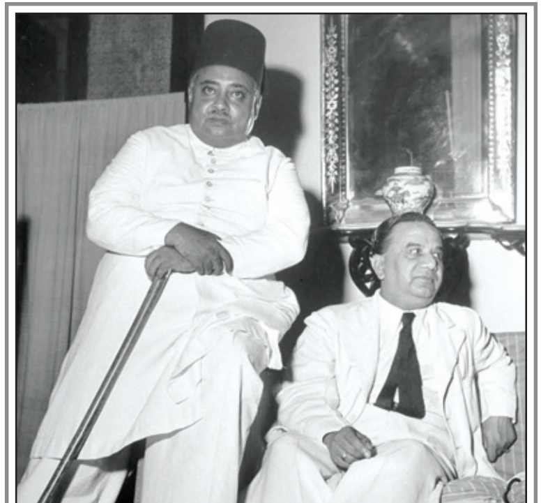
ਖਵਾਜਾ ਨਜ਼ੀਮੁੱਦੀਨ ਅਤੇ ਸੁਹਰਾਵਰਦੀ