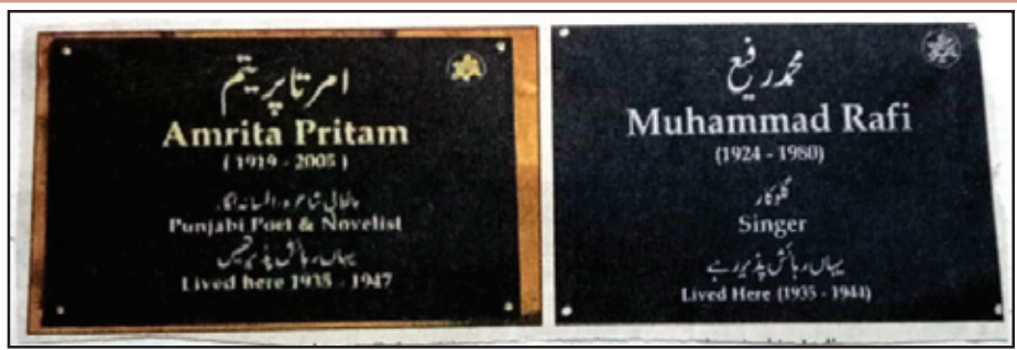
ਅੰਮ੍ਰਿਤਾ ਪ੍ਰੀਤਮ ਤੇ ਮੁਹੰਮਦ ਰਫੀ ਦੇ ਨਾਂ ਦੀਆਂ ਤਖਤੀਆਂ