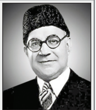
ਲਿਆਕਤ ਅਲੀ ਖਾਨ

ਭਾਰਤ ਦੇ 32 ਕਰੋੜ ਹਿੰਦੂਆਂ ਨੇ ਮੈਨੂੰ ਗੱਦਾਰ ਕਿਹਾ, ਹਿੰਦੂਆਂ ਅਤੇ ਹਿੰਦੁਸਤਾਨ ਦਾ ਦੁਸ਼ਮਣ ਕਿਹਾ। ਮੈਂ ਪਾਕਿਸਤਾਨ ਦੀ ਵਫ਼ਾਦਾਰੀ ਨਿਭਾਉਣ ਵਿਚ ਚੱਟਾਨ ਵਾਂਗ ਖਲੋਣਾ ਰਿਹਾ। ਮੈਨੂੰ ਮਾਣ ਹੋਇਆ ਕਿ ਮੇਰੇ ਕਹਿਣ ‘ਤੇ 70 ਲੱਖ ਦਲਿਤ ਪਾਕਿਸਤਾਨ ਦੇ ਹੱਕ ਵਿਚ ਖਲੋ ਗਏ।