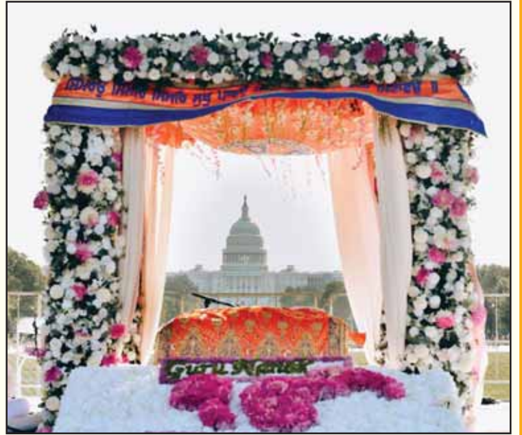
ਅਮਰੀਕੀ ਸੰਸਦ ਦੇ ਪਿਛੋਕੜ ਵਿਚ ਗੁਰੂ ਗ੍ਰੰਥ ਸਾਹਿਬ ਦਾ ਪ੍ਰਕਾਸ਼