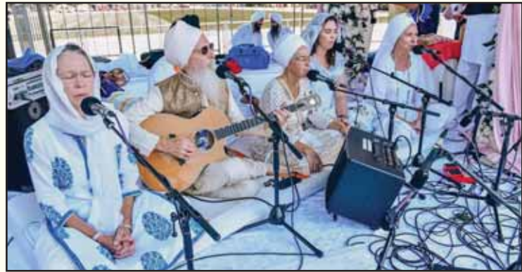
ਅਮਰੀਕਨ ਸਿੱਖਾਂ ਦਾ ਜਥਾ ਕੀਰਤਨ ਕਰਦਾ ਹੋਇਆ