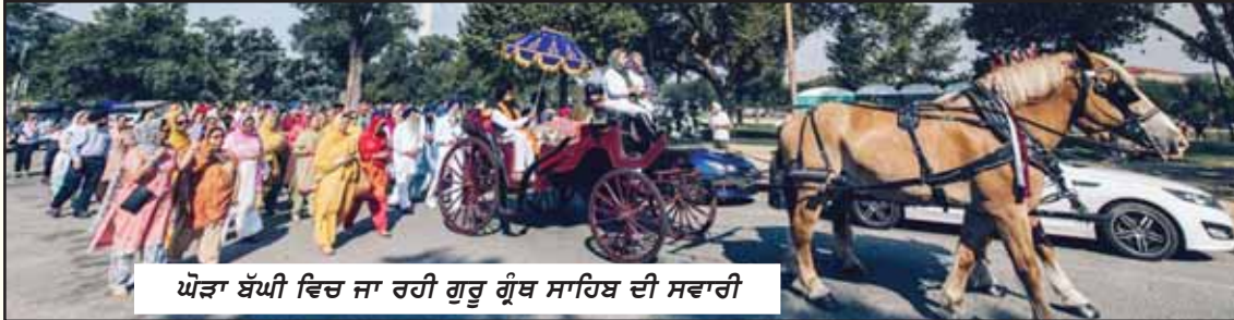
ਘੋੜਾ ਬੱਧੀ ਵਿਚ ਜਾ ਰਹੀ ਗੁਰੂ ਗ੍ਰੰਥ ਸਾਹਿਬ ਦੀ ਸਵਾਰੀ

ਸਟੇਜ 'ਤੇ ਸ੍ਰੀ ਗੁਰੂ ਗ੍ਰੰਥ ਸਾਹਿਬ ਦੇ ਪ੍ਰਕਾਸ਼ ਦੇ ਪਿਛੋਕੜ ਵਿਚ ਅਮਰੀਕੀ ਸਰਕਾਰ ਦੇ ਗੁੰਬਦਾਂ ਦਾ ਨਜ਼ਾਰਾ ਅਤਿ ਰੋਚਕ ਸੀ। ਭਾਵੇਂ ਪੰਡਾਲ ਨੇੜੇ ਖਾਲਿਸਤਾਨੀ ਸਮਰਥਕ ਝੰਡੇ ਲਹਿਰਾਉਂਦੇ ਤੇ