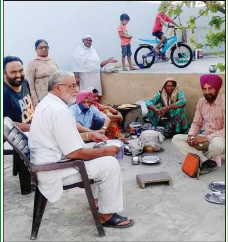
ਤਪਦਾ ਚੁੱਲ੍ਹਾ ਟੱਬਰ ਸਾਰਾ ਕਰ ਦਿੰਦਾ ਸੀ 'ਕੱਠਾ। ਗੈਸ-ਸਲੰਡਰ ਵੜੇ ਰਸੋਈ, 'ਕੱਠ ਦਾ ਬਹਿ ਗਿਆ ਭੱਠਾ।