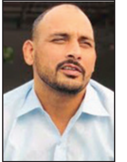
ਮੰਗੀ ਬੱਗਾ ਪਿੰਡ

ਸਹੋਤਾ ਭਰਾਵਾਂ ਨੇ ਕਿਹਾ ਕਿ ਕਲੱਬ ਵਲੋਂ ਪ੍ਰਬੰਧਾਂ ਵਿਚ ਕੋਈ ਵੀ ਕਮੀ ਪੇਸ਼ ਨਹੀਂ ਆਉਣ ਦਿੱਤੀ ਜਾਵੇਗੀ ਅਤੇ ਦਰਸ਼ਕਾਂ ਦੀ ਹਰ ਸਹੂਲਤ ਦਾ ਖਿਆਲ ਰੱਖਿਆ ਜਾਵੇਗਾ। ਖਾਣ ਪੀਣ, ਬੈਠਣ ਅਤੇ ਪਾਰਕਿੰਗ ਦਾ ਪ੍ਰਬੰਧ ਵੱਡੇ ਪੱਧਰ 'ਤੇ ਕੀਤਾ