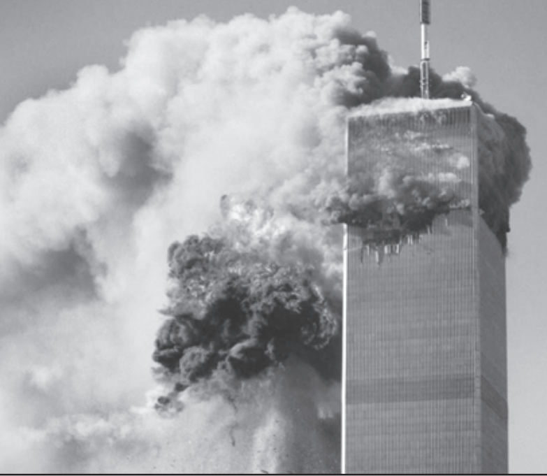
11 ਸਤੰਬਰ 2001 ਨੂੰ ਜਨੂਨੀ ਹਮਲੇ ਦਾ ਸ਼ਿਕਾਰ ਹੋਏ ਨਿਊ ਯਾਰਕ ਦੇ ਟਵਿਨ ਟਾਵਰ

ਰਾਜ ਦੇ ਨਸ਼ੇ ਵਿਚ ਫੁੰਕਾਰਦਾ ਹਿੰਦੂ ਖਾੜਕੂਵਾਦ: ਭਾਰਤ ਭਾਵੇਂ ਬਹੁ-ਕੌਮੀ, ਬਹੁ-ਧਰਮੀ, ਬਹੁ-ਸਭਿਅਕ ਅਤੇ ਬਹੁਤ ਸਾਰੀਆਂ ਬੋਲੀਆਂ ਵਾਲਾ ਦੇਸ਼ ਹੈ ਪਰ ਹਾਲਾਤ ਨੇ ਕੁਝ ਇਸ ਤਰ੍ਹਾਂ ਪਾਸਾ ਲਿਆ ਹੈ ਕਿ ਹੁਣ ਇਹ ਦੇਸ਼ ਕੇਵਲ ਹਿੰਦੂ ਬਹੁਗਿਣਤੀ ਦਾ ਹੈ ਅਤੇ ਇਸ ਬਹੁਗਿਣਤੀ ਦੀ ਪ੍ਰਤੀਨਿਧਤਾ ਕਰਨ ਵਾਲਾ ਸੰਘ ਪਰਿਵਾਰ ਹਿੰਦੂ ਜਹਾਦ ਦਾ ਧਾਰਨੀ ਹੈ ਜਿਸ ਮੁਤਾਬਕ ਭਾਰਤ ਦੇ ਗੈਰ ਹਿੰਦੂ ਨੂੰ ਸੰਘ ਪਰਿਵਾਰ (ਭਾਜਪਾ) ਦੇ ਖਾੜਕੂ ਏਜੰਡੇ ਦਾ ਸ਼ਿਕਾਰ ਹੋਣਾ ਪਏਗਾ। ਇਤਿਹਾਸ ਵਿਚ ਜਿਨ੍ਹਾਂ ਹਿੰਦੂ ਲੋਕਾਂ ਦੇ ਮੂੰਹਾਂ ਵਿਚ ਮੁਗਲ ਹੁਕਮਰਾਨ ਬੁੱਕਦੇ ਸਨ, ਅੱਜ ਬਦਲਦੇ ਹਾਲਾਤ ਵਿਚ ਉਨ੍ਹਾਂ ਹਿੰਦੂਆਂ ਦੀ ਅੱਜ