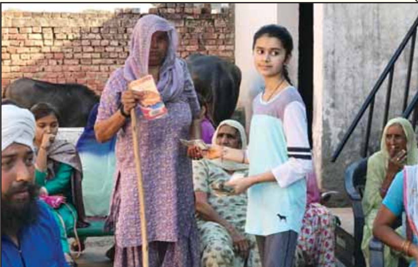
ਫਰੈਂਡਜ਼ ਆਫ ਪੰਜਾਬ ਦੇ ਇੱਕ ਐਨ. ਆਰ. ਆਈ. ਸਹਿਯੋਗੀ ਦੀ ਬੇਟੀ ਪੰਜਾਬ ਦੇ ਇੱਕ ਪਿੰਡ ਵਿਚ ਗਰੀਬ ਲੋਕਾਂ ਨੂੰ ਨਕਦ ਮਦਦ ਦਿੰਦੀ ਹੋਈ

ਫਰੈਂਡਜ਼ ਆਫ ਪੰਜਾਬ ਫਾਊਂਡੇਸ਼ਨ, ਪੰਜਾਬ ਦੇ ਪਿੰਡਾਂ ਵਿਚ ਲੋੜਵੰਦਾਂ ਦੀ ਮਦਦ ਲਈ ਵਿਸ਼ੇਸ਼ ਮੁਹਿੰਮ ਚਲਾ ਰਹੀ ਹੈ, ਜਿਸ ਤਹਿਤ ਪਿੰਡ ਦੇ ਲੋੜਵੰਦ ਪਰਿਵਾਰਾਂ ਦੇ ਵਿਦਿਆਰਥੀਆਂ, ਵਿਧਵਾਵਾਂ, ਔਲਾਦ ਵਿਹੁਣੇ ਬਜ਼ੁਰਗਾਂ ਅਤੇ ਅੰਗਹੀਣਾਂ ਨੂੰ ਮਹੀਨੇਵਾਰ ਮਦਦ ਦਿੱਤੀ ਜਾ ਰਹੀ ਹੈ। ਪੰਜਾਬ ਦੇ ਕਰੀਬ 40 ਪਿੰਡਾਂ ਵਿਚ ਇਹ ਮੁਹਿੰਮ ਚਲ ਰਹੀ ਹੈ ਅਤੇ ਹੋਰ ਪਿੰਡਾਂ ਲਈ ਯੋਜਨਾ ਘੜੀ ਜਾ ਰਹੀ ਹੈ। ਇਸ ਤੋਂ ਇਲਾਵਾ ਸਮੁੱਚੇ ਭਾਈਚਾਰੇ ਨੂੰ ਫਾਇਦਾ ਪਹੁੰਚਾਉਣ ਲਈ ਇੱਕ ਹੋਰ ਕਾਰਜ ਤਹਿਤ ਕੰਮ ਚਲ ਰਿਹਾ ਹੈ। ਇਸ ਪ੍ਰਾਜੈਕਟ ਤਹਿਤ ਕਾਰਜ ਇਸ ਪ੍ਰਕਾਰ ਹਨ: ਪਿੰਡ ਵਿਚ ਕੰਪਿਊਟਰ ਲੈਬ: ਪਿੰਡਾਂ ਦੇ ਨੌਜਵਾਨਾਂ ਨੂੰ ਰੁਜ਼ਗਾਰ ਦੇਣ ਲਈ ਉਚੇਚੀ ਸਿੱਖਿਆ ਦਿੱਤੀ ਜਾ ਰਹੀ ਹੈ ਤਾਂ ਕਿ ਉਹ ਆਪਣੇ ਪਰਿਵਾਰਾਂ ਨੂੰ ਗਰੀਬੀ ਦੀ ਜਕੜ ਤੋਂ ਮੁਕਤ ਕਰਵਾ ਸਕਣ। ਇੱਕ ਪਰਵਾਸੀ ਪਰਿਵਾਰ ਦੇ ਘਰ ਨੂੰ ਇੰਟਰਨੈੱਟ ਕਨੈਕਸ਼ਨ ਨਾਲ ਜੋੜਿਆ ਗਿਆ ਹੈ। ਕੁਝ ਹਫਤਿਆਂ ਵਿਚ