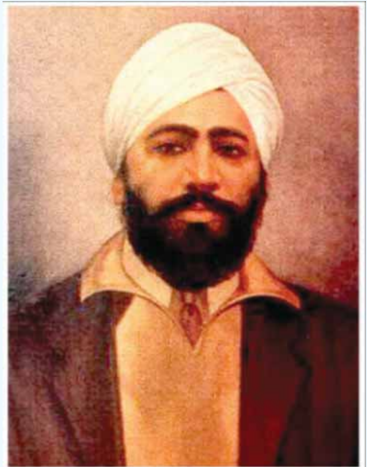
Shaheed Uddham Singh Alias Ram Mohammed Singh Azad

“When I am gone, in my place will come thousands to free my country.”