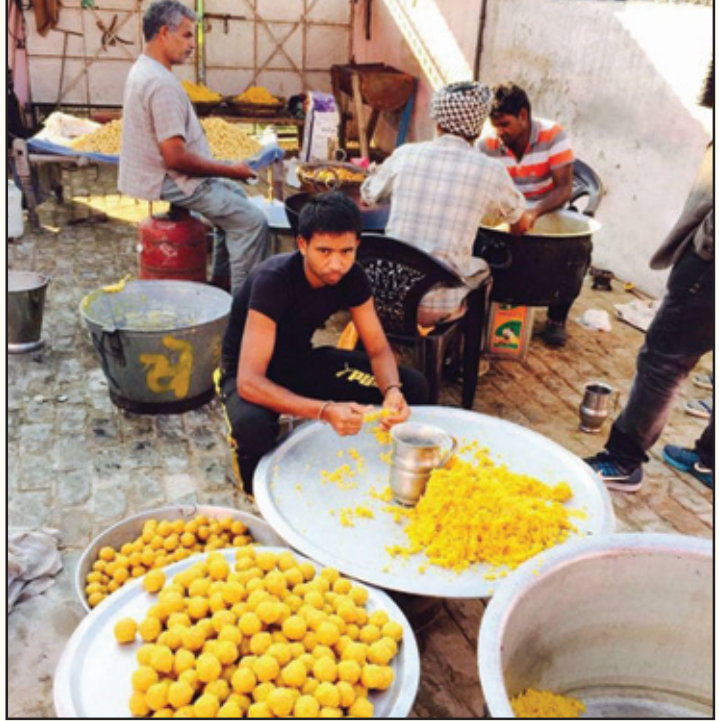
ਸ਼ਗਨਾਂ ਵਾਲਾ ਘਰ ਵਡਭਾਗਾ, ਬਣ ਰਹੇ ਨੇ ਪਕਵਾਨ। ਜਾਂ ਆਉਗੀ ਸੱਜ ਵਿਆਹੀ ਜਾਂ ਹੋਊ ਕੰਨਿਆ ਦਾਨ।