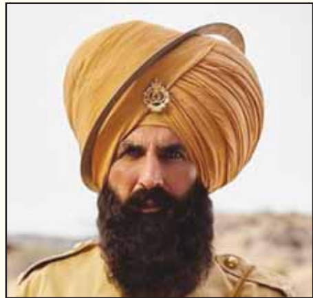
ਫਿਲਮ 'ਕੋਸਰੀ' ਵਿਚ ਅਕਸ਼ੈ ਕੁਮਾਰ

ਹੀਰੋ ਵਾਂਗ ਫਿਲਮ ਵਿਚਲਾ ਕਿਰਦਾਰ ਨਿਭਾਉਂਦਾ ਹੈ। ਇੰਜ ਲੱਗਦਾ ਹੈ ਕਿ ਈਸ਼ਰ ਸਿੰਘ ਅਕਸ਼ੈ ਕੁਮਾਰ ਦੀ ਭੂਮਿਕਾ ਨਿਭਾ ਰਿਹਾ ਹੈ ਨਾ ਕਿ ਅਕਸ਼ੈ ਕੁਮਾਰ। ਫਿਲਮ ਸਾਰਾਗੜ੍ਹੀ ਦੀ ਲੜਾਈ ਦਿਖਾਉਂਦੀ ਹੈ ਜੋ 36 ਸਿੱਖ ਰੈਜੀਮੈਂਟ ਦੇ ਸਿਪਾਹੀਆਂ ਤੇ ਅਫਗਾਨਾਂ ਵਿਚ ਹੋਈ ਸੀ। ਇਹ ਸਿਪਾਹੀ ਬਹਾਦਰੀ ਨਾਲ ਲੜੇ ਅਤੇ ਉਸ ਲੜਾਈ ਵਿਚ ਸ਼ਹੀਦ ਹੋ ਗਏ ਪਰ ਇਸ ਫਿਲਮ ਵਿਚ ਇਹ ਲੜਾਈ ਅਕਸ਼ੈ ਕੁਮਾਰ (ਹੌਲਦਾਰ ਈਸ਼ਰ ਸਿੰਘ) ਅਤੇ ਅਫਗਾਨਾਂ ਵਿਚ ਹੀ ਹੋਈ ਦਿਖਾਈ ਜਾਂਦੀ ਹੈ ਜਿਸ ਨੂੰ ਅੰਗਰੇਜ਼ੀ ਵਿਚ 'ਵਨ ਮੈਨ ਸ਼ੋਅ' ਕਿਹਾ ਜਾਂਦਾ ਹੈ। ਜੇ ਇਹ ਲੜਾਈ ਨਿਰਦੇਸ਼ਕ ਨੇ 'ਕੋਸਰੀ' ਪੱਗ ਵਾਲੇ ਸਿਪਾਹੀਆਂ ਨਾਲ ਅਫਗਾਨਾਂ ਦੀ ਕੀਤੀ ਹੁੰਦੀ ਤਾਂ ਇਹ ਲੜਾਈ ਨਿੱਜੀ ਨਾ ਰਹਿ ਕੇ ਸਮੂਹਿਕ ਬਣਦੀ। ਦੂਜੀ ਅਹਿਮ ਗੱਲ ਇਸ ਫਿਲਮ ਦੇ ਸਿਰਲੇਖ ਦੀ ਹੈ। ਫਿਲਮ ਦਾ ਨਾਂ 'ਕੋਸਰੀ' ਹੈ, ਜੋ ਫਿਲਮ ਵਿਚ ਦਿਖਾਈ ਵੀ ਦੇ ਰਿਹਾ ਹੈ, ਭਾਵ 'ਕੋਸਰੀ ਰੰਗ'। ਰੰਗ ਸਭਿਆਚਾਰਕ ਬਿੰਬ ਦੇ ਤੌਰ 'ਤੇ ਵਰਤੋਂ ਜਾਂਦੇ ਹਨ ਜਿਸ ਨਾਲ ਬੰਦੇ ਦੀ ਸਮਾਜਕ ਸਭਿਆਚਾਰਕ ਪਛਾਣ ਬਣਦੀ ਹੈ। ਪੰਜਾਬ ਵਿਚ 'ਬਸੰਤੀ' ਰੰਗ ਦੀ ਜ਼ਿਆਦਾ ਅਹਿਮੀਅਤ ਹੈ। ਬਸੰਤੀ ਰੰਗ ਨੂੰ ਕਿਸੇ ਵੀ ਧਰਾਤਲ 'ਤੇ ਵਾਚ ਲਈਏ ਜਿਵੇਂ ਭੂਗੋਲਿਕ ਤੇ ਸਭਿਆਚਾਰ 'ਤੇ ਤਾਂ ਬਸੰਤੀ ਰੰਗ ਹੀ ਉਘੜ ਕੇ ਸਾਹਮਣੇ ਆਉਂਦਾ ਹੈ। ਇਹ ਰੰਗ ਖੇੜੇ, ਆਜ਼ਾਦੀ ਤੇ ਵਿਕਾਸ ਦਾ ਰੰਗ ਹੈ, ਕਿਉਂਕਿ ਰੰਗਾਂ ਦਾ ਆਧਾਰ ਉਥੋਂ ਦੀ ਮਿੱਟੀ ਨਾਲ ਸਬੰਧਤ ਹੁੰਦਾ ਹੈ। ਇਸ ਖਿੱਤੇ ਵਿਚ ਬਸੰਤ ਰੁੱਤ ਦਾ ਆਗਮਨ ਦੇਸੀ ਮਹੀਨੇ ਚੇਤ ਤੋਂ ਹੁੰਦਾ ਹੈ। ਜਦੋਂ ਪੱਤਝੜ ਦੀ ਰੁੱਤ ਖਤਮ ਹੁੰਦੀ ਹੈ ਤਾਂ ਖੇੜਾਂ ਵਿਚ ਸਰੋਂ ਦੇ ਫੁੱਲ ਲਹਿਰਾਉਂਦੇ ਹਨ। ਗੀਤ 'ਤੇਰੀ ਮਿੱਟੀ' ਨੂੰ 'ਤੇ ਪਿਆਨ ਦਿੱਤਾ ਜਾਵੇ ਤਾਂ ਇਸ ਰੰਗ ਦੇ ਅਰਥ ਹੋਰ ਵੀ ਸਪਸ਼ਟ ਹੁੰਦੇ ਨਜ਼ਰ ਆਉਂਦੇ ਹਨ।