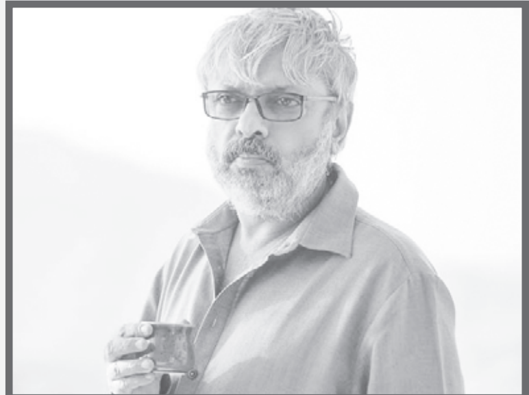
ਫਿਲਮਸਾਜ਼ ਸੰਜੇ ਲੀਲਾ ਭੰਸਾਲੀ

ਕਰਨੀ ਸੈਨਾ ਵੱਲੋਂ ਕੀਤੀ ਜਾ ਰਹੀ ਭੰਨਤੋੜ ਦੀ ਨਿੰਦਾ ਕੀਤੀ ਹੈ ਅਤੇ ਕਿਹਾ ਹੈ ਕਿ ਜੇ ਫਿਲਮਸਾਜ਼ ਕਿਸੇ ਨੂੰ ਪੁੱਛ ਪੁੱਛ ਕੇ ਫਿਲਮ ਬਣਾਏਗਾ ਤਾਂ ਉਸ ਵਿਚ ਬਚੇਗਾ ਕੀ? ਇਸ ਲਈ ਫਿਲਮਸਾਜ਼ ਨੂੰ ਆਪਣੀ ਗੱਲ ਆਪਣੇ ਢੰਗ ਨਾਲ ਰੱਖਣ ਦਾ ਮੌਕਾ ਮਿਲਣਾ ਹੀ ਚਾਹੀਦਾ ਹੈ।