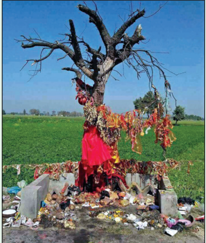
ਅੱਖਾਂ ਮੀਟੀਆਂ ਗਿਆਨ ਦੇ ਚਾਨਣੇ ਤੋਂ, ਅੰਧ-ਵਿਸ਼ਵਾਸ ਨੇ ਸੰਗਤਾਂ ਕੀਲੀਆਂ ਜੀ। ਪੂਜੇ ਜਾਣ ਦਰਖਤ ਖੜ-ਸੁੱਕ ਜਿੱਥੇ, ਉਥੇ ਆਉਣੀਆਂ ਕਿੱਥੇ ਤਬਦੀਲੀਆਂ ਜੀ।