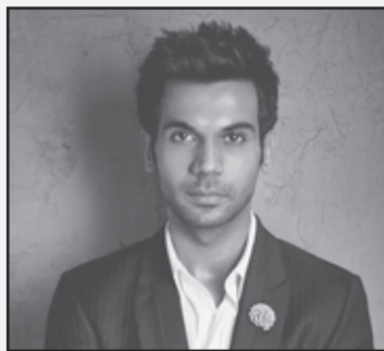
ਰਾਜ ਕੁਮਾਰ ਰਾਓ

ਅਦਾਕਾਰ ਰਾਜ ਕੁਮਾਰ ਰਾਓ ਅਤੇ ਫਿਲਮਸਾਜ਼ ਵਿਕਰਮਾਦਿਤਿਆ ਮੋਤਵਾਨੀ ਦੀ ਜੁਗਲਬੰਦੀ ਫਿਲਮ 'ਟਰੈਪਡ' ਵਿਚ ਦਰਸ਼ਕਾਂ ਦੇ ਸਿਰ ਚੜ੍ਹ ਬੋਲਦੀ ਹੈ। ਇਹ ਫਿਲਮ ਸਿਰਫ ਇਕ ਕਲਾਕਾਰ (ਰਾਜ ਕੁਮਾਰ ਰਾਓ) ਦੁਆਰਾ