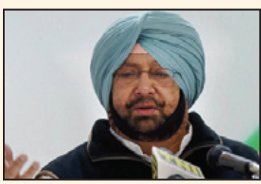
ਨੋਟੀਫਿਕੇਸ਼ਨ ਉਡੀਕੇ ਬਿਨਾ ਹੀ ਮੁੱਖ ਮੰਤਰੀ ਅਤੇ ਕੈਬਨਿਟ ਮੰਤਰੀਆਂ ਦੇ ਵਾਹਨਾਂ ਤੋਂ ਲਾਲ ਬੱਤੀਆਂ

ਚੰਡੀਗੜ੍ਹ: ਕੈਪਟਨ ਅਮਰਿੰਦਰ ਸਿੰਘ ਦੀ ਸਰਕਾਰ ਇਸ ਵਾਰ ਬਦਲੇ ਹੋਏ ਰੂਪ ਵਿਚ ਨਜ਼ਰ ਆ ਰਹੀ ਹੈ। ਪਹਿਲੀ ਵਾਰ ਹੈ ਕਿ ਨੋਟੀਫਿਕੇਸ਼ਨ ਜਾਰੀ ਹੋਣ ਤੋਂ ਪਹਿਲਾਂ ਹੀ ਕੈਬਨਿਟ ਦੇ ਫੈਸਲੇ ਲਾਗੂ ਹੋ ਰਹੇ ਹਨ। ਸਰਕਾਰ ਦੀ ਇਹ ਫੁਰਤੀ ਤੋਂ ਲੋਕ ਹੈਰਾਨ ਹਨ ਅਤੇ ਨਾਲ ਹੀ ਖੁਸ਼ ਵੀ। ਕੈਬਨਿਟ ਦੀ ਪਲੇਠੀ ਮੀਟਿੰਗ ਵਿਚ ਵੀ ਆਈ.ਪੀ. ਕਲਚਰ ਖਤਮ ਕਰਨ ਦਾ ਫੈਸਲਾ ਕੀਤਾ ਗਿਆ ਸੀ। ਇਸ ਬਾਰੇ ਅਜੇ ਨੋਟੀਫਿਕੇਸ਼ਨ ਜਾਰੀ ਹੋਣਾ ਹੈ, ਪਰ ਰਸਮੀ