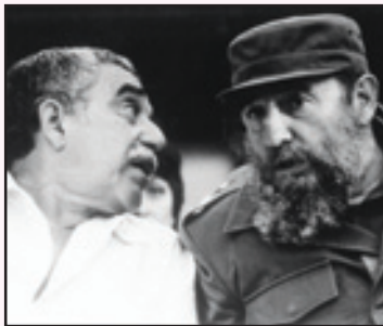
ਕਿਊਬਾ ਦੇ ਲੀਡਰ ਫੀਦਲ ਕਾਸਤਰੋ ਨਾਲ ਫੁਰਸਤ ਦੇ ਕੁਝ ਪਲ।

ਜਨਮ 6 ਮਾਰਚ 1927 ਨੂੰ ਹੋਇਆ ਸੀ ਅਤੇ 1982 ਨੂੰ ਉਸ ਨੂੰ ਸਾਹਿਤ ਦੇ ਨੋਬੇਲ ਪੁਰਸਕਾਰ ਨਾਲ ਸਨਮਾਨਤ ਕੀਤਾ ਗਿਆ। ਉਸ ਦੇ ਨਾਵਲ 'ਵੰਨ ਹੰਡਰਡ ਯੀਅਰਜ਼ ਆਫ ਸੋਲੀਟਿਊਡ' ਨੇ ਸੰਸਾਰ ਭਰ ਵਿਚ ਧੁੰਮਾਂ ਪਾ ਦਿੱਤੀਆਂ ਸਨ। ਮਾਰਕੁਏਜ਼ ਨੇ ਇਸ ਤੋਂ ਇਲਾਵਾ ਇਨ ਈਵਲ ਆਰ, ਐਂਟਮ ਆਫ ਦਿ ਪੈਟਰੀਆਰਕ, ਲਵ ਇਨ ਦਿ ਟਾਈਮ ਆਫ ਕੋਲਰਾ, ਜਨਰਲ ਇਨ ਹਿਜ਼ ਲੈਵੀਰਿਥ, ਆਫ ਲਵ ਐਂਡ ਅਦਰ ਡੈਮਨਜ਼, ਲੀਫ ਸਟੋਰਮ, ਨੌ ਵਨ ਰਾਈਟਜ਼ ਟੂ ਦਿ ਕਰਨਲ, ਮੈਮਰੀਜ਼ ਆਫ ਮਾਈ ਮੈਲੇਨਕਲੀ ਫੁੱਰਜ਼ ਆਦਿ ਨਾਵਲ ਲਿਖੇ। ਉਹਨੇ ਕਹਾਣੀਆਂ ਅਤੇ ਨਸਰ