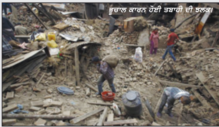
ਭੂਚਾਲ ਕਾਰਨ ਹੋਈ ਤਬਾਹੀ ਦੀ ਝਲਕ।

ਕਾਠਮੰਡੂ: ਭੂਚਾਲ ਦੀ ਮਾਰ ਕਾਰਨ ਬੁਰੀ ਤਰ੍ਹਾਂ ਝੰਬੇ ਨੇਪਾਲ ਦੇ ਪ੍ਰਧਾਨ ਮੰਤਰੀ ਦਾ ਅਜੇ ਹੁਣੇ ਜਿਹੇ ਹੀ ਬਿਆਨ ਆਇਆ ਹੈ ਕਿ ਮੁਲਕ ਨੂੰ ਭੂਚਾਲ ਦੀ ਮਾਰ ਤੋਂ ਉਠ ਖਲੋਣ ਲਈ ਘੱਟੋ-ਘੱਟ ਦੋ ਸਾਲ ਲੱਗ ਜਾਣੇ ਸਨ। ਯਾਦ ਰਹੇ ਕਿ 25 ਅਪਰੈਲ ਤੋਂ ਲੈ ਕੇ ਹੁਣ ਤੱਕ ਨੇਪਾਲ ਵਿਚ ਭੂਚਾਲ ਦੇ 70 ਤੋਂ ਵੱਧ ਛੋਟੇ-ਵੱਡੇ ਝਟਕੇ ਲੱਗ ਚੁੱਕੇ ਹਨ। 25 ਅਪਰੈਲ ਨੂੰ ਮੁਲਕ ਵਿਚ 7.9 ਸਿੱਦਤ ਵਾਲਾ ਭੂਚਾਲ ਆਇਆ ਸੀ ਅਤੇ ਇਸ ਵਿਚ 8 ਹਜ਼ਾਰ ਤੋਂ ਵੱਧ ਲੋਕ ਮਾਰੇ ਜਾ ਚੁੱਕੇ ਹਨ। ਜਿਹੜਾ ਮਾਲੀ ਨੁਕਸਾਨ ਹੋਇਆ ਹੈ, ਉਸ ਦਾ ਫਿਲਹਾਲ ਕੋਈ ਹਿਸਾਬ ਹੀ ਨਹੀਂ ਹੈ। ਲੱਖਾਂ ਲੋਕ ਘਰੋਂ ਬੇਘਰ ਹੋ ਗਏ ਹਨ। ਲਗਾਤਾਰ ਲੱਗ ਰਹੇ ਭੂਚਾਲ ਦੇ ਝਟਕਿਆਂ ਕਾਰਨ ਲੋਕ ਬਹੁਤ