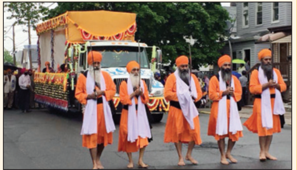
ਗੁਰਦੁਆਰਾ ਕਾਰਟਰੇਟ, ਨਿਊ ਜਰਸੀ ਵਿਚ ਲੰਘੇ ਸਨਿਚਰਵਾਰ ਨੂੰ ਗੁਰਦੁਆਰਾ ਸਿੰਘ ਸਭਾ ਅਤੇ ਗੁਰਦੁਆਰਾ ਦਸ਼ਮੇਸ਼ ਦਰਬਾਰ ਦੀਆਂ ਸੰਗਤਾਂ ਵੱਲੋਂ ਸਜਾਏ ਗਏ ਨਗਰ ਕੀਰਤਨ ਦੌਰਾਨ ਗੁਰੂ ਮਹਾਰਾਜ ਦੀ ਸਵਾਰੀ ਅਤੇ ਹੇਠਾਂ ਬੰਦੋਵਾਲ ਬੀਬੀਆਂ ਦਾ ਜਥਾ ਢਾਡੀ ਵਾਰਾਂ ਪੇਸ਼ ਕਰਦਾ ਹੋਇਆ।