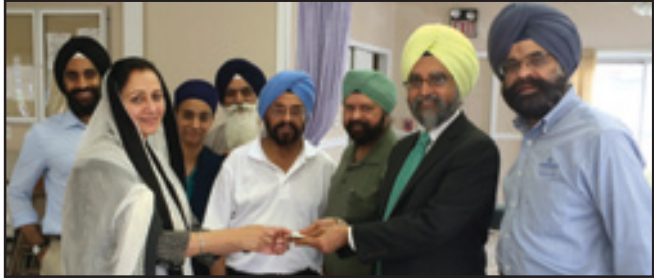
ਗੁਰਦੁਆਰਾ ਫ੍ਰੀਟਨ (ਸ਼ਿਕਾਗੋ) ਦੀ ਪ੍ਰਬੰਧਕ ਕਮੇਟੀ ਦੇ ਮੈਂਬਰ ਸਿੱਖ ਨੈਸ਼ਨਲ ਕੰਪੇਨ ਦੇ ਨੁਮਾਇੰਦਿਆਂ ਨੂੰ ਚੈਕ ਭੇਟ ਕਰਦੇ ਹੋਏ

ਅੰਮ੍ਰਿਤਸਰ: ਅਮਰੀਕਾ ਵਿਚ ਸਿੱਖ ਪਛਾਣ ਦੀ ਸਮੱਸਿਆ ਨੂੰ ਹੱਲ ਕਰਨ ਲਈ ਇਕਜੁੱਟ ਹੋਈਆਂ ਸਿੱਖ ਜਥੇਬੰਦੀਆਂ ਵੱਲੋਂ ਸਥਾਪਤ ਜਥੇਬੰਦੀ ਨੈਸ਼ਨਲ ਸਿੱਖ ਕੰਪੇਨ ਨੇ ਇਸ ਮਸਲੇ ਦੇ ਹੱਲ ਕਰਨ ਲਈ ਯਤਨ ਸ਼ੁਰੂ ਕਰ ਦਿੱਤੇ ਹਨ, ਜਿਸ ਤਹਿਤ ਦੇਸ਼ ਦੇ ਵੱਖ-ਵੱਖ ਹਿੱਸਿਆਂ ਵਿਚ ਰਹਿੰਦੇ ਸਿੱਖ ਭਾਈਚਾਰੇ ਕੋਲੋਂ ਮਾਇਕ ਮਦਦ ਇਕੱਠੀ ਕੀਤੀ ਜਾ ਰਹੀ