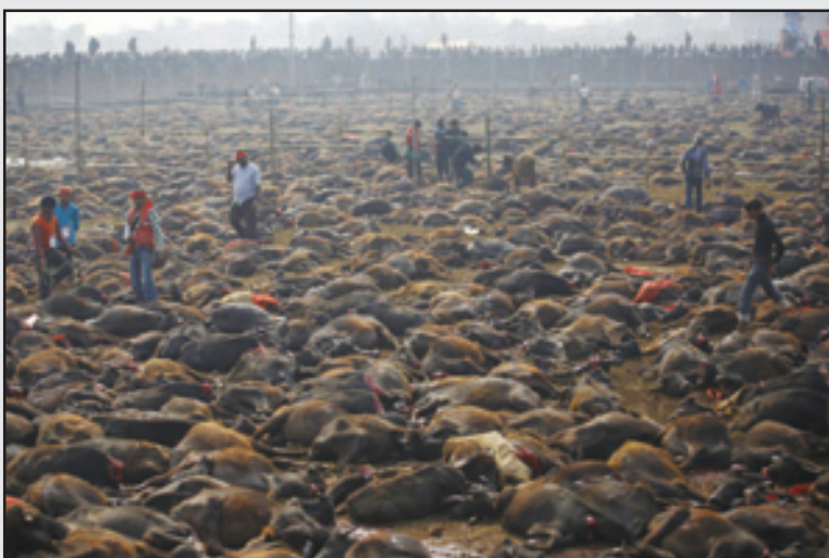
ਪਸ਼ੂਆਂ ਦੀ ਸਮੂਹਿਕ ਬਲੀ ਦੀ ਇਕ ਮਾਰਮਿਕ ਝਲਕ ਅਤੇ (ਸੱਜੇ) ਬਲੀ ਲਈ ਇਕ ਕਟੜੂ ਉਤੇ ਦਾਤਰ ਉਲਾਰ ਰਿਹਾ ਇਕ ਬੰਦਾ।

ਕਾਠਮੰਡੂ: ਨੇਪਾਲ ਦੀ ਰਾਜਧਾਨੀ ਕਾਠਮੰਡੂ ਤੋਂ ਤਕਰੀਬਨ 100 ਮੀਲ ਦੂਰ ਬਰਿਆਰਪੁਰ (ਜ਼ਿਲ੍ਹਾ ਬਾਰਾ) ਦੇ ਗੱਦੀ ਮਾਈ ਮੰਦਰ ਵਿਚ ਹਰ 5 ਸਾਲ ਬਾਅਦ ਮੇਲਾ ਭਰਦਾ ਹੈ ਜਿਸ ਵਿਚ ਪਸ਼ੂਆਂ ਦੀ ਸਮੂਹਿਕ ਬਲੀ ਦਿੱਤੀ ਜਾਂਦੀ ਹੈ। ਬਰਿਆਰਪੁਰ ਭਾਰਤ-ਨੇਪਾਲ ਸਰਹੱਦ ਦੇ ਐਨ ਨੇੜੇ ਪੈਂਦਾ ਹੈ। ਗੱਦੀ ਮਾਈ ਨੂੰ ਸ਼ਕਤੀ ਦੀ ਦੇਵੀ ਮੰਨਿਆ ਜਾਂਦਾ ਹੈ ਅਤੇ ਉਸ ਨੂੰ ਖੁਸ਼ ਕਰਨ ਲਈ ਇਹ ਬਲੀ ਦਿੱਤੀ ਜਾਂਦੀ ਹੈ। ਇਸ ਮੇਲੇ ਵਿਚ ਮੁੱਖ ਤੌਰ 'ਤੇ ਤਾਂ ਭਾਵੇਂ ਨੇਪਾਲ ਦੇ ਮਧੇਸ਼ੀ ਲੋਕ ਹਿੰਸਾ ਲੈਂਦੇ ਹਨ, ਪਰ ਇਸ ਵਿਚ ਬਿਹਾਰ ਅਤੇ ਉਤਰ ਪ੍ਰਦੇਸ਼ ਤੋਂ ਲੋਕ ਵੀ ਪੁੱਜਦੇ ਹਨ। ਅੰਦਾਜ਼ਾ ਹੈ ਕਿ ਮੇਲੇ ਵਿਚ 2 ਲੱਖ ਸ਼ਰਧਾਲੂ ਆਉਂਦੇ ਹਨ। ਇਕ ਰਿਕਾਰਡ ਮੁਤਾਬਕ ਪਿਛਲੇ ਸਾਲ ਨਵੰਬਰ ਵਿਚ ਇਸ ਮੇਲੇ ਵਿਚ ਤਕਰੀਬਨ 5 ਲੱਖ ਪਸ਼ੂਆਂ ਦੀ ਬਲੀ ਚੜ੍ਹਾ ਦਿੱਤੀ ਗਈ। ਕਹਿੰਦੇ ਹਨ ਕਿ 2009 ਵਾਲੇ ਮੇਲੇ ਵਿਚ ਖਦਸ਼ਾ ਸੀ ਕਿ ਬਲੀ ਲਈ ਘੱਟ ਪਸ਼ੂ ਆ ਰਹੇ ਹਨ, ਇਸ ਲਈ ਰੇਡੀਓ ਉਤੇ ਕਿਸਾਨਾਂ ਨੂੰ ਵਾਰ-ਵਾਰ ਅਪੀਲ ਕੀਤੀ ਗਈ ਕਿ ਉਹ ਵੱਧ ਤੋਂ ਵੱਧ ਪਸ਼ੂ ਲੈ ਕੇ ਮੇਲੇ ਵਿਚ ਆਉਣ।