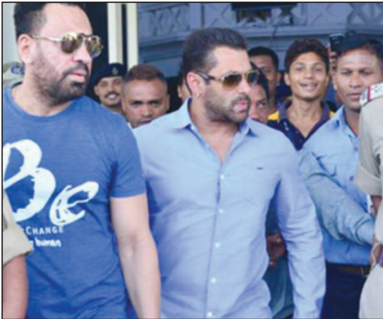
ਅੱਠ ਮਈ ਨੂੰ ਅਦਾਲਤ ਅੰਦਰ ਜਾ ਰਿਹਾ ਅਦਾਕਾਰ ਸਲਮਾਨ ਖਾਨ।

ਮੁੰਬਈ: ਇਸ ਹਫਤੇ ਸਮੁੱਚੇ ਭਾਰਤੀ ਮੀਡੀਆ ਵਿਚ ਸਲਮਾਨ ਖਾਨ ਕੇਸ ਦੀ ਖੁਬ ਚਰਚਾ ਰਹੀ। ਇਸ ਕੇਸ ਦੇ ਸਿਲਸਿਲੇ ਵਿਚ ਸਲਮਾਨ ਖਾਨ ਨੂੰ ਬਹੁਤ ਜ਼ਿਆਦਾ ਕਵਰੇਜ ਦੇਣ ਕਰ ਕੇ ਭਾਵੇਂ ਮੀਡੀਆ ਦੇ ਇਕ ਹਿੱਸੇ ਦੀ ਬੜੀ ਤਿੱਖੀ ਆਲੋਚਨਾ ਵੀ ਹੋਈ ਹੈ, ਪਰ ਮੀਡੀਆ ਦੇ ਇਕ ਹਿੱਸੇ ਨੇ ਇਸ ਕੇਸ ਨਾਲ ਜੁੜੇ ਕਈ ਅਹਿਮ ਪੱਖ ਉਭਾਰਨ ਦਾ ਯਤਨ ਵੀ ਕੀਤਾ ਹੈ। ਇਸ ਯਤਨ ਕਰ ਕੇ ਹੀ ਇਸ ਕੇਸ ਦੀ ਤਹਿ ਵਿਚ ਪਏ ਕੁਝ ਤੱਥ ਅਤੇ ਪੱਖ ਉਭਰ ਕੇ ਸਭ ਦੇ ਸਾਹਮਣੇ ਆ ਸਕੇ ਹਨ। ਇਹ ਕੇਸ ਪੂਰੇ 13 ਸਾਲ ਚੱਲਿਆ ਅਤੇ ਸਲਮਾਨ ਖਾਨ ਨੂੰ ਪੰਜ ਸਾਲ ਕੈਦ ਦੀ ਸਜ਼ਾ ਹੋਈ।