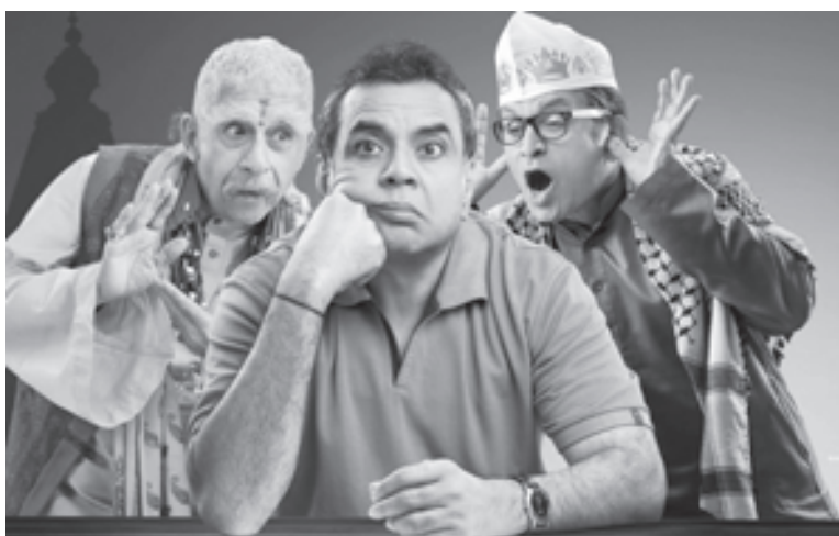
ਫਿਲਮ 'ਧਰਮ ਸੰਕਟ ਮੇਂ' ਵਿਚ ਨਸੀਰੁਦੀਨ ਸ਼ਾਹ, ਪਰੇਸ਼ ਰਾਵਲ ਤੇ ਅਨੂ ਕਪੂਰ।