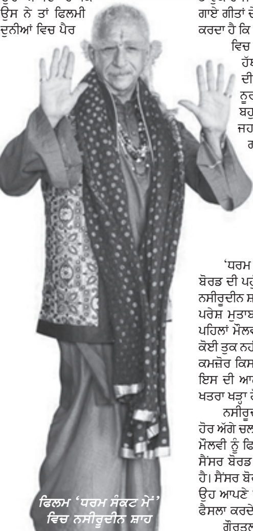
ਫਿਲਮ 'ਧਰਮ ਸੰਕਟ ਮੇਂ' ਵਿਚ ਨਸੀਰੁਦੀਨ ਸ਼ਾਹ