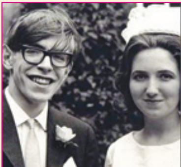
ਜੇਨ ਅਤੇ ਸਟੀਫਨ ਹਾਕਿੰਗ ਦੀ ਵਿਆਹ ਵੇਲੇ ਦੀ ਤਸਵੀਰ।

ਸਟੀਫਨ ਦੇ ਮਸਨੂਈ ਜਾਣਕਾਰੀ ਬਾਰੇ ਬਿਆਨ ਤੋਂ ਬਾਅਦ ਇਸ ਸਵਾਲ ਉਤੇ ਸੰਸਾਰ ਭਰ ਵਿਚ ਨਵੀਂ ਬਹਿਸ ਛਿੜ ਗਈ ਹੈ। ਅਸਲ ਵਿਚ ਇਹੀ ਹੈ ਸਟੀਫਨ ਹਾਕਿੰਗ ਦਾ ਖਾਸਾ ਜੋ ਕੁਰਸੀ ਉਤੇ ਪਿਆ-ਪਿਆ ਵੀ ਉਹ ਸੋਚ ਦਾ ਦੀਵਾ ਬਲਦਾ ਰੱਖ ਰਿਹਾ ਹੈ। ਸਟੀਫਨ ਦੀ ਇਸ ਹਿੰਮਤ ਤੇ ਹੌਸਲੇ ਨੂੰ ਸੰਸਾਰ ਭਰ ਤੋਂ ਸਲਾਮਾਂ ਮਿਲ ਰਹੀਆਂ ਹਨ।