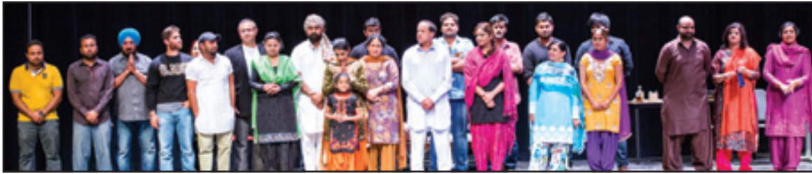
ਨਾਟਕ ‘ਉਮਰਾਂ ਲੰਘੀਆਂ ਪੱਬਾਂ ਭਾਰ’ ਦੀ ਸਮੁੱਚੀ ਟੀਮ