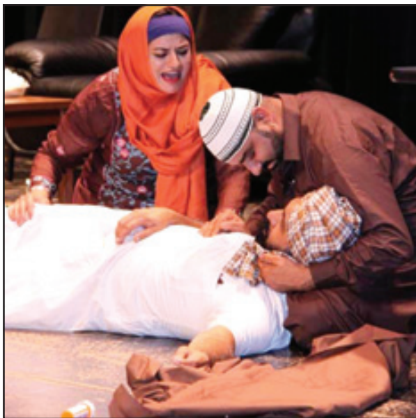
ਨਾਟਕ ਦਾ ਇਕ ਭਾਵਪੂਰਤ ਤੇ ਜਜ਼ਬਾਤੀ ਦ੍ਰਿਸ਼