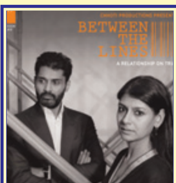
ਨਾਟਕ 'ਬੈਟਵੀਨ ਦਿ ਲਾਈਨਜ਼' ਭਾਰਤ ਦੀ ਇਕ ਸ਼ਹਿਰੀ ਜੋੜੀ ਦਾ ਚਿਤਰਨ ਹੈ ਜੋ ਪੜ੍ਹੇ-ਲਿਖੇ ਹਨ ਅਤੇ ਆਪਣੇ ਆਲੇ-ਦੁਆਲੇ ਬਾਰੇ ਪੂਰੇ ਚੇਤਨ ਵੀ ਹਨ; ਪਰ ਜ਼ਿੰਦਗੀ ਦੇ ਇਕ ਮੌੜ ਉਤੇ ਆ ਉਹ ਆਧੁਨਿਕਤਾ ਅਤੇ ਰਿਵਾਇਤ ਦੇ ਪਾਟ ਰਹੇ ਰਸਤਿਆਂ ਉਤੇ ਪਹੁੰਚ ਜਾਂਦੇ ਹਨ। ਪਤੀ-ਪਤਨੀ ਦੇ ਆਪਸੀ ਤਕਰਾਰ ਨੂੰ ਨਾਟਕ ਵਿਚ ਬਹੁਤ ਸ਼ਿੱਦਤ ਨਾਲ ਪੇਸ਼ ਕੀਤਾ ਗਿਆ ਹੈ।