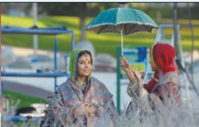
ਸ਼ੂਟਿੰਗ ਵਿਚ ਹਿੱਸਾ ਲੈ ਰਹੀ ਸ਼ਬਾਨਾ ਆਜ਼ਮੀ।