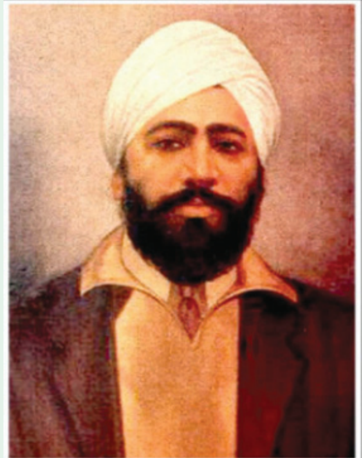
Shaheed Uddham Singh Alias Ram Mohammed Singh Azad

“When I am gone, in my place will come thousands to free my country.”