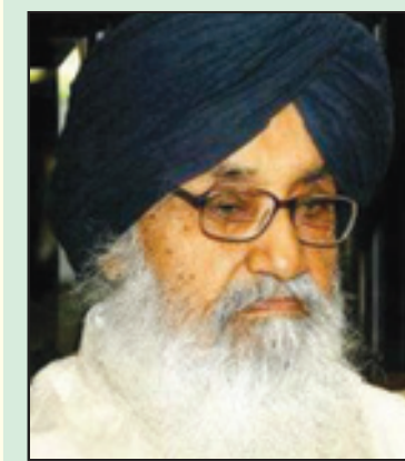
ਪ੍ਰਧਾਨ ਸਿਮਰਨਜੀਤ ਸਿੰਘ ਮਾਨ ਨੇ ਵੀ ਅੰਮ੍ਰਿਤਸਰ ਵਿਚ ਕੀਤੀ ਜਾਣ ਵਾਲੀ ਸਮਾਨੰਤਰ ਕਾਨਫਰੰਸ ਰੱਦ ਕਰ ਦਿੱਤੀ।

ਸ੍ਰੀ ਅਕਾਲ ਤਖਤ ਸਾਹਿਬ ਦੇ ਹੁਕਮਾਂ ਮਗਰੋਂ ਸ਼੍ਰੋਮਣੀ ਅਕਾਲੀ ਦਲ ਨੇ 27 ਜੁਲਾਈ ਨੂੰ ਅੰਮ੍ਰਿਤਸਰ ਵਿਚ ਹੋਣ ਵਾਲੀ ਪੱਥਕ ਕਾਨਫਰੰਸ ਅਤੇ ਹਰਿਆਣਾ ਦੇ ਸਿੱਖ ਆਗੂਆਂ ਨੇ 28 ਜੁਲਾਈ ਨੂੰ ਕਰਨਾਲ ਵਿਖੇ ਹੋਣ ਵਾਲੇ ਸਿੱਖ ਸੰਮੇਲਨ ਨੂੰ ਰੱਦ ਕਰ ਦਿੱਤਾ। ਉਧਰ ਸ਼੍ਰੋਮਣੀ ਅਕਾਲੀ ਦਲ (ਅੰਮ੍ਰਿਤਸਰ) ਦੇ