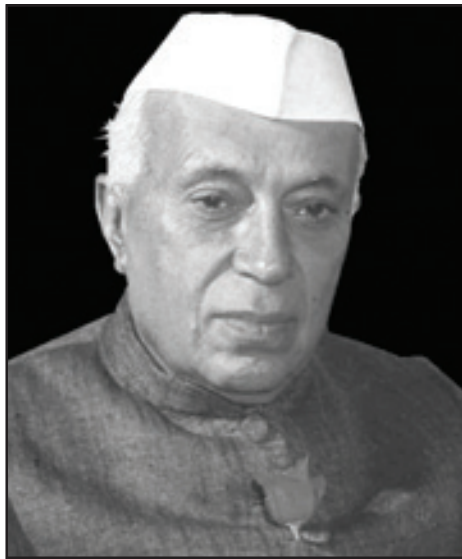
ਪੰਡਤ ਜਵਾਹਰ ਲਾਲ ਨਹਿਰੂ