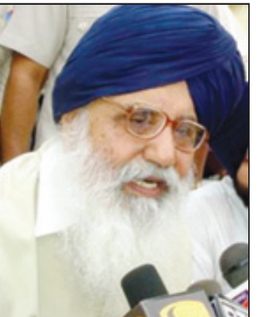
ਪੱਤਰਕਾਰਾਂ ਨਾਲ ਗੱਲਬਾਤ ਕਰ ਰਹੇ ਮੁੱਖ ਮੰਤਰੀ ਪ੍ਰਕਾਸ਼ ਸਿੰਘ ਬਾਦਲ

ਤਲਵੰਡੀ ਸਾਬੋ: ਮੁੱਖ ਮੰਤਰੀ ਪ੍ਰਕਾਸ਼ ਸਿੰਘ ਬਾਦਲ ਨੇ ਧਾਰਾ 370 ਦੇ ਮੁੱਦੇ 'ਤੇ ਸਰਵ ਪ੍ਰਧਾਨਤ ਹੱਲ ਦੀ ਵਕਾਲਤ ਕਰਦਿਆਂ ਕਿਹਾ ਕਿ ਅਜਿਹੇ ਮੁੱਦਿਆਂ 'ਤੇ ਕੋਈ ਵੀ ਫੈਸਲਾ ਲੈਣ ਤੋਂ ਪਹਿਲਾਂ ਕੇਂਦਰ ਸਰਕਾਰ ਨੂੰ ਦੇਸ਼ ਦੀਆਂ ਸਾਰੀਆਂ ਸਿਆਸੀਆਂ ਪਾਰਟੀਆਂ ਨੂੰ ਭਰੋਸੇ ਵਿਚ ਲੈਣਾ ਚਾਹੀਦਾ ਹੈ। ਸ. ਬਾਦਲ ਇਥੇ ਖਾਲਸਾ ਸੀਨੀਅਰ ਸੈਕੰਡਰੀ ਸਕੂਲ ਵਿਚ ਸੰਗਤ ਦਰਸ਼ਨ ਪ੍ਰੋਗਰਾਮ ਲਈ ਆਏ ਸਨ।