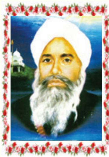
ਸੰਤ ਪ੍ਰੇਮ ਸਿੰਘ ਮੁਰਾਲੇਵਾਲੇ

13 ਜੂਨ 2014 ਅਰੰਭ ਸ੍ਰੀ ਅਖੰਡ ਪਾਠ ਸਾਹਿਬ 14 ਜੂਨ 2014 ਅੰਮ੍ਰਿਤ ਵੇਲੇ ਸੰਪੂਰਨ ਆਸਾ ਦੀ ਵਾਰ 15 ਜੂਨ 2014 ਭੋਗ ਸ੍ਰੀ ਅਖੰਡ ਪਾਠ ਸਾਹਿਬ ਉਪਰੰਤ ਖੁੱਲ੍ਹੇ ਦੀਵਾਨ ਸਜਣਗੇ