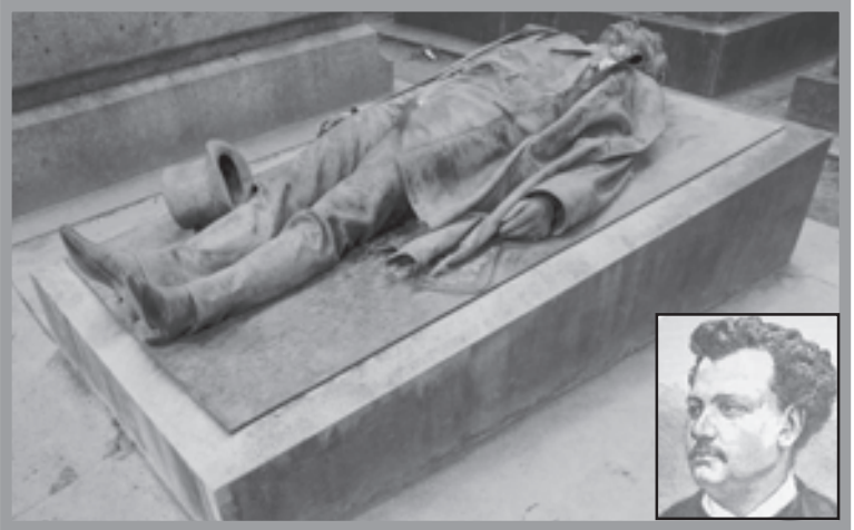
ਬਾਦਸ਼ਾਹ ਨੈਪੋਲੀਅਨ ਦੇ ਭਤੀਜੇ ਪੀਅਰੀ ਨੈਪੋਲੀਅਨ ਵੱਲੋਂ ਕਤਲ ਫਰਾਂਸੀਸੀ ਪੱਤਰਕਾਰ ਵਿਕਤੋਰ ਨੋਇਰ (ਇਨਸੈਟ) ਦੀ ਕਬਰ।

ਲਕੋਏ। ਪੁਲਿਸ ਨੇ ਜਿਹੜੀਆਂ ਗ੍ਰਿਫਤਾਰੀਆਂ ਕੀਤੀਆਂ, ਉਨ੍ਹਾਂ ਵਿਚੋਂ ਤਿੰਨ ਫੋਨੀ ਹਿੰਸਾ ਲਈ ਕਸੂਰਵਾਰ ਠਹਿਰਾਏ ਗਏ ਤੇ ਫਾਂਸੀ ਦੀ ਸਜ਼ਾ ਦਾ ਫੈਸਲਾ ਸੁਣਾਇਆ। 21 ਨਵੰਬਰ ਨੂੰ 25 ਹਜ਼ਾਰ ਹਮਦਰਦਾਂ ਨੇ ਮਹਾਰਾਣੀ ਨੂੰ ਦਰਖਾਸਤ ਦਿੱਤੀ ਕਿ ਖਿਮਾ ਕਰ ਦਿਓ। ਖਿਮਾ ਨਹੀਂ ਫਾਂਸੀ ਮਿਲੀ। ਫਾਂਸੀ ਵਾਲੇ ਦਿਨ ਗਲੀਆਂ ਵਿਚ ਸੁੰਨ ਵਰਤੀ ਹੋਈ ਸੀ ਪਰ ਆਇਰਿਸ਼ ਚਰਚਾ ਵਿਚ ਇੰਨੀ ਭੀੜ ਕਿ ਥਾਂ ਨਾ ਮਿਲੇ। ਆਪਣੇ ਸ਼ਹੀਦਾਂ ਵਾਸਤੇ