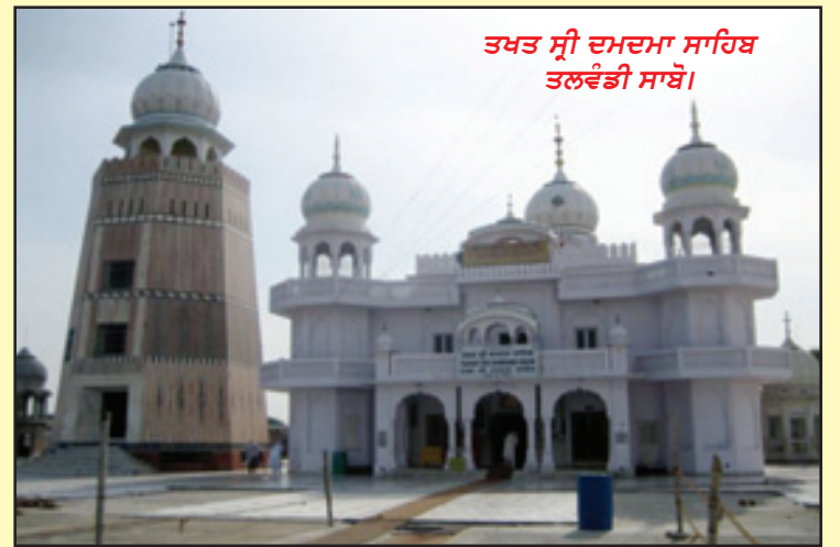
ਤਖਤ ਸ੍ਰੀ ਦਮਦਮਾ ਸਾਹਿਬ ਤਲਵੰਡੀ ਸਾਬੋ।

ਰਜਿਸਟਰੇਸ਼ਨ ਲਈ ਆਪਣਾ ਨਾਮ ਇਸ ਫੋਨ ਉਤੇ ਭੇਜੋ 972-693-1077 (ਰਵੀਦੀਪ ਕੇ. ਮੁਕਤਾ)