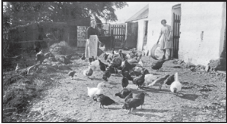
19ਵੀਂ ਸਦੀ ਦਾ ਆਇਰਿਸ਼ ਜਿਸ ਨੂੰ ਦੇਖ ਕੇ ਕਾਰਲ ਮਾਰਕਸ ਦੀ ਧੀ ਤੁਸੀ 'ਆਇਰਿਸ਼' ਹੀ ਹੋ ਗਈ ਸੀ।

ਚੋਣਾਂ ਆ ਗਈਆਂ। ਆਇਰਿਸ਼ ਦੇ ਲੋਕਾਂ ਨੇ ਆਪਣੇ ਨੇਤਾ ਓਡੋਨੋਵ ਰੌਸ ਨੂੰ ਰਿਕਾਰਡ ਤੋੜ ਵੋਟ ਪਾ ਕੇ ਜਿਤਾ ਲਿਆ। ਕਾਰਲ ਨੇ ਕਿਹਾ, ਹੁਣ ਕਾਮੇ ਜਿੱਤਣਗੇ, ਹਿੰਸਾ ਨਾਲ ਨਹੀਂ, ਵੋਟ ਨਾਲ।