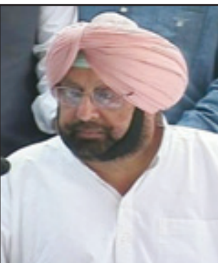
ਕੈਪਟਨ ਅਮਰਿੰਦਰ ਸਿੰਘ