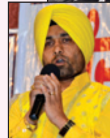
ਗਾਇਕ ਨਿੱਮਾ ਡੱਲੇਵਾਲਾ