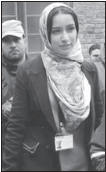
ਫਿਲਮ 'ਹੈਦਰ' ਵਿਚ ਸ਼ਰਧਾ ਕਪੂਰ

ਸੋਹਣੀ ਤੇ ਸੁਨੱਖੀ ਅਦਾਕਾਰਾ ਸ਼ਰਧਾ ਕਪੂਰ ਅੱਜ ਕੱਲ੍ਹ ਆਪਣੀ ਨਵੀਂ ਫਿਲਮ 'ਹੈਦਰ' ਦੀ ਸ਼ੂਟਿੰਗ ਵਿਚ ਰੁੱਝੀ ਹੋਈ ਹੈ। ਇਹ ਫਿਲਮ ਫਿਲਮਸਾਜ਼-ਸੰਗੀਤਕਾਰ ਵਿਸ਼ਾਲ ਭਾਰਦਵਾਜ਼ ਬਣਾ ਰਿਹਾ ਹੈ। 'ਹੈਦਰ' ਸੰਸਾਰ ਪ੍ਰਸਿੱਧ ਲੇਖਕ ਸੈਕਸਪੀਅਰ ਦੇ ਸੰਸਾਰ ਪ੍ਰਸਿੱਧ ਨਾਟਕ 'ਹੈਮਲਟ' ਉੱਤੇ ਆਧਾਰਤ ਹੈ। ਫਿਲਮ ਪੂਰਨ ਰੂਪ ਵਿਚ ਕਸ਼ਮੀਰੀ ਮਾਹੌਲ ਮੁਤਾਬਕ ਬਣਾਈ ਜਾ ਰਹੀ ਹੈ। ਇਸ ਫਿਲਮ ਵਿਚ ਸ਼ਰਧਾ ਕਪੂਰ ਕਸ਼ਮੀਰੀ ਮੁਟਿਆਰ ਦਾ ਕਿਰਦਾਰ ਨਿਭਾਅ ਰਹੀ ਹੈ। ਉਸ ਦਾ ਕਹਿਣਾ ਹੈ ਕਿ ਫਿਲਮ ਦੀ ਸ਼ੂਟਿੰਗ ਦੌਰਾਨ ਉਸ ਨੂੰ ਕਈ ਤਰ੍ਹਾਂ ਦੇ ਨਵੇਂ ਤਜਰਬੇ ਹਾਸਲ ਹੋਏ ਹਨ ਜਿਨ੍ਹਾਂ ਬਾਰੇ ਉਸ ਨੇ ਕਈ ਸੁਪਨੇ ਵਿਚ ਵੀ ਨਹੀਂ ਸੀ ਸੋਚਿਆ। ਪਿਛਲੇ ਦਿਨੀਂ ਜਦੋਂ ਕਸ਼ਮੀਰ ਵਿਚ ਇਸ ਫਿਲਮ ਦੀ ਸ਼ੂਟਿੰਗ ਚੱਲ ਰਹੀ ਸੀ ਤਾਂ ਉਥੇ ਆਏ ਕੁਝ ਕਸ਼ਮੀਰੀਆਂ ਨੇ ਫਿਲਮ ਦੇ ਅਮਲੇ ਉੱਤੇ ਬਰਫ ਦੇ ਗੋਲੇ ਮਾਰਨੇ ਸ਼ੁਰੂ ਕਰ ਦਿੱਤੇ। ਇਕ ਹੋਰ ਥਾਂ ਉੱਤੇ ਤਾਂ ਕਿਸੇ ਨੇ ਅਮਲੇ ਉੱਤੇ ਕਾਂਗੜੀ ਵੀ ਕੱਢ ਮਾਰੀ। ਇਨ੍ਹਾਂ ਲੋਕਾਂ ਦਾ ਗੁੱਸਾ ਇਹ ਸੀ ਕਿ ਫਿਲਮਾਂ ਵਾਲੇ ਕਸ਼ਮੀਰ ਬਾਰੇ ਫਿਲਮਾਂ ਤਾਂ ਬਣਾਉਂਦੇ ਹਨ, ਪਰ ਉਹ ਅੱਜ ਜਿਸ ਹਾਲਾਤ ਨਾਲ ਘੁਲ ਰਹੇ ਹਨ, ਉਹ ਬਾਰੇ ਰੱਤੀ ਭਰ ਵੀ ਫਿਲਮ ਵਿਚ ਦਿਖਾਇਆ ਜਾਂਦਾ। ਬੱਸ ਆਮ ਜਿਹੀ ਕਹਾਣੀ ਘੜ ਕੇ ਕਿਸੇ ਕਸ਼ਮੀਰੀ ਕੁੜੀ ਦਾ ਕਿਸੇ ਫੌਜੀ ਨਾਲ ਇਸ਼ਕ ਦਿਖਾ ਦਿੱਤਾ ਜਾਂਦਾ ਹੈ। ਕਸ਼ਮੀਰੀਆਂ ਦੀ ਇਸ ਘਟਨਾ ਦਾ ਸ਼ਰਧਾ ਉੱਤੇ ਬੜਾ ਅਸਰ ਹੋਇਆ। ਉਸ ਨੇ ਕਸ਼ਮੀਰ ਦੇ ਅੱਜ ਦੇ ਹਾਲਾਤ ਬਾਰੇ ਪੁੱਛਿਆ/ ਪੜ੍ਹਿਆ। ਇਸ ਹਾਲਾਤ ਬਾਰੇ ਪੜ੍ਹ/ਸੁਣ ਕੇ ਉਸ ਦੀਆਂ ਅੱਖਾਂ ਟੱਡੀਆਂ ਹੀ ਰਹਿ ਗਈਆਂ। ਇਸ ਫਿਲਮ ਦੇ ਇਕ ਹੋਰ ਅਦਾਕਾਰ ਇਰਫਾਨ ਖਾਨ ਨੇ ਵੀ ਇਹੀ ਕਿਹਾ ਕਿ ਹਾਲਾਤ ਤੋਂ ਅੱਕੇ ਕਸ਼ਮੀਰੀ ਨੌਜਵਾਨ ਨੇ ਉਨ੍ਹਾਂ ਉੱਤੇ ਕਾਂਗੜੀ ਸੁੱਟਣ ਦਾ ਯਤਨ ਕੀਤਾ ਸੀ। ਇਹ ਲੋਕ ਇਕ ਦਹਾਕੇ ਤੋਂ ਵੀ ਵੱਧ ਸਮੇਂ ਤੋਂ ਅੱਕੜਾਂ ਨਾਲ ਘੁਲ ਰਹੇ ਹਨ। ਹੁਣ ਜਦੋਂ ਉਨ੍ਹਾਂ ਨੇ ਦੇਖਿਆ ਕਿ ਅਸੀਂ ਲੋਕ ਕਿਸ ਤਰ੍ਹਾਂ