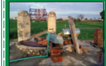
ਚੇਤੇ ਆ ਗਏ ਆਪਣੇ ਵੇਲੇ। ਖੂਹਾਂ 'ਤੇ ਲਗਦੇ ਸਨ ਮੇਲੇ। ਨਾ ਗੱਲਾਂ ਨਾ ਕੰਮ ਮੁੱਕਦੇ ਸਨ। ਦੇਖ ਸੁਹੱਪਣ ਰਾਹ ਰੁਕਦੇ ਸਨ। ਚਿੱਤ ਕਰਦਾ ਫਿਰ ਉਥੇ ਚੱਲੀਏ। ਸੌਂ ਗਈਆਂ ਰੀੜਾਂ ਨੂੰ ਹੱਲੀਏ। ਫਿਰ ਸੋਚਾਂ ਹੁਣ ਰੰਗਾਂ ਬਾਝੋਂ। ਉਡੀਏ ਕਿੱਦਾਂ ਖੰਭਾਂ ਬਾਝੋਂ। -ਪਲਵਿੰਦਰ ਸਿੰਘ ਮਿਲਪੀਟਸ, ਕੈਲੀਫੋਰਨੀਆ

ਜਲ ਨੂੰ ਜੀਵਨ ਹਰ ਕੋਈ ਮੰਨਦਾ, ਪਰ ਤਰਸ ਕੋਈ ਨਾ ਖਾਵੇ। ਛੱਡ ਵਿਰਸੇ ਦੇ ਢੰਗ ਤਰੀਕੇ, ਮਸ਼ੀਨਾਂ ਨੂੰ ਅਪਨਾਵੇ। ਭਵਿੱਖ ਦੀ ਚਿੰਤਾ ਕੋਈ ਨਾ ਕਰਦਾ, ਅੱਜ ਦਾ ਡੰਗ ਟਪਾਵੇ। ਕੁਦਰਤ ਦੇ ਅਨਮੋਲ ਖਜ਼ਾਨੇ, ਖਾਲੀ ਕਰਦਾ ਜਾਵੇ। ਲਾਲਚ ਦੇ ਵਸ ਮੁਰਖ ਬੰਦਾ, ਮਾਂ ਨੂੰ ਬਾਝ ਬਣਾਵੇ। -ਜਗਮੀਤ ਸਿੰਘ ਪੰਧੋਰ ਫੋਨ: 91-98783-37222