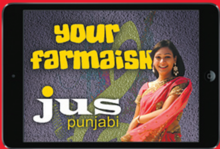
Apple iPad mini