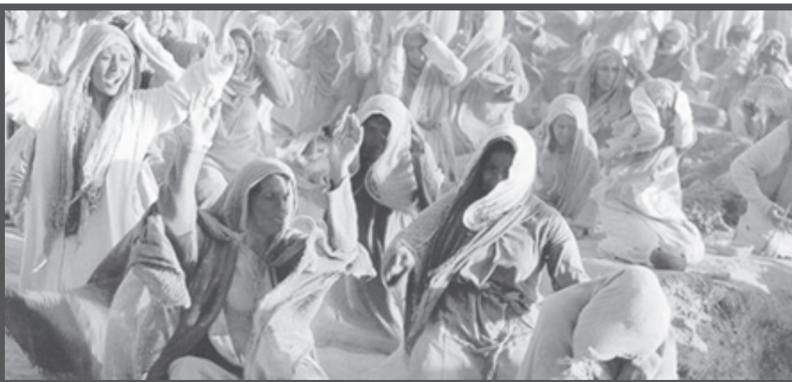
ਫਿਲਮਸਾਜ਼ ਮਾਜਦ ਮਜੀਦੀ ਦੀ ਫਿਲਮ 'ਪਰੋਫਿਟ ਮੁਹੰਮਦ' ਦਾ ਦ੍ਰਿਸ਼। ਇਹ ਫਿਲਮ ਇਸੇ ਸਾਲ ਰਿਲੀਜ਼ ਹੋ ਰਹੀ ਹੈ।