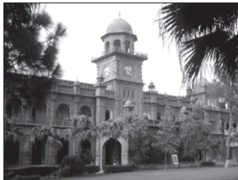
ਪੰਜਾਬ ਯੂਨੀਵਰਸਿਟੀ, ਲਾਹੌਰ