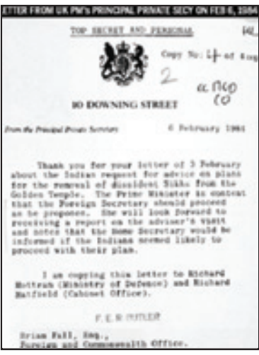
6 ਫਰਵਰੀ 1984 ਨੂੰ ਜਾਰੀ ਚਿੱਠੀ ਜਿਸ ਤੋਂ ਵਿਵਾਦ ਭਖਿਆ। (ਸੱਜੇ) ਮਾਰਗਰੇਟ ਥੈਚਰ ਅਤੇ ਇੰਦਰਾ ਗਾਂਧੀ ਦੀ ਤਸਵੀਰ।