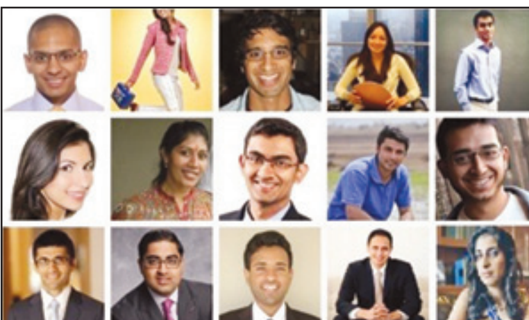
ਸ਼ਾਮਲ ਹਨ। ਫੋਰਬਜ਼ ਦਾ ਕਹਿਣਾ ਹੈ ਕਿ ਇਹ ਦੌਰ ਪ੍ਰਤਿਭਾਸ਼ਾਲੀ ਨੌਜਵਾਨਾਂ ਦਾ ਹੈ। ਇਸ ਤੋਂ ਪਹਿਲਾਂ ਨੌਜਵਾਨਾਂ ਨੂੰ ਆਪਣੀ ਪ੍ਰਤਿਭਾ ਦਿਖਾਉਣ ਦਾ ਅਜਿਹਾ ਮੌਕਾ ਨਹੀਂ ਸੀ ਮਿਲਿਆ।

ਨਿਊ ਯਾਰਕ: ਫੋਰਬਜ਼ ਰਸਾਲੇ ਦੀ ਸਭ ਤੋਂ ਪ੍ਰਤਿਭਾਸ਼ਾਲੀ ਯੁਵਾ ਸਿਤਾਰਿਆਂ ਦੀ ਸਾਲਾਨਾ ਸੂਚੀ ਵਿਚ ਭਾਰਤੀ ਮੂਲ ਦੇ 20 ਤੋਂ ਵੱਧ ਨੌਜਵਾਨ ਤੇ ਮੁਟਿਆਰਾਂ ਸ਼ਾਮਲ ਹਨ। ਰਸਾਲੇ ਨੇ ਵਿੱਤ, ਮੀਡੀਆ, ਖੇਡਾਂ ਤੇ ਸਿੱਖਿਆ ਵਰਗੇ ਵੱਖ-ਵੱਖ ਖੇਤਰਾਂ ਦੇ 30 ਸਾਲ ਤੋਂ ਘੱਟ ਉਮਰ ਦੇ ਇਨ੍ਹਾਂ ਨੌਜਵਾਨਾਂ ਨੂੰ 'ਵਿਲੱਖਣ' ਕਰਾਰ ਦਿੱਤਾ ਜੋ ਆਪਣੇ ਢੰਗ ਨਾਲ ਦੁਨੀਆਂ ਵਿਚ ਸਾਕਾਰਾਤਮਕ ਬਦਲਾਅ ਲਿਆ ਰਹੇ ਹਨ। ਫੋਰਬਜ਼ ਦੀ 30 ਸਾਲ ਤੋਂ ਘੱਟ ਉਮਰ 30 ਦੇ ਸਭ ਤੋਂ ਸਫਲ ਨੌਜਵਾਨਾਂ (30 ਅੰਡਰ-30) ਦੀ ਸੂਚੀ ਵਿਚ 15 ਵੱਖ-ਵੱਖ ਖੇਤਰਾਂ ਵਿਚ ਸਭ ਤੋਂ ਸਫਲ ਨੌਜਵਾਨ ਸ਼ਾਮਲ ਹਨ ਜਿਨ੍ਹਾਂ ਵਿਚ ਪੌਪ ਗਾਇਕ ਜਸਟਿਨ ਬੀਵਰ, ਮਿਲੀ ਸਾਇਰਸ, ਟੇਲਰ ਸਵਿਫਟ, ਬਲੋਗਿੰਗ ਪਲੈਟਫਾਰਮ ਟੇਬਲਰ ਡੇਵਿਡ ਕਰੈਪ, ਟੈਨਿਸ ਖਿਡਾਰਨ ਮਾਰੀਆ ਸਾਰਾਪੋਵਾ ਤੇ ਪਾਕਿਸਤਾਨ ਦੀ ਮਲਾਲਾ ਯੂਸਫ਼ਈ