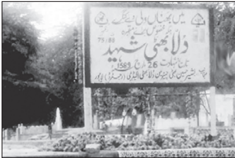
ਮਿਆਨੀ ਸਾਹਿਬ ਕਬਰਿਸਤਾਨ ਵਿਚ ਦੁੱਲੇ ਭੱਟੀ ਦੀ ਕਬਰ

ਵਾਰ-ਵਾਰ ਫਰੀਦ ਭੱਟੀ ਵੱਲੋਂ ਸਾਂਦਲਬਾਰ ਦਾ ਲਗਾਨ ਨਾ ਦੇਣ ਅਤੇ ਸ਼ਾਹੀ ਫੌਜ ਨਾਲ ਮਾਰ-ਧਾੜ ਕਰਨ ਦੀਆਂ ਖਬਰਾਂ ਸੁਣ-ਸੁਣ ਕੇ ਤੰਗ ਆ ਚੁੱਕੇ ਬਾਦਸ਼ਾਹ ਹਮਾਯੂੰ ਨੇ ਸ਼ਾਹੀ ਫਰਮਾਨ ਜਾਰੀ ਕਰਦਿਆਂ ਫਰੀਦ ਖਾਂ ਭੱਟੀ ਅਤੇ ਸਾਂਦਲ ਭੱਟੀ ਨੂੰ ਗ੍ਰਿਫਤਾਰ ਕਰ ਕੇ ਦਰਬਾਰ ਵਿਚ ਪੇਸ਼ ਕਰਨ ਦਾ ਹੁਕਮ ਦਿੱਤਾ। ਸ਼ਾਹੀ ਫੌਜ ਨੇ ਇਹ