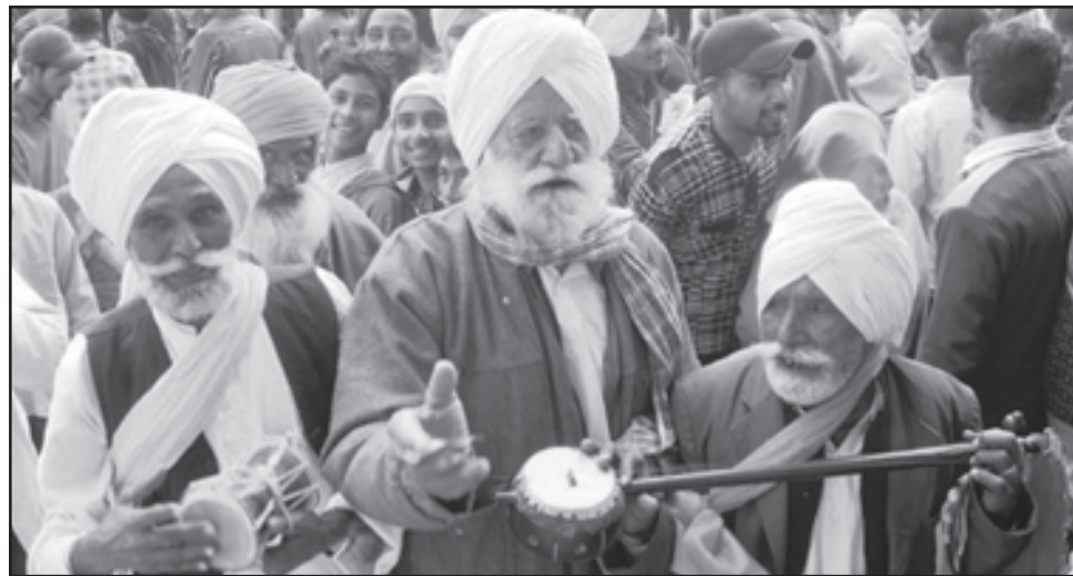
ਮਾਘੀ ਮੇਲੇ ਵਿਚ ਰੌਣਕਾਂ ਲਾ ਰਹੇ ਕਵੀਸ਼ਰ

ਇਸ਼ਨਾਨ ਕਰਨ ਦੀ ਇਸ ਧਾਰਨਾ ਪਿੱਛੇ ਇਕ ਤੱਥ ਇਹ ਵੀ ਹੈ ਕਿ ਪੋਂਗ ਦਾ ਮਹੀਨਾ ਦਲਿੰਦਰ ਦਾ ਮਹੀਨਾ ਸਮਝਿਆ ਜਾਂਦਾ ਹੈ। ਇਸ ਮਹੀਨੇ ਸਰਦੀ ਵੀ ਹੱਡ-ਠਾਰਵੀਂ ਪੈਂਦੀ ਹੈ ਜਿਸ ਕਰ ਕੇ ਆਮ ਲੋਕ ਨਹਾਉਣ ਤੋਂ ਕੰਨੀ ਕਤਰਾਉਂਦੇ ਹਨ ਤੇ ਲੰਮਾ ਸਮਾਂ ਇਸ਼ਨਾਨ ਨਾ ਕਰ ਕੇ ਦਲਿੰਦਰੀ ਬਣੇ ਰਹਿੰਦੇ ਹਨ। ਪੁਰਾਣੇ ਸਮਿਆਂ ਵਿਚ ਘਰਾਂ ਵਿਚ ਨਹਾਉਣ ਦਾ ਪ੍ਰਬੰਧ ਅੱਜ ਕੱਲ੍ਹ ਵਾਂਗ ਨਹੀਂ ਸੀ ਹੁੰਦਾ। ਨਾ ਨਲਕੇ ਹੁੰਦੇ ਸਨ, ਨਾ ਪਾਣੀ ਵਾਲੀਆਂ ਟੂਟੀਆਂ... ਲੋਕਾਂ ਨੂੰ ਘਰਾਂ ਤੋਂ ਬਾਹਰ ਜਾ ਕੇ ਖੁਹਾਂ-ਟੋਢਿਆਂ 'ਤੇ ਇਸ਼ਨਾਨ ਕਰਨਾ ਪੈਂਦਾ ਸੀ। ਮਾਘੀ ਨੂੰ ਦਿਨ ਵੱਡੇ ਹੋ ਜਾਂਦੇ ਹਨ ਤੇ ਠੰਢ ਘਟ ਜਾਂਦੀ ਹੈ। ਪੰਜਾਬੀਆਂ ਦਾ ਮਨਮੋਹਕ ਤਿਉਹਾਰ ਲੋਹੜੀ ਪੋਂਗ ਮਹੀਨੇ ਦੀ ਆਖਰੀ ਰਾਤ ਨੂੰ ਮਨਾਇਆ ਜਾਂਦਾ ਹੈ ਤੇ ਉਸ ਤੋਂ ਅਗਲੇ ਦਿਨ ਮਾਘੀ ਦਾ ਪੁਰਬ ਖੁਸ਼ੀਆਂ-ਖੇਡਿਆਂ ਦਾ ਢੋਆ ਲੈ ਕੇ ਲੋਕ ਮਨਾਂ ਵਿਚ ਨਵੀਂ ਚੇਤਨਾ ਤੇ ਉਤਸ਼ਾਹ ਪੈਦਾ ਕਰਦਾ ਹੈ। 'ਮੁਕਤਸਰ ਦੀ ਮਾਘੀ' ਦਾ ਮੇਲਾ ਪੰਜਾਬੀਆਂ ਲਈ ਪੁਰਾਤਨ ਸਮੇਂ ਤੋਂ ਹੀ