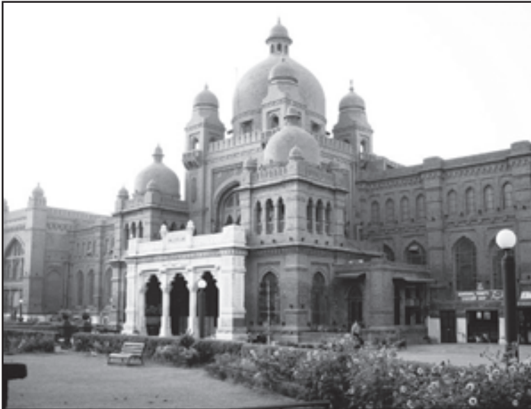
ਲਾਹੌਰ ਦਾ ਅਜਾਇਬ ਘਰ

ਹੁਣ ਗੱਲ ਕਰੀਏ ਪੰਜਾਬੀ ਜ਼ਬਾਨ ਅਤੇ ਸਭਿਆਚਾਰ ਦੀ। 1849 ਵਿਚ ਜਦੋਂ ਅੰਗਰੇਜ਼ਾਂ ਨੇ ਸਿੱਖ ਸਾਮਰਾਜ ਉਪਰ ਫਤਿਹ ਪ੍ਰਾਪਤ ਕੀਤੀ ਤਾਂ ਉਤਰ ਪੱਛਮੀ ਸਰਹੱਦੀ ਸੂਬੇ ਅਤੇ ਕਸ਼ਮੀਰ ਨੂੰ ਪੰਜਾਬ ਤੋਂ ਅਲਹਿਦਾ ਤਸੱਵਰ ਕੀਤਾ। 1857