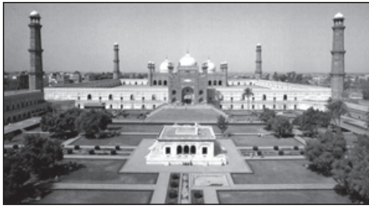
ਲਾਹੌਰ ਦਾ ਵਿਰਾਟ ਦ੍ਰਿਸ਼

ਮਸ਼ਹੂਰ ਲਿਖਾਰੀ ਖੁਸ਼ਵੰਤ ਸਿੰਘ ਕਈ ਵਾਰੀ ਲਿਖ ਚੁੱਕੇ ਹਨ ਕਿ 1947 ਤੋਂ 1980 ਤਾਈਂ ਉਹ ਜਦੋਂ ਵੀ ਖਾਨ ਮਾਰਕਿਟ ਦਿੱਲੀ ਵਿਚ ਖਰੀਦ-ਓ-ਫਰੋਖਤ ਜਾਂ ਗੱਪਾਂ ਮਾਰਨ ਜਾਂਦੇ ਸਨ ਤਾਂ ਉਥੇ ਸਾਰੇ ਹੀ ਦੁਕਾਨਦਾਰ ਲਾਹੌਰੀ ਬੋਲਦੇ ਸਨ। 1980 ਤੋਂ ਬਾਅਦ ਜੋ ਦੁਕਾਨਦਾਰ ਚਲਾਣਾ ਕਰ ਗਏ, ਉਨ੍ਹਾਂ ਦੇ ਪੁੱਤਰ ਪੌਤਰੇ ਓਨੀ ਚੰਗੀ ਪੰਜਾਬੀ ਬੋਲਣ ਦੇ ਕਾਬਿਲ ਨਹੀਂ ਸਨ। ਸੰਨ 2000 ਤੱਕ ਪੁੱਜਦਿਆਂ ਲਾਹੌਰੀ ਪੰਜਾਬੀ ਬੋਲਣ ਵਾਲਿਆਂ ਦੀ ਗਿਣਤੀ ਅੱਧੀ ਵੀ ਨਹੀਂ ਰਹਿ ਗਈ। ਜੇ ਹਾਲ ਲਾਹੌਰੀ ਪੰਜਾਬੀ ਦਾ ਦਿੱਲੀ ਵਿਚ ਹੋ ਰਿਹਾ ਹੈ, ਬਾਕੀ ਭਾਰਤ ਵਿਚ ਹਾਲ ਇਸ ਤੋਂ ਵੀ ਭੈੜਾ ਹੈ। ਪੂਰਬੀ ਪੰਜਾਬ ਵਿਚ ਅੰਮ੍ਰਿਤਸਰ, ਗੁਰਦਾਸਪੁਰ, ਫਿਰੋਜ਼ਪੁਰ, ਕਪੂਰਥਲਾ ਅਤੇ ਜਲੰਧਰ ਵਿਚ ਅਜੇ ਵੀ ਲਾਹੌਰੀ ਪੰਜਾਬੀ ਵਿਚ