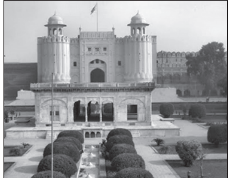
ਲਾਹੌਰ ਦਾ ਕਿਲਾ

ਹੁਣ ਗੱਲ ਕਰਦੇ ਹਾਂ ਪੰਜਾਬੀ ਤਹਿਜੀਬ ਅਤੇ ਸਭਿਆਚਾਰ ਦੀ ਜ਼ਿੰਦ-ਜਾਨ, ਸ਼ਹਿਰ ਲਾਹੌਰ