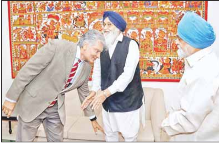
ਸ੍ਰੀ ਜਾਖੜ ਸ. ਬਾਦਲ ਦੇ ਪੈਰੀਂ ਹੱਥ ਲਾਉਂਦੇ ਹੋਏ

ਚੰਡੀਗੜ੍ਹ: ਪੰਜਾਬ ਕਾਂਗਰਸ ਵਿਧਾਇਕ ਦਲ ਦੇ ਆਗੂ ਸੁਨੀਲ ਜਾਖੜ ਨੇ ਕਿਹਾ ਕਿ ਉਹ ਮੁੱਖ ਮੰਤਰੀ ਪ੍ਰਕਾਸ਼ ਸਿੰਘ ਬਾਦਲ ਦਾ ਬੜੇ ਬਜ਼ੁਰਗ ਹੀ ਸਤਿਕਾਰ ਕਰਦੇ ਹਨ ਜਦਕਿ ਅਕਾਲੀ ਦਲ-ਭਾਜਪਾ ਸਰਕਾਰ ਦਾ ਅਸਲ ਚਿਹਰਾ ਆ ਰਹੇ ਵਿਧਾਨ ਸਭਾ ਸੈਸ਼ਨ ਦੌਰਾਨ ਲੋਕਾਂ ਮੁਹਰੇ ਰੱਖਿਆ ਜਾਵੇਗਾ। ਉਨ੍ਹਾਂ ਕਿਹਾ ਕਿ ਚਾਰ ਅਕਤੂਬਰ ਨੂੰ ਉਹ ਪੰਜਾਬ ਦੀ ਵੱਡੀ ਸਮੱਸਿਆ ਸੇਮ ਦੇ ਮੁੱਦੇ ਨੂੰ ਲੈ ਕੇ ਸ. ਬਾਦਲ ਨਾਲ ਦਿੱਲੀ ਵਿਚ ਕੇਂਦਰੀ ਯੋਜਨਾ ਕਮਿਸ਼ਨ ਦੇ ਉਪ ਚੇਅਰਮੈਨ ਡਾਕਟਰ ਮੋਨਟੇਕ ਸਿੰਘ ਆਹਲੂਵਾਲੀਆ ਨੂੰ ਮਿਲਣ ਗਏ ਸਨ।