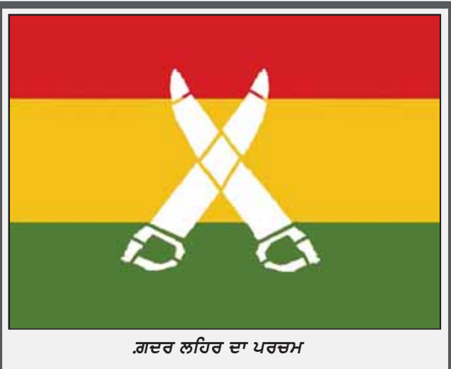
ਗਦਰ ਲਹਿਰ ਦਾ ਪਰਚਮ