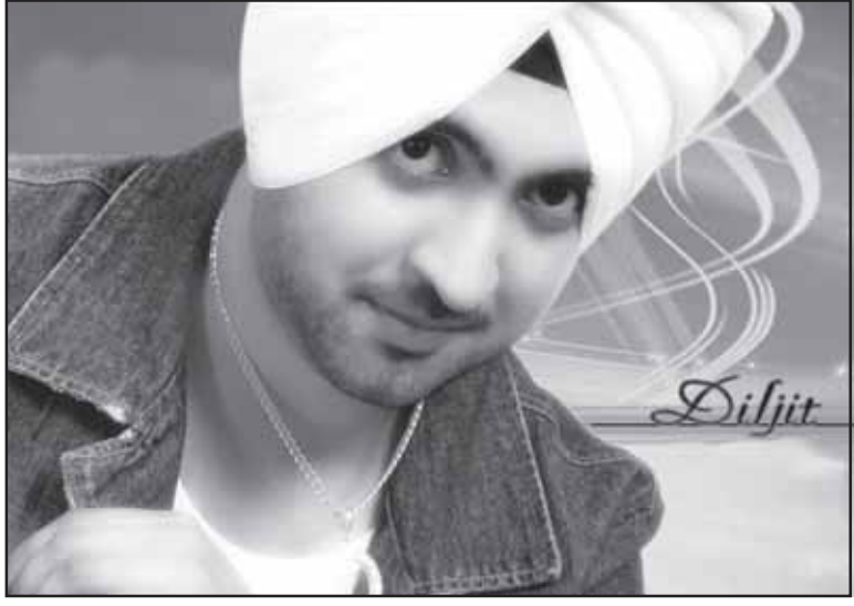
ਲੱਕ ਟਵੰਟੀ ਏਟ ਕੁੜੀ ਦਾ, ਵੌਰਟੀ ਸੈਵਨ ਵੇਟ ਕੁੜੀ ਦਾ...

ਅਸੀਂ ਆਪਣੀ ਭਾਸ਼ਾ ਤਾਂ ਕੀ, ਆਪਣੇ ਨਾਂ ਵੀ ਨਹੀਂ ਬਚਾ ਸਕੇ। ਗੁਰੂ ਨੇ 'ਕੌਰ' ਤੇ 'ਸਿੰਘ' ਨਿਵੇਕਲੀ ਪਛਾਣ ਵਜੋਂ ਦਿੱਤੇ ਸਨ ਪਰ ਹੁਣ ਨਾਂਵਾਂ ਨਾਲ ਕੋਈ 'ਸਿੰਘ' ਅਤੇ 'ਕੌਰ' ਲਾ ਕੇ ਰਾਜ਼ੀ ਨਹੀਂ। ਅਖਬਾਰਾਂ ਪੜ੍ਹ ਲਵੋ ਜਾਂ ਕੋਈ ਅਨਾਊਸਮੈਂਟ ਸੁਣ ਲਵੋ। ਚੀਮਾ, ਰੰਧਾਵਾ, ਸੇਠੀ,