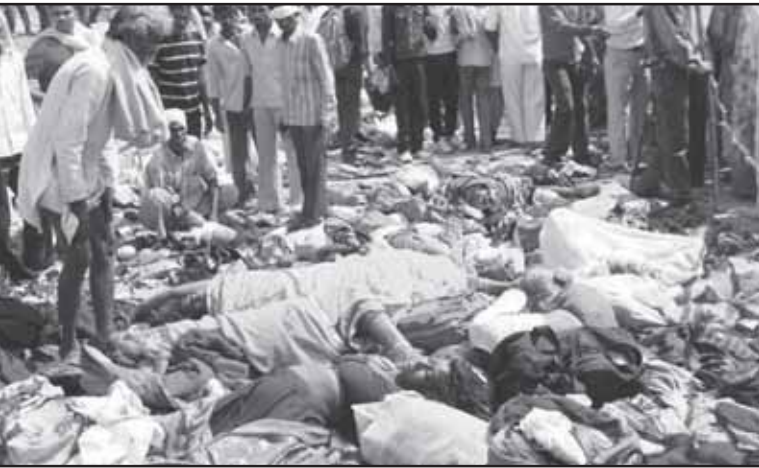
ਰਤਨਗੜ੍ਹ (ਮੱਧ ਪ੍ਰਦੇਸ਼) ਵਿਚ ਮਚੀ ਭਗਦਤ ਦਾ ਸ਼ਿਕਾਰ ਹੋਏ ਲੋਕਾਂ ਦੀਆਂ ਲਾਸ਼ਾਂ

ਦਿਨ ਮੌਜ ਮੇਲੇ ਤੇ ਨੱਚਣ ਕੁੱਦਣ ਦੇ ਮੌਕੇ ਵੀ ਸਨ। ਹੁਣ ਵਸੋਂ ਦੇ ਵਾਧੇ ਤੇ ਆਵਾਜਾਈ ਦੀ ਗਤੀ ਨੇ ਤਿੱਥਾਂ ਤਿਉਹਾਰਾਂ ਲਈ ਆਪੇ ਸਿਰਜੀਆਂ ਘੜੀਆਂ ਨੂੰ ਮਨਹੂਸ ਬਣਾ ਛੱਡਿਆ ਹੈ। ਇਕ ਅਨੁਮਾਨ ਅਨੁਸਾਰ ਪਿਛਲੇ ਅੱਠ ਸਾਲਾਂ ਵਿਚ ਮੰਧਾਰ ਦੇਵੀ ਮਹਾਰਾਸ਼ਟਰ (340), ਨੈਨਾ ਦੇਵੀ, ਹਿਮਾਚਲ (150), ਚਮੁੰਡਾ ਦੇਵੀ