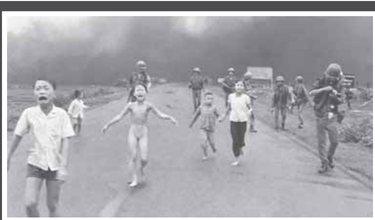
ਤਸਵੀਰਸਾਜ਼ ਕੈਵਨ ਕਾਰਟਰ ਦੀ ਉਹ ਤਸਵੀਰ (ਖੱਬੇ) ਜਿਸ ਨੇ ਉਸ ਦੀ ਜਾਨ ਲੈ ਲਈ ਅਤੇ (ਸੱਜੇ) ਨਾਪਾਮ ਬੰਬ ਚੱਲਣ ਤੋਂ ਬਾਅਦ ਭੱਜੇ ਜਾ ਰਹੇ ਲੋਕ।

ਤਸਵੀਰਸਾਜ਼ਾਂ ਅਤੇ ਦਸਤਾਵੇਜ਼ੀ ਫਿਲਮਸਾਜ਼ਾਂ ਬਾਰੇ ਇੱਕ ਵਿਚਾਰ ਹੈ ਕਿ ਉਹ ਪੀੜਤ ਨੂੰ ਬਚਾਉਣ ਨਾਲੋਂ ਉਹਦੀ ਤਸਵੀਰ ਬਣਾਉਣ 'ਚ ਵਧੇਰੇ ਦਿਲਚਸਪੀ ਰੱਖਦੇ ਹਨ। ਇਹ ਸਵਾਲ ਬਾਰੇ ਆਲਮੀ ਪੱਧਰ 'ਤੇ ਬਹਿਸ ਚੱਲ ਰਹੀ ਹੈ। ਇਹ ਬਹਿਸ ਅਫਰੀਕੀ ਤਸਵੀਰਸਾਜ਼ ਕੈਵਨ ਕਾਰਟਰ ਦੇ ਹਵਾਲੇ ਨਾਲ ਵਧੇਰੇ ਭਖੀ ਸੀ। ਵੀਹਵੀਂ ਸਦੀ ਦੇ ਆਖਰੀ ਦਹਾਕੇ 'ਚ ਸੂਡਾਨ ਭਿਆਨਕ ਅਕਾਲ ਦੀ ਮਾਰ ਹੇਠ ਸੀ। ਕੈਵਨ ਕਾਰਟਰ ਵਲੋਂ ਮਾਰਚ 1993 ਨੂੰ ਖਿੱਚੀ ਤਸਵੀਰ ਨੇ ਕੁੱਲ ਆਲਮ ਨੂੰ ਹਿਲਾ ਕੇ ਰੱਖ ਦਿੱਤਾ। ਤਸਵੀਰ 'ਚ ਭੁੱਖਮਰੀ ਦੀ ਸ਼ਿਕਾਰ ਸੂਡਾਨੀ ਬੱਚੀ ਕਿਲੋਮੀਟਰ ਦੂਰ ਸੰਯੁਕਤ ਰਾਸ਼ਟਰ ਦੇ ਖੁਰਾਕ ਡੇਰੇ ਵੱਲ ਸਰਕ ਰਹੀ ਹੈ। ਪਿੱਛੇ ਬੈਠੀ ਗਿਰਝ ਉਹਦੇ ਮਰਨ ਦੀ ਉਡੀਕ 'ਚ ਹੈ। ਕੈਵਨ ਤਸਵੀਰ ਖਿੱਚ ਕੇ ਉੱਥੋਂ ਚਲਾ ਗਿਆ। ਇਹ ਤਸਵੀਰ 'ਨਿਊ ਯਾਰਕ ਟਾਈਮਜ਼' ਵਿਚ 26 ਮਾਰਚ 1993 ਨੂੰ ਛਪੀ। ਹਜ਼ਾਰਾਂ ਲੋਕਾਂ ਨੇ ਬੱਚੀ ਦੀ ਹੋਣੀ ਬਾਬਤ ਅਖ਼ਬਾਰ ਤੋਂ ਪੁੱਛਿਆ। ਅਖ਼ਬਾਰ ਮੁਤਾਬਕ ਬੱਚੀ ਦੇ ਖੁਰਾਕ ਡੇਰੇ ਤੱਕ ਸਹੀ-ਸਲਾਮਤ ਪਹੁੰਚਣ ਦੀ ਕੋਈ ਜਾਣਕਾਰੀ ਨਹੀਂ ਹੈ। 1994 ਵਿਚ ਇਸ ਤਸਵੀਰ ਨੂੰ ਵੱਕਾਰੀ ਪੁਲਿਟਰਜ਼ ਇਨਾਮ ਮਿਲਿਆ ਪਰ ਬੱਚੀ ਦੀ ਮਦਦ ਨਾ ਕਰਨ ਲਈ ਕੈਵਨ ਦੀ ਦੁਨੀਆਂ ਭਰ 'ਚ ਬਦਨਾਮੀ ਹੋਈ। ਫਲੋਰਿਡਾ ਦੇ ਇੱਕ ਅਖ਼ਬਾਰ ਨੇ ਕੈਵਨ ਬਾਰੇ ਲਿਖਿਆ ਸੀ, "ਬੱਚੀ ਦੇ ਦਰਦ ਦਾ ਸਹੀ ਖਾਕਾ ਖਿੱਚਣ ਲਈ ਕੈਮਰੇ ਦਾ ਸ਼ੀਸ਼ਾ ਸੰਵਾਰ ਰਿਹਾ ਲੁਟੇਰਾ ਬੰਦਾ, ਦ੍ਰਿਸ਼ ਵਿਚ ਬੈਠੀ ਦੂਜੀ ਗਿਰਝ