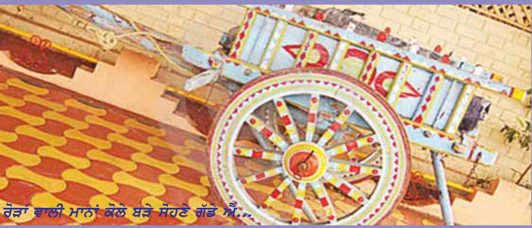
ਰੋੜਾਂ ਵਾਲੀ ਮਾਨਾਂ ਕੋਲੇ ਬੜੇ ਸੋਹਣੇ ਗੱਡੇ ਐ...

ਕੰਦੂ ਖੇੜੇ ਨਾਲ ਬੀਕਾਨੇਰ ਦੀ ਸਰਹੱਦ ਲੱਗੇ, ਕੋਰਾ ਰੋੜਾ ਉੱਡਦਾ ਵਗਣ ਜਦੋਂ ਨੁਰੀਆਂ। ਫੱਤੇ ਕੇਰੇ ਹਾਕੂਵਾਲ ਵਾਲੇ ਉੱਚੀਆਂ ਜ਼ਮੀਨਾਂ ਜ਼ਿਆਦੇ, ਪਾਣੀ ਘੱਟ ਲੱਗਦਾ ਲਗਾਉਂਦੇ ਲੋਕ ਬੇਰੀਆਂ। ਘੁਮਿਆਰਾਂ ਤੇ ਲੁਹਾਰਾਂ ਪਿੰਡ ਤੀਸਰਾ ਭੁੱਲਰ ਵਾਲਾ, ਘੋੜੀਆਂ ਦਾ ਸ਼ੋਕ