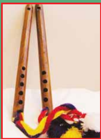
ਲੁਧਿਆਣੇ ਲਵੇ ਦੇ ਲਗੋਜਿਆਂ ਦੇ ਸ਼ੌਕੀ ਬਾਹਲੇ...