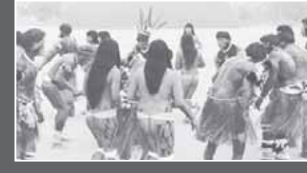
ਫਿਲਮਸਾਜ਼ ਕਾਉ ਹੈਮਬਰਗਰ ਵੱਲੋਂ 2012 ਵਿਚ ਬਣਾਈ ਫਿਲਮ 'ਜ਼ਿੰਗੋ' ਦਾ ਪੋਸਟਰ (ਉਪਰ) ਅਤੇ (ਹੇਠਾਂ, ਖੱਬੇ ਹੱਥ) ਫਿਲਮ ਦੇ ਇਕ ਦ੍ਰਿਸ਼ ਵਿਚ ਨੱਚ ਰਹੇ ਆਦਿਵਾਸੀ।

ਪਹਿਲਾ ਖੋਜੀ ਦਲ ਜ਼ਿੰਗੋ ਦਰਿਆ ਦੇ ਆਲੇ-ਦੁਆਲੇ 'ਨਵੇਂ ਸੰਪਰਕ' ਬਣਾਉਣ ਲਈ ਭੇਜਿਆ ਗਿਆ। ਇਸ ਦਲ ਵਿਚ ਤਿੰਨ ਵਿਲਾਸ ਬੋਆਜ਼ ਭਰਾ ਸ਼ਾਮਲ ਸਨ। ਅਸਲ ਵਿਚ ਖੋਜੀ ਦਲ 'ਚ ਅਨਪੜ੍ਹਾਂ ਨੂੰ ਚੁਣਿਆ ਜਾ ਰਿਹਾ ਸੀ। ਇਨ੍ਹਾਂ ਜਗਿਆਸੂ ਭਰਾਵਾਂ ਨੇ ਆਪਣੇ ਆਪ ਨੂੰ ਅਨਪੜ੍ਹ ਦੱਸ ਕੇ ਦਲ 'ਚ ਥਾਂ ਬਣਾ ਲਈ। ਬ੍ਰਾਜ਼ੀਲੀ ਫਿਲਮ 'ਜ਼ਿੰਗੋ' ਇਨ੍ਹਾਂ ਤਿੰਨਾਂ ਭਰਾਵਾਂ ਦੀ ਕਹਾਣੀ ਹੈ। 'ਅਣਫੋਹੇ' ਇਲਾਕੇ ਵਿਚ ਜਾਣਾ ਜੋਖਮ ਭਰਿਆ ਕੰਮ ਸੀ। ਉੱਥੇ ਕਿਸੇ ਦੇ ਇਲਾਕੇ 'ਚ ਧੱਕੇ ਦੀ ਘੁਸਪੈਠ ਖ਼ਤਰੇ ਤੋਂ ਖਾਲੀ ਨਹੀਂ ਹੈ। ਛੇਤੀ ਹੀ ਹਥਿਆਰਾਂ ਨਾਲ ਲੈਸ ਦਲ ਦਾ ਸਾਹਮਣਾ ਮੂਲਵਾਸੀ ਕਬੀਲੇ ਨਾਲ ਹੋ ਜਾਂਦਾ ਹੈ। ਕਬੀਲੇ ਨੇ ਪਹਿਲੀ ਵਾਰ ਗੋਰੇ ਬੰਦੇ ਦੇਖੇ ਸਨ। ਗੋਰਿਆਂ ਦੇ ਪ੍ਰਚਾਰ ਦੇ ਉਲਟ ਮੂਲਵਾਸੀ ਖੋਜੀ ਦਲ ਦਾ ਸੁਆਗਤ ਕਰਦੇ ਹਨ। ਦਲ ਦਾ ਕੰਮ ਇਲਾਕੇ 'ਚ ਹਵਾਈ ਪੱਟੀ ਬਣਾਉਣਾ ਹੈ ਤਾਂ ਕਿ ਸਰਕਾਰ ਸਾਰੇ ਖਿੱਤੇ ਵਿਚ 'ਵਿਕਾਸ' ਕਰ ਸਕੇ। ਗੋਰਿਆਂ ਦਾ ਮੂਲਵਾਸੀਆਂ ਨਾਲ ਪਹਿਲਾ ਸੰਪਰਕ ਹੀ ਕਬੀਲੇ ਦੀ ਜਾਨ ਦਾ ਖੋਅ ਬਣ ਜਾਂਦਾ ਹੈ। ਗੋਰਿਆਂ ਨਾਲ ਆਈਆਂ ਮਾਮੂਲੀ ਅਤੇ ਇਲਾਜਯੋਗ ਬਿਮਾਰੀਆਂ (ਫਲੂ, ਮਿਆਦੀ ਬੁਖਾਰ) ਨਾਲ ਪਿੰਡ ਦੀ ਅੱਧੀ ਵਸੋਂ ਖਤਮ ਹੋ ਗਈ। ਛੇਤੀ ਹੀ ਇਹ ਬਿਮਾਰੀ ਉਪਰਲੇ ਜ਼ਿੰਗੋ ਖਿੱਤੇ 'ਚ ਫੈਲ ਗਈ। ਉਨ੍ਹਾਂ ਦੇ ਇਲਾਜ ਦਾ ਕੋਈ ਇੰਤਜ਼ਾਮ ਨਹੀਂ ਸੋਚਿਆ ਸੀ ਗਿਆ। ਵਿਲਾਸ ਬੋਆਜ਼ ਭਰਾ ਸਰਕਾਰ ਤੋਂ ਦਵਾਈਆਂ ਦੀ ਮੰਗ ਕਰਦੇ ਹਨ ਜੋ ਪੂਰੀ ਨਹੀਂ ਕੀਤੀ ਜਾਂਦੀ। ਖੋਜੀ ਦਲ ਦੇ