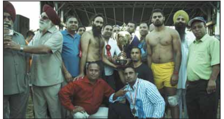
ਓਪਨ ਕਬੱਡੀ ਵਿਚ ਦੂਜੇ ਨੰਬਰ 'ਤੇ ਆਈ ਫਤਿਹ ਕਲੱਬ ਦੀ ਟੀਮ