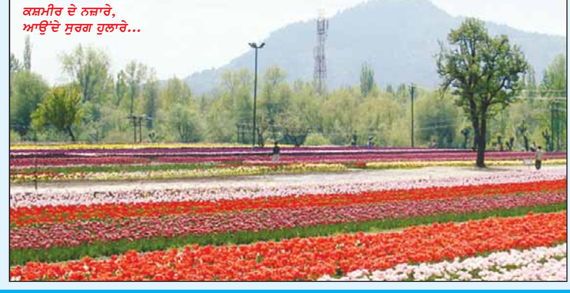
ਕਸ਼ਮੀਰ ਦੇ ਨਜ਼ਾਰੇ, ਆਉਂਦੇ ਸੁਰਗ ਹੁਲਾਰੇ...