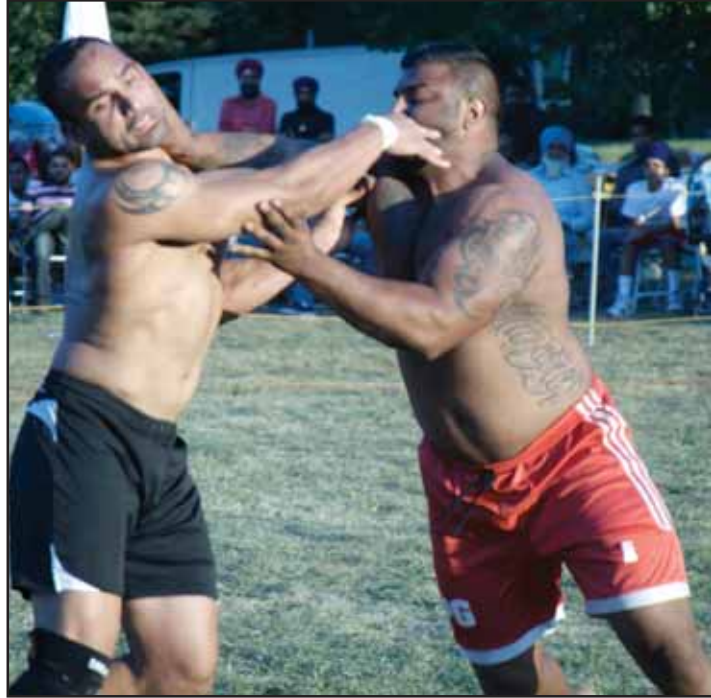
ਨਾ ਭਾਈ ਨਾ, ਕਬੱਡੀ ਤਾਂ ਖੇਡੋ ਪਰ ਇਕ ਦੂਜੇ ਦੇ ਗਲ ਨਾ ਘੁੱਟੋ