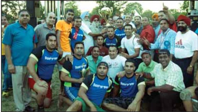
ਓਪਨ ਕਬੱਡੀ ਦੀ ਮੀਰੀ ਪੀਰੀ ਕਲੱਬ ਕੱਪ ਨਾਲ

ਅੰਡਰ-21 ਕਬੱਡੀ ਮੁਕਾਬਲਿਆਂ ਵਿਚ ਜੇਤੂ ਅਤੇ 2100 ਡਾਲਰ ਦੇ ਇਨਾਮ ਦੀ ਹੱਕਦਾਰ ਟੋਰਾਂਟੋ ਦੀ ਟੀਮ ਰਹੀ ਜਦੋਂਕਿ ਦੂਜੇ ਥਾਂ ਟੈਕਸਸ ਦੀ ਟੀਮ ਰਹੀ ਅਤੇ 1500 ਡਾਲਰ ਦਾ ਇਨਾਮ ਇਸ ਨੂੰ ਮਿਲਿਆ। ਇਨ੍ਹਾਂ ਮੁਕਾਬਲਿਆਂ ਵਿਚ