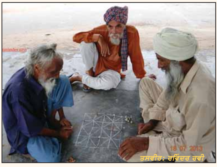
ਕਾਹਦੀ ਜ਼ਿੰਦਗੀ ਰਹਿਜੂ ਜਾਗਰਾ, ਹੁਣ ਜੇ ਮੌਜ ਨਾ ਮਾਣੀ। ਲਾਗੇ ਹੋਈ ਜਾਂਦੀ ਬਚਨ ਸਿਹਾਂ, ਉਮਰਾਂ ਵਾਲੀ ਕਹਾਣੀ। ਪੁੱਤ ਨਹੀਂ ਮੰਨਦਾ, ਪੇਤਾ ਝਿੜਕੇ, ਉਲਝੀ ਜਾਂਦੀ ਤਾਣੀ। ਬਾਕੀ ਖੇਡਾਂ ਹਾਰ ਗਏ ਹਾਂ, ਰਹਿ ਗਈ ਬਾਰਾਂ ਟਾਹਣੀ।