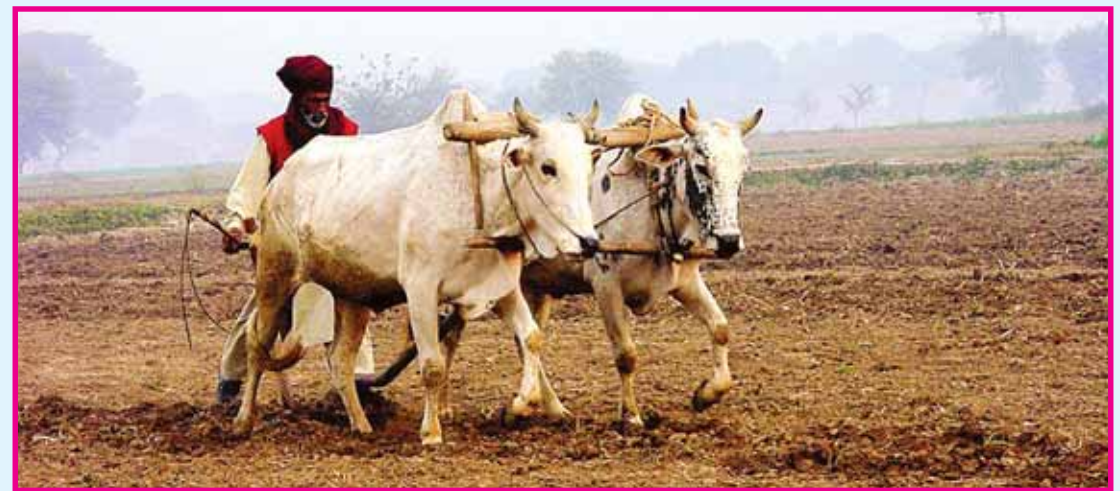
ਬਲਦ ਦੋ ਤਕੜੇ, ਜੋੜ ਲਉ ਛਕੜੇ...

ਅਫ਼ਰਾਂਸ ਅਮਰੀਕਾ ਮੈਂ, ਖਿੜੇ ਫੁੱਲ ਚੁਣਦੇ, ਵਿਸਕੀਆਂ ਪੁਣਦੇ, ਸਿਰੋਂ ਲਾਹ ਟੋਪਾਂ, ਘੜੀ ਜਾਣ ਤੋਪਾਂ 'ਬਾਬੂ' ਬੰਬ, ਟੈਂਕ, ਬਣਦੀਆਂ ਜੀਪਾਂ। ਏਥੇ ਮੁੱਦਤਾਂ ਗੁਜ਼ਰ ਗਈਆਂ ਵੇ, ਵਿੰਗੇ ਹਲ ਓਹੋ, ਪੰਜਾਲੀ ਟੋਹੋ, ਪੱਠਿਆਂ ਦਾ ਤੋੜਾ, ਬਲਦਾਂ ਨੂੰ ਕੀ ਪਾਂ? ਥੋੜਾ ਝਾੜ ਦੇਸਣਾਂ ਦਾ, ਲਵੇ ਬੀ ਹੋਰ, ਟਿਊਬ-ਵੈੱਲ ਬੋਰ, ਸਵਾਰ ਕੇ ਵਾਹਣ, ਬੀਜੇ 'ਕਲਿਆਣ', ਇੱਕੋ-ਇੱਕ ਕਿਲਿਉਂ, ਸੌ ਕੁ ਮਣ ਝੜ ਗਈ। ਮਾਂ ਦੇ ਮਖਣੀ ਖਾਣਿਉਂ ਵੇ, ਸੂਰਮਿਉਂ ਪੁੱਤਰੋ, ਚੁਬਾਰਿਉਂ ਉੱਤਰੋ, ਫਰਕਦੇ ਬਾਜ਼ੂ, ਜਵਾਨੀ ਚੜ੍ਹ ਗਈ।