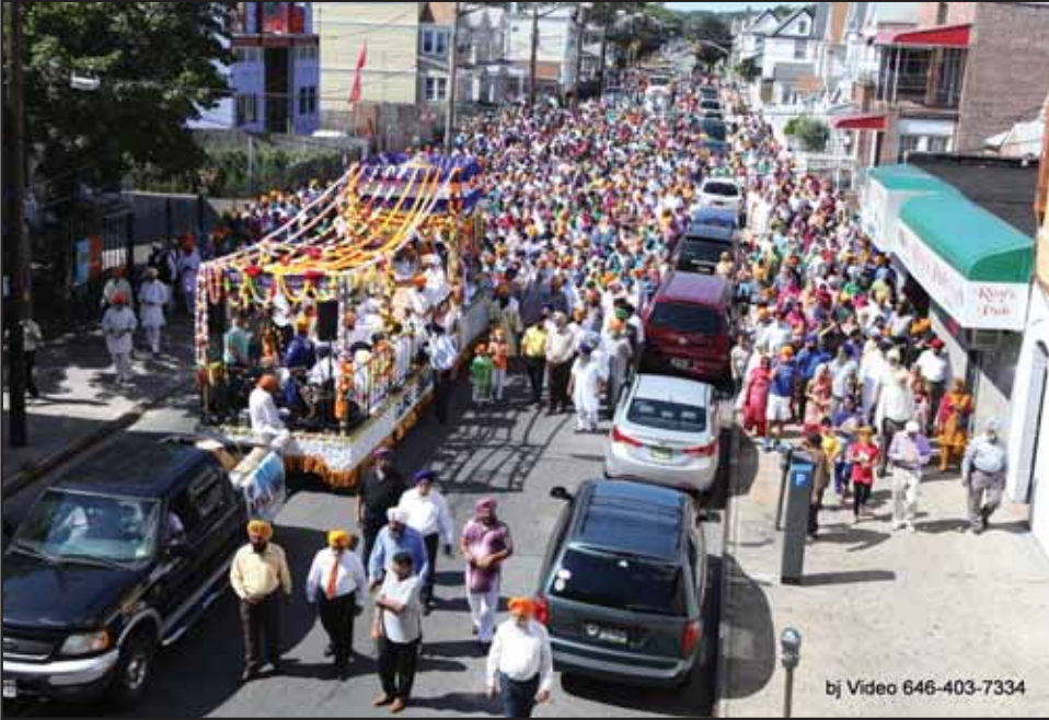
bj Video 646-403-7334