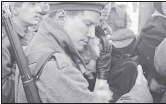
ਫਿਲਮ 'ਜੁਆਇਕਸ ਨੋਇਲ' ਦਾ ਇਕ ਭਾਵ-ਪੂਰਤ ਦ੍ਰਿਸ਼।

ਘਰਵਾਲੀ ਤੱਕ ਚਿੰਠੀ ਪੁਚਾਉਣ 'ਚ ਮਦਦ ਕਰਦਾ ਹੈ। ਜਵਾਬੀ ਹਮਲੇ 'ਚ ਜਰਮਨਾਂ ਨੂੰ ਬਚਾਉਣ ਲਈ ਫਰਾਂਸੀਸੀ ਅਤੇ ਸਕੌਟਿਸ਼ ਉਨ੍ਹਾਂ ਨੂੰ ਅਪਣੇ ਬੰਕਰਾਂ ਵਿਚ ਪਨਾਹ ਦਿੰਦੇ ਹਨ। ਵਾਅਦਾ ਕਰਦੇ ਹਨ ਕਿ ਉਹ ਅਗਲੀ ਵਾਰ ਇੱਕ ਦੂਜੇ ਦੇ ਮੁਲਕਾਂ 'ਚ ਮਹਿਮਾਨ ਬਣ ਕੇ ਜਾਣਗੇ, ਹਮਲਾਵਰ ਬਣ ਕੇ ਨਹੀਂ। ਸੰਗੀਤ ਨਾਲ ਇੱਕ ਦੂਜੇ ਨੂੰ ਵਿਦਾਇਗੀ ਦਿੰਦੇ ਹਨ। ਘਰਾਂ ਨੂੰ ਭੱਜੀਆਂ ਚਿੰਠੀਆਂ ਨਾਲ ਛੇਤੀ ਹੀ ਸਭ ਦਾ ਭੇਤ ਖੁੱਲ੍ਹ ਜਾਂਦਾ ਹੈ। ਸਭ ਤੋਂ ਪਹਿਲੀ ਪੇਸ਼ੀ ਅਮਨਪਸੰਦ ਸਕੌਟਿਸ਼ ਪਾਦਰੀ ਦੀ ਪੈਂਦੀ ਹੈ। ਚਰਚ ਦਾ ਮੁਖੀ ਉਸ ਦੀ ਲਾਹ-ਪਾਹ ਕਰਦਾ ਹੈ ਅਤੇ ਚਰਚ 'ਚੋਂ ਕੱਢ ਦਿੰਦਾ ਹੈ। ਚਰਚ ਮੁਖੀ ਦਾ ਕਹਿਣਾ ਹੈ ਕਿ ਉਸ ਨੇ ਦੁਸ਼ਮਣਾਂ ਨਾਲ ਸਾਂਝ ਭਿਆਲੀ ਪਾ ਕੇ ਰੱਬ ਦੇ ਖ਼ਿਲਾਫ ਜੁਰਮ