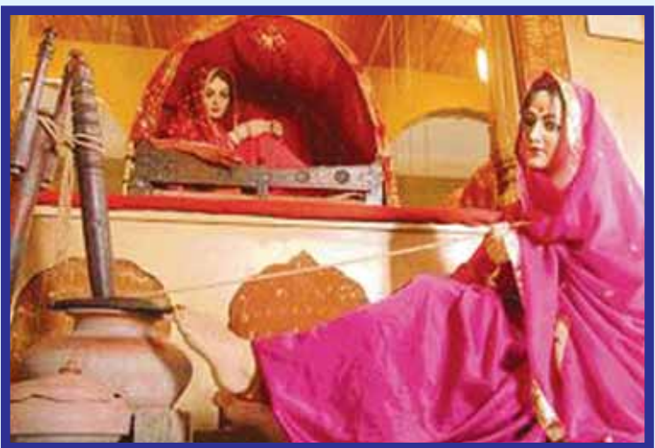
ਮਾਂ ਦੇ ਮਖਣੀ ਖਾਣਿਉਂ ਵੇ...

ਸਉਂ ਗਏ ਤਾਣ ਚਾਦਰੇ ਵੇ, ਸੰਤ ਜਗਮੇਲ, ਮੱਖਣ ਗੁਰਮੇਲ, ਗਰਮ ਕੱਪ ਚਾਹ ਪੀ, ਉੱਠੋ ਮਾਰ ਥਾਪੀ, ਕਰੋ ਹਰਨਾਤੀ, ਪਰਾਣੀ ਫੜ ਕੇ। ਟੈਮ ਚਾਰ ਵਜੇ ਦਾ ਵੇ, ਲਵੇ ਨਾਂ ਰੱਬ ਦਾ, ਭਲਾ ਹੋ ਸਭ ਦਾ, ਬੜਾ ਕੰਮ ਨਿੱਬੜੇ, ਪਹਿਰ ਦੇ ਤੜਕੇ। ਅੱਖ ਪੱਟ ਕੇ ਵੇਖ ਲਉ ਵੇ, ਚੜ੍ਹ ਗਿਆ ਤਾਰਾ, ਕੱਤੇ ਕੰਮ ਭਾਰਾ, ਉਠੋ ਹਲ ਜੋੜੇ, ਖੇੜ ਵੱਲ ਮੋੜੇ,