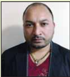
ਡੀ ਜੇ ਸੋਹਣਾ ਕਲਚਰਲ ਕਮੇਟੀ