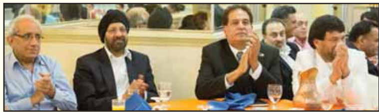
ਪੰਜਾਬੀ ਸਾਹਿਤ ਸਭਾ ਦੇ ਮੇਲੇ ਦੀਆਂ ਕੁਝ ਹੋਰ ਤਸਵੀਰਾਂ