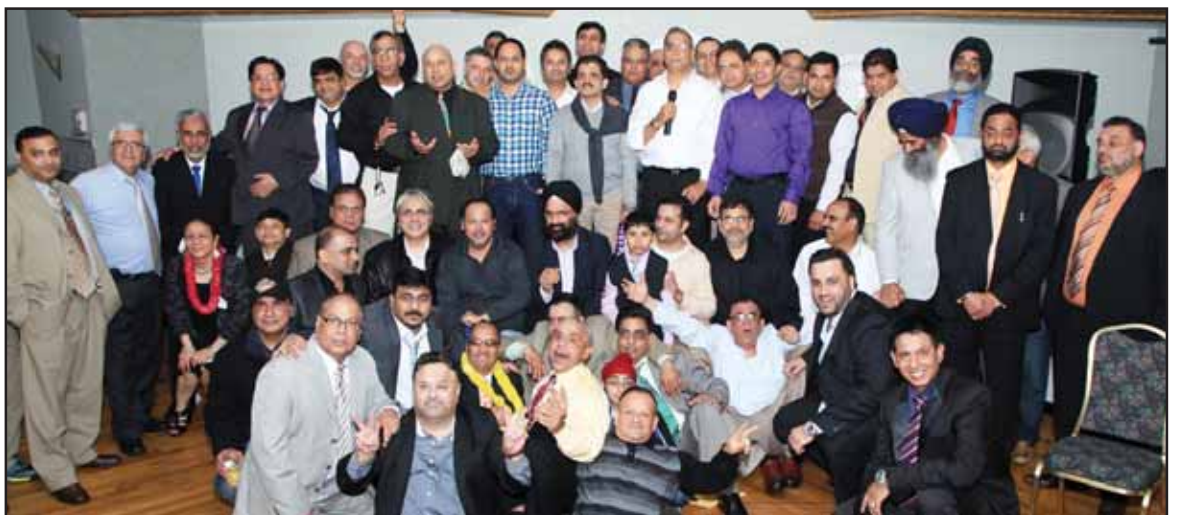
ਵਿਸਾਖੀ ਪਾਰਟੀ ਵਿੱਚ ਸ਼ਾਮਲ ਸਕਾਈਲਾਈਨ ਕਰੈਡਿਟ ਰਾਈਡ ਦੇ ਮੈਂਬਰ