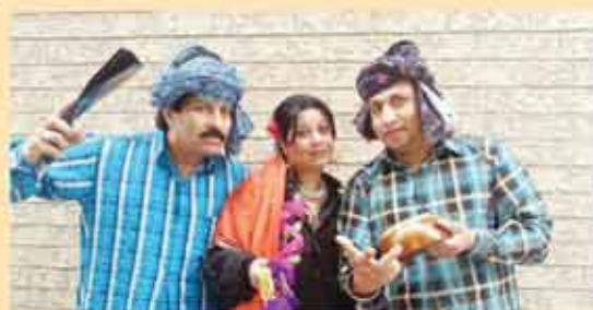
ਭੋਲਾ, ਬੱਲ ਮਹਾਜਨ (ਕੈਨੇਡੀਅਨ ਭੰਡ)