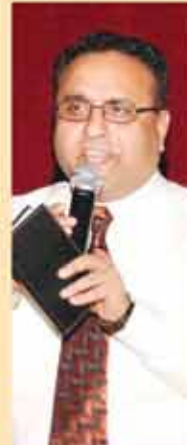
ਭਿੰਦਾ ਬੇਗੋਵਾਲੀਆ ਸੁਸਾਇਟੀ ਦੇ ਪ੍ਰਧਾਨ ਅਤੇ ਐਂਕਰ