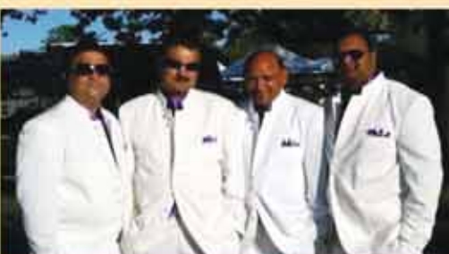
ਨਿਊਯਾਰਕ ਰੌਕ ਬੈਂਡ