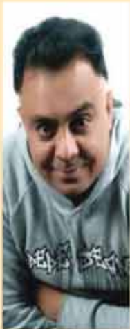
ਕਰਾਂਤੀ ਭੰਗੜੇ ਵਾਲਾ ਐਕਟਰ ਅਤੇ ਸਿੰਗਰ