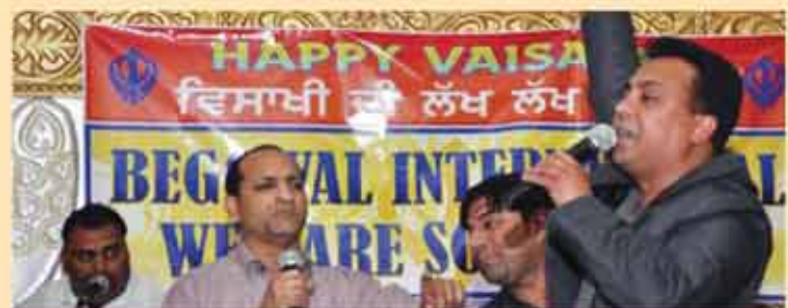
ਰੌਸ਼ਨ ਅਤੇ ਚੀਕੂ