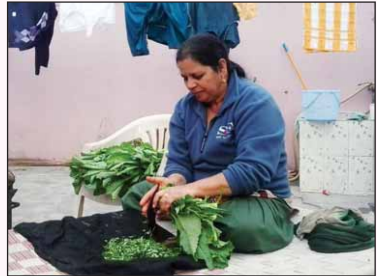
ਪੈਕਟਾਂ ਦੇ ਤੱਤੇ-ਠੰਢੇ ਖਾਣੇ ਖਾਂਦਿਆਂ ਵਤਨਾਂ ਦੀ ਯਾਦ ਕਾਲਜੇ ਨੂੰ ਪੀੜਦੀ। ਮੱਖਣ ਤੇ ਲੱਸੀ ਉਦੋਂ ਯਾਦ ਆ ਗਏ ਰੀਝਾਂ ਨਾਲ ਦੇਖੀ ਬੀਬੀ ਸਾਗ ਚੀਰਦੀ!