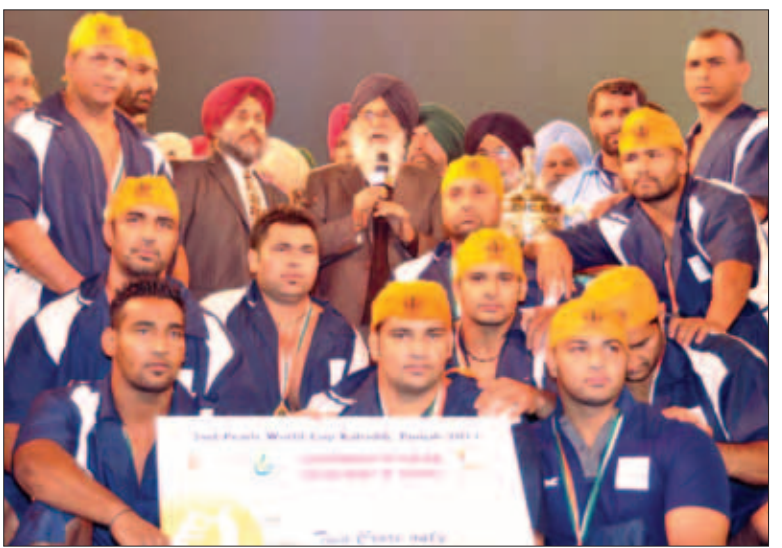
ਭਾਰਤ ਦੀ ਜੇਤੂ ਟੀਮ ਨਾਲ ਮੁੱਖ ਮੰਤਰੀ ਪ੍ਰਕਾਸ਼ ਸਿੰਘ ਬਾਦਲ, ਉਪ ਮੁੱਖ ਮੰਤਰੀ ਸੁਖਬੀਰ ਸਿੰਘ ਬਾਦਲ ਅਤੇ ਹੋਰ।