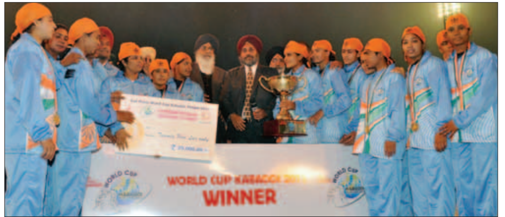
ਵਿਸ਼ਵ ਕਬੱਡੀ ਚੈਂਪੀਅਨ ਬਣੀ ਕੁੜੀਆਂ ਦੀ ਭਾਰਤੀ ਟੀਮ