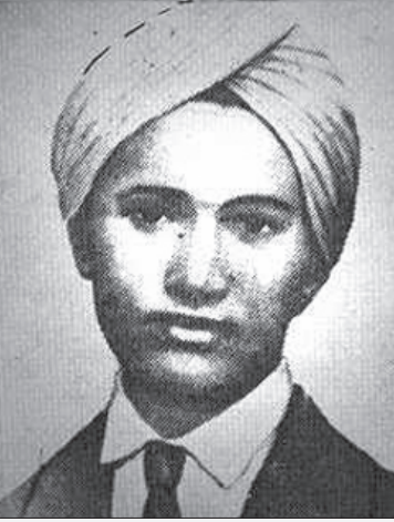
ਸ਼ਹੀਦ ਕਰਤਾਰ ਸਿੰਘ ਸਰਾਭਾ