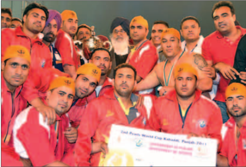
ਵਿਸ਼ਵ ਕਬੱਡੀ ਕੱਪ ਮੁਕਾਬਲੇ 'ਚ ਦੂਜੇ ਥਾਂ ਰਹੀ ਕੈਨੇਡਾ ਦੀ ਟੀਮ

ਜ਼ਿਕਰਯੋਗ ਹੈ ਕਿ ਦੂਜੇ ਵਿਸ਼ਵ ਕਬੱਡੀ ਕੱਪ ਦਾ ਆਗਾਜ਼ ਪਹਿਲੀ ਨਵੰਬਰ ਨੂੰ 'ਬਾਲੀਵੁੱਡ ਦੇ ਤੜਕੇ' ਨਾਲ ਹੋਇਆ ਸੀ। ਜਿਸ ਵੇਲੇ ਨਵੰਬਰ '84 ਦੇ ਸਿੱਖ ਕਤਲੇਆਮ ਦੇ ਪੀੜਤ ਦਿੱਲੀ ਦੇ ਇੰਡਿਆ ਗੇਟ 'ਤੇ ਮੋਮਬੱਤੀਆਂ ਬਾਲ ਕੇ ਇਸ ਅਣਮਨੁੱਖੀ ਵਰਤਾਰੇ ਦੀ ਵਰ੍ਹੇਗੰਢ ਮਨਾ ਰਹੇ ਸਨ, ਠੀਕ ਉਸੇ ਸਮੇਂ ਆਪਣੇ ਸਿਆਸੀ ਹਿੱਤਾਂ ਨੂੰ ਪਹਿਲ ਦਿੰਦੇ ਹੋਏ ਪੰਜਾਬ ਦੇ ਸੱਤਾਧਾਰੀ ਆਗੂ ਬਠਿੰਡਾ 'ਚ ਟੂਰਨਾਮੈਂਟ ਦੇ ਉਦਘਾਟਨ ਮੌਕੇ ਮੁੰਬਈ ਤੋਂ ਆਈਆਂ ਫਿਲਮੀ ਹਸਤੀਆਂ ਦੀਆਂ ਟਪੂਸੀਆਂ 'ਤੇ ਬਿੜਕ ਰਹੇ ਸਨ। ਇਉਂ ਸਿੱਖ ਜਗਤ ਵੱਲੋਂ ਆਲੋਚਨਾ ਦੇ ਸਿਲਸਿਲੇ ਨਾਲ ਬਠਿੰਡਾ ਸ਼ਹਿਰ 'ਚ ਬਹੁਕਰੋੜੀ ਕਬੱਡੀ ਮਹਾਕੁੰਢ ਦੀ ਸ਼ੁਰੂਆਤ ਹੋਈ।