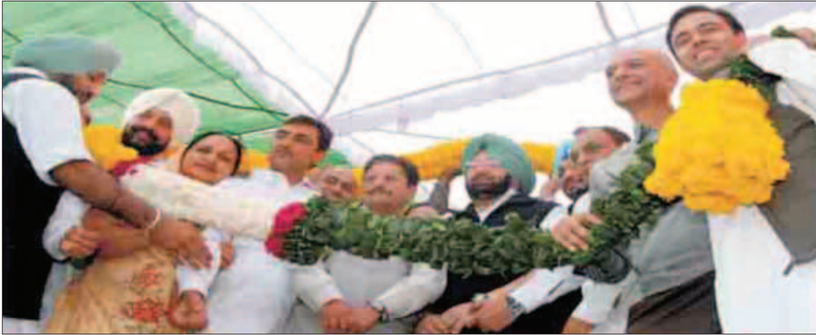
ਨਵਾਂ ਸ਼ਹਿਰ ਵਿਚ ਕਾਂਗਰਸ ਦੀ 'ਪੰਜਾਬ ਬਚਾਓ' ਰੈਲੀ ਵਿਚ ਕੈਪਟਨ ਅਮਰਿੰਦਰ ਸਿੰਘ

ਕੈਪਟਨ ਅਮਰਿੰਦਰ ਸਿੰਘ ਨੇ ਸਪੱਸ਼ਟ ਕੀਤਾ ਹੈ ਕਿ ਪੰਜਾਬ 'ਚ ਵਿਧਾਨ ਸਭਾ ਦੀਆਂ ਚੋਣਾਂ ਜਿੱਤਣ ਮਗਰੋਂ ਪੰਜਾਬ ਦੇ ਮੁੱਖ ਮੰਤਰੀ ਦਾ