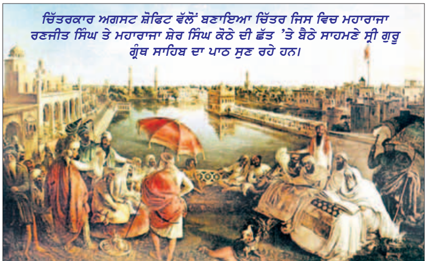
ਚਿੱਤਰਕਾਰ ਅਗਸਟ ਸ਼ੋਫਿਟ ਵੱਲੋਂ ਬਣਾਇਆ ਚਿੱਤਰ ਜਿਸ ਵਿਚ ਮਹਾਰਾਜਾ ਰਣਜੀਤ ਸਿੰਘ ਤੇ ਮਹਾਰਾਜਾ ਸ਼ੇਰ ਸਿੰਘ ਕੋਠੇ ਦੀ ਛੱਤ 'ਤੇ ਬੈਠੇ ਸਾਹਮਣੇ ਸ੍ਰੀ ਗੁਰੂ ਗ੍ਰੰਥ ਸਾਹਿਬ ਦਾ ਪਾਠ ਸੁਣ ਰਹੇ ਹਨ।

ਵਿਲੀਅਮ ਕਾਰਪੇਂਟਰ 1854 ਵਿਚ ਹਰਿਮੰਦਰ ਸਾਹਿਬ ਆਇਆ। ਉਸ ਨੇ ਵੀ ਹਰਿਮੰਦਰ ਸਾਹਿਬ ਦੇ ਅੰਦਰਲੇ ਅਤੇ ਬਾਹਰਲੇ ਚਿੱਤਰ ਜਲ-ਰੰਗ ਨਾਲ ਬਣਾਏ ਜਿਨ੍ਹਾਂ ਵਿਚੋਂ ਦੋ ਚਿੱਤਰ ਬਹੁਤ ਹੀ ਰੌਚਿਕ ਅਤੇ ਉਸ ਸਮੇਂ ਨੂੰ ਦ੍ਰਿਸ਼ਮਾਨ ਕਰਦੇ ਹਨ। ਇਨ੍ਹਾਂ ਵਿਚੋਂ ਇਕ ਚਿੱਤਰ ਬੜਾ ਮਸ਼ਹੂਰ ਹੋਇਆ ਜਿਸ ਨੂੰ ਪੰਜਾਬ ਸਰਕਾਰ ਨੇ 1978 ਵਿਚ ਆਪਣੇ ਸਰਕਾਰੀ ਕੈਲੰਡਰ 'ਤੇ ਛਾਪਿਆ। ਚਿੱਤਰਕਾਰ ਨੇ ਚੜ੍ਹਦੇ ਸੂਰਜ ਵਾਲੇ ਪਾਸਿਓਂ ਪਰਿਕਰਮਾ 'ਤੇ ਖੜ੍ਹ ਕੇ ਸ੍ਰੀ ਹਰਿਮੰਦਰ ਸਾਹਿਬ ਦਾ ਦ੍ਰਿਸ਼ ਚਿੱਤਰਨ ਕੀਤਾ। ਇਸ ਵਿਚ ਕੋਈ ਸਿੱਖ ਰਾਜਾ ਛਤਰ ਹੇਠਾਂ ਪਰਿਕਰਮਾ ਉੱਤੇ ਬੈਠਾ ਪਾਠ ਕਰ ਰਿਹਾ ਹੈ। ਨੇੜੇ ਹੀ ਕੁਝ ਔਰਤਾਂ