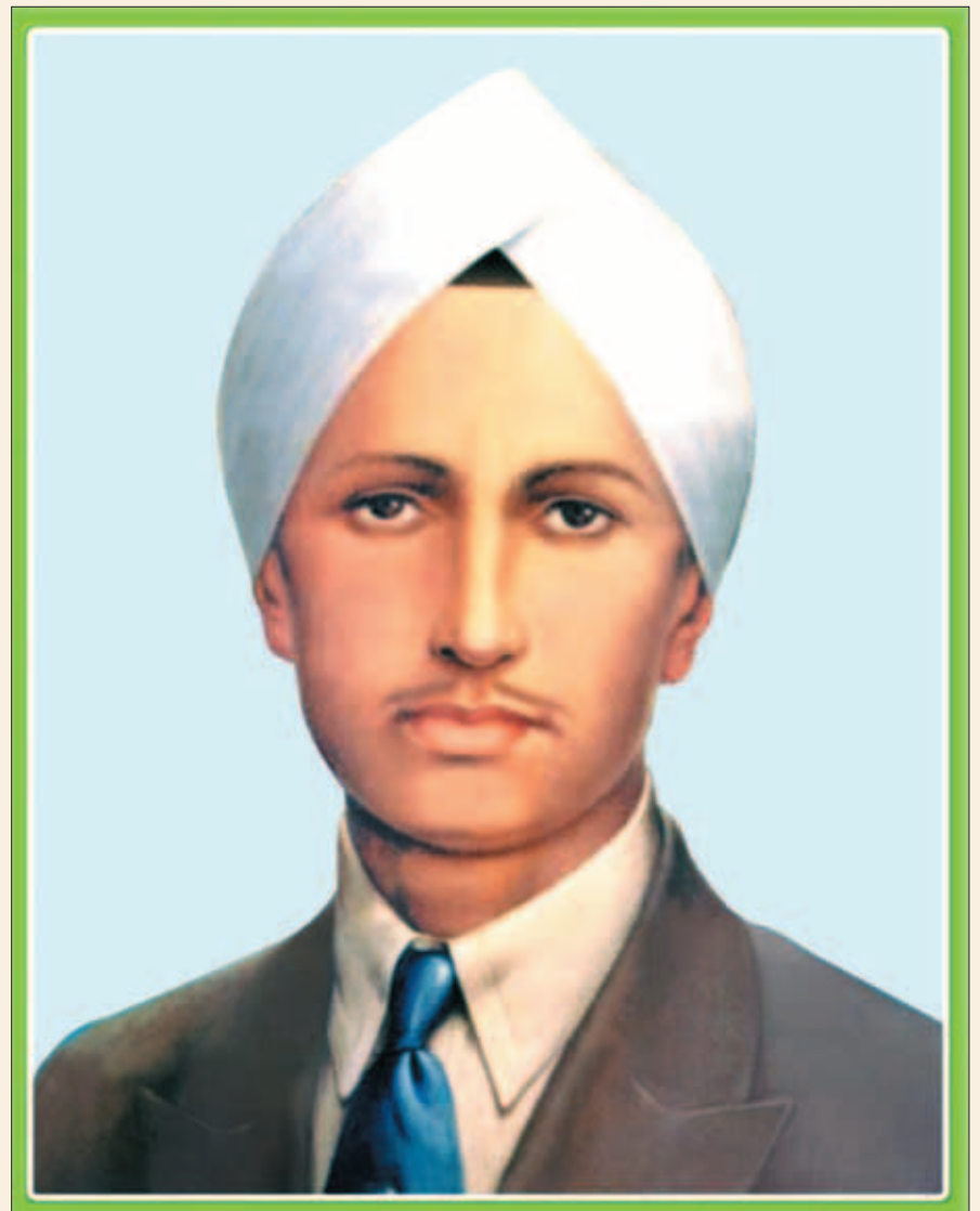
ਸ਼ਹੀਦ ਸਰਦਾਰ ਕਰਤਾਰ ਸਿੰਘ ਸਰਾਭਾ

ਸ਼ਹੀਦ ਸਰਦਾਰ ਕਰਤਾਰ ਸਿੰਘ ਸਰਾਭਾ ਸਪੋਰਟਸ ਕਲੱਬ, ਨਿਊ ਯਾਰਕ ਵਲੋਂ ਸ਼ਹੀਦ ਕਰਤਾਰ ਸਿੰਘ ਦੀ ਸਾਲਾਨਾ ਬਰਸੀ ਉਤੇ ਸਮੂਹ ਸ਼ਹੀਦਾਂ ਦੀ ਯਾਦ ਵਿਚ ਇਕ ਸਮਾਗਮ 25, 26 ਅਤੇ 27 ਨਵੰਬਰ ਨੂੰ ਸਿੱਖ ਸੈਂਟਰ 222-28 ਸਟਰੀਟ, 96 ਐਵਨਿਊ, ਕੁਈਨਜ਼ ਵਿਲੇਜ ਵਿਖੇ ਮਨਾਇਆ ਜਾ ਰਿਹਾ ਹੈ। ਇਸ ਸਬੰਧੀ ਅਖੰਡ ਪਾਠ ਦਾ ਅਰੰਭ ਸ਼ੁੱਕਰਵਾਰ 25 ਨਵੰਬਰ ਨੂੰ ਹੋਵੇਗਾ ਅਤੇ ਭੋਗ ਐਤਵਾਰ 27 ਨਵੰਬਰ 2011 ਨੂੰ ਪੈਣਗੇ। ਉਪਰੰਤ ਪੰਥ ਪ੍ਰਸਿਧ ਰਾਗੀ, ਢਾਡੀ ਜਥੇ ਸੰਗਤਾਂ ਨੂੰ ਸ਼ਬਦ ਕੀਰਤਨ ਅਤੇ ਸ਼ਹੀਦੀ ਵਾਰਾਂ ਨਾਲ ਨਿਹਾਲ ਕਰਨਗੇ। ਸਮੂਹ ਸੰਗਤਾਂ ਅਤੇ ਜਥੇਬੰਦੀਆਂ ਨੂੰ ਬੇਨਤੀ ਹੈ ਕਿ ਸ਼ਹੀਦਾਂ ਨੂੰ ਸ਼ਰਧਾਂਜਲੀ ਭੇਟ ਕਰਨ ਲਈ ਇਸ ਸਮਾਗਮ ਵਿਚ ਸ਼ਾਮਲ ਹੋ ਕੇ ਧੰਨਵਾਦੀ ਬਣਾਓ ਜੀ।