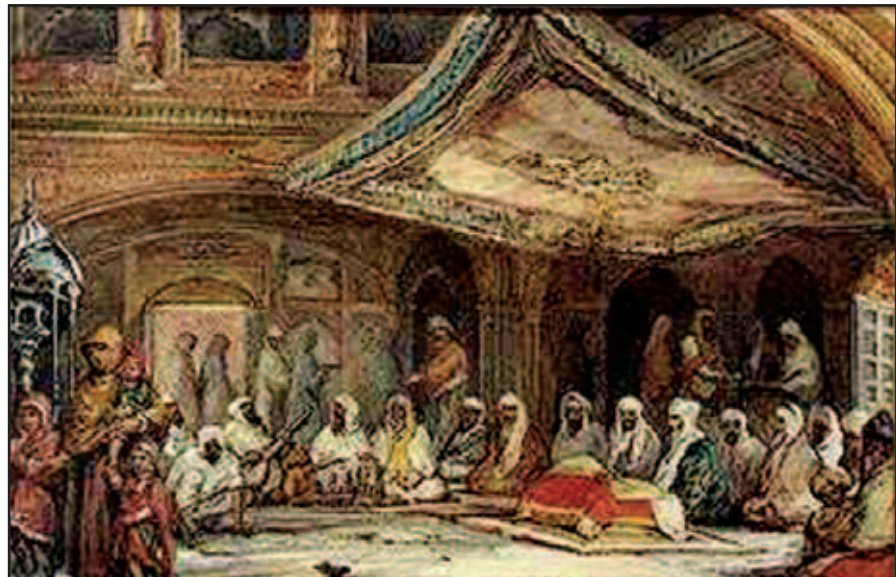
ਸ੍ਰੀ ਹਰਿਮੰਦਰ ਸਾਹਿਬ ਦੇ ਅੰਦਰ ਦਾ ਇੱਕ ਚਿੱਤਰ

ਹਰਿਮੰਦਰ ਸਾਹਿਬ ਦੀ ਉਸਾਰੀ ਗੁਰੂ ਅਰਜਨ ਦੇਵ ਜੀ (1581-1606) ਦੀ ਨਿਗਰਾਨੀ ਹੇਠ ਹੋਈ। ਇਸ ਅਸਥਾਨ ਦੀ ਪੁਨਰ ਉਸਾਰੀ ਦਲ ਖ਼ਾਲਸਾ ਦੇ ਸਰਦਾਰ ਜੱਸਾ ਸਿੰਘ ਆਹਲੂਵਾਲੀਆ ਨੇ ਕਰਵਾਈ। ਇਸ ਮਗਰੋਂ ਮਹਾਰਾਜਾ ਰਣਜੀਤ ਸਿੰਘ ਨੇ ਸੰਨ 1831-35