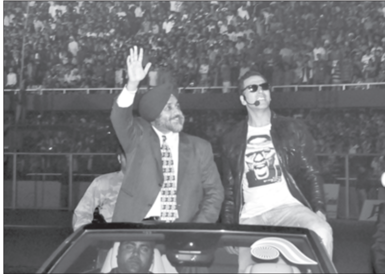
ਸੁਖਬੀਰ ਬਾਦਲ ਅਕਸ਼ੈ ਕੁਮਾਰ ਨਾਲ ਜੀਪ ਦੀ ਸਵਾਰੀ ਕਰਦਿਆਂ

ਭਾਸ਼ਨ ਦਿੰਦੇ। ਉਨ੍ਹਾਂ ਦੀ ਸੁਰ ਉਚੀ ਹੁੰਦੀ ਤੇ ਉਹ ਵਾਰ ਵਾਰ ਕਹਿੰਦੇ, “ਦੋ ਸਾਲ ਪਹਿਲਾਂ ਕਬੱਡੀ ਨੂੰ ਕੋਈ ਪਿੰਡਾਂ ਤੋਂ ਗਾਂਹ ਨਹੀਂ ਸੀ ਜਾਣਦਾ। ਪੰਜਾਬ ਸਰਕਾਰ ਵੱਲੋਂ ਕਬੱਡੀ ਦੇ ਵਿਸ਼ਵ ਕੱਪ ਕਰਾਉਣ ਨਾਲ ਦੋ ਸਾਲਾਂ 'ਚ ਕਬੱਡੀ ਨੂੰ ਸਾਰੀ ਦੁਨੀਆਂ ਜਾਣਨ ਲੱਗ ਪਈ ਹੈ। ਸ਼੍ਰੀਲੰਕਾ, ਨੇਪਾਲ, ਅਫਗਾਨਿਸਤਾਨ ਤੇ ਦੂਰ ਦੁਰਾਡੇ ਦੇ ਅਰਜਨਟੀਨਾ ਵਰਗੇ ਮੁਲਕ ਵੀ ਪੰਜਾਬੀਆਂ ਦੀ