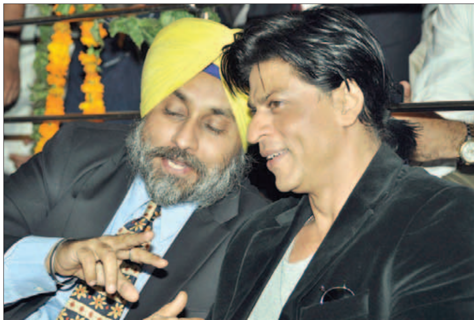
ਸੁਖਬੀਰ ਸਿੰਘ ਬਾਦਲ ਅਤੇ ਐਕਟਰ ਸ਼ਾਹਰੁਖ ਖਾਨ ਵਿਸ਼ਵ ਕਬੱਡੀ ਕੱਪ ਦੇ ਉਦਘਾਟਨੀ ਸਮਾਗਮ ਮੌਕੇ।

ਜਲਵਾ ਦਿਖਾਇਆ। ਬਾਦਲ ਪਰਿਵਾਰ ਨੇ ਉਹਦੇ ਨਾਲ ਰੱਜ ਕੇ ਤਸਵੀਰਾਂ ਖਿੱਚਵਾਈਆਂ। ਸ਼ਾਹਰੁਖ ਨੇ ਜਿੱਥੇ ਪੰਜਾਬੀਆਂ ਦੇ ਜੋਸ਼ ਦੀ ਗੱਲ ਕੀਤੀ, ਉਥੇ ਉਸ ਨੇ ਬਾਦਲ ਪਰਿਵਾਰ ਦੀ ਵਡਿਆਈ ਤੋਂ ਇਲਾਵਾ ਮਾਂ ਖੇਡ ਕਬੱਡੀ ਦੀ ਪ੍ਰਸ਼ੰਸਾ ਵੀ ਕੀਤੀ। ਇਸ ਮੌਕੇ ਗਾਇਕ ਸੁਖਵਿੰਦਰ ਅਤੇ ਸ਼ਾਹਰੁਖ ਖਾਨ ਨੇ 'ਚੱਕ ਦੇ' ਗੀਤ 'ਤੇ ਡਾਂਸ ਵੀ ਕੀਤਾ। ਉਦਘਾਟਨੀ ਸਮਾਗਮ ਦੇ ਆਗਾਜ਼ ਮੌਕੇ ਖੇਡ ਸਟੇਡੀਅਮ ਭਰਿਆ ਹੋਇਆ ਸੀ। ਸਖਤ ਸੁਰੱਖਿਆ ਪ੍ਰਬੰਧਾਂ ਹੇਠ ਹੋਏ ਸਮਾਰੋਹ 'ਚ ਸ਼੍ਰੀਲੰਕਾ ਦੇ ਇਕ ਸੂਬੇ ਦੇ ਮੁੱਖ ਮੰਤਰੀ ਪੁੱਜੇ ਹੋਏ ਸਨ, ਬਾਕੀ ਮੁਲਕਾਂ ਤੋਂ ਕੋਈ ਵੀ ਆਈ.ਪੀ. ਹਾਜ਼ਰ ਨਹੀਂ ਹੋਇਆ। ਸਮਾਰੋਹ ਵਿਚ 15 ਕੌਮਾਂਤਰੀ ਟੀਮਾਂ ਦੇ ਸਵਾ ਦੋ ਸੌ ਖਿਡਾਰੀਆਂ ਨੇ ਸ਼ਮੂਲੀਅਤ ਕੀਤੀ ਜਿਨ੍ਹਾਂ 'ਚ ਭਾਰਤੀ ਕਬੱਡੀ ਟੀਮ ਤੇ ਭਾਰਤ ਦੀ ਲੜਕੀਆਂ