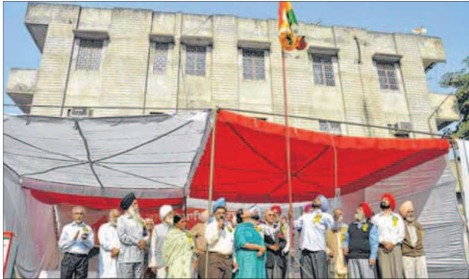
ਗਦਰੀ ਬਾਬਿਆਂ ਦੇ 20ਵੇਂ ਮੇਲੇ 'ਚ ਝੰਡੇ ਦੀ ਰਸਮ ਦਾ ਦ੍ਰਿਸ਼

'ਚ ਜਿਥੇ ਮੁਲਕ ਨੂੰ ਗੁਲਾਮ ਬਣਾਉਣ ਵਾਲੇ ਬਰਤਾਨਵੀ ਮਨਸੂਬਿਆਂ ਨੂੰ ਨੰਗਾ ਕੀਤਾ, ਉਥੇ ਦੇਸ਼ ਦੀ ਰਵਾਇਤੀ ਲੀਡਰਸ਼ਿਪ ਦੇ ਕੌਮੀ ਲਹਿਰ 'ਚ ਯੋਗਦਾਨ ਵਾਲੇ ਸੰਗਰਾਮੀਆਂ ਪ੍ਰਤੀ ਨਾਹਪੱਖੀ ਭੂਮਿਕਾ ਨਿਭਾਉਣ ਦੀ ਤਸਵੀਰ ਨੂੰ ਵੀ