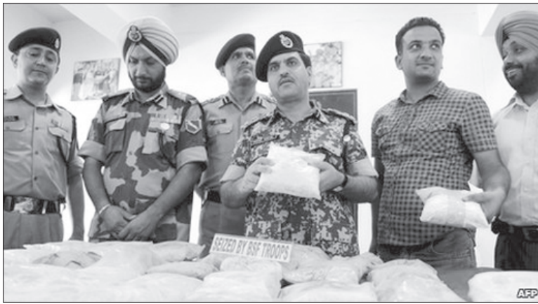
ਬੀ.ਐਸ.ਐਫ ਵੱਲੋਂ ਫੜੀ ਸਮੈਕ ਦਿਖਾ ਰਹੇ ਅਧਿਕਾਰੀ।

ਇਸ ਰਿਪੋਰਟ ਵਿਚ ਪੰਜਾਬ ਤੇ ਭਾਰਤ ਵਿਚ ਨਸ਼ਿਆਂ ਦੇ ਵਧ ਰਹੇ ਸੇਵਨ 'ਤੇ ਗੰਭੀਰ ਚਿੰਤਾ ਪ੍ਰਗਟ ਕੀਤੀ ਗਈ ਹੈ। ਰਿਪੋਰਟ ਮੁਤਾਬਕ ਭਾਰਤ ਵਿੱਚ ਦਸ ਲੱਖ ਹੈਰੋਇਨ ਲੈਣ ਦੇ ਆਦੀ ਰਜਿਸਟਰਡ ਹਨ ਜਦੋਂਕਿ ਹੋਰ ਪੰਜਾਹ ਲੱਖ ਲੋਕ ਇਸ ਦਾ ਸੇਵਨ ਕਰ ਰਹੇ ਹਨ। ਪੰਜਾਬ ਦੇ ਸਰਹੱਦੀ ਖੇਤਰਾਂ ਦੇ 18 ਤੋਂ 26 ਸਾਲ ਦੇ 55 ਫੀਸਦੀ ਨੌਜਵਾਨ ਨਸ਼ੇ ਦੇ ਆਦੀ ਹਨ ਜਦੋਂਕਿ ਰਾਜ ਵਿਚ