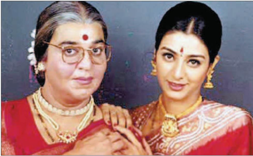
ਫਿਲਮ "ਚਾਚੀ 420" ਵਿਚ ਕਮਲ ਹਾਸਨ ਅਤੇ ਤੱਬੂ