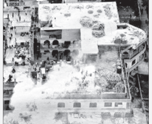
ਸਾਕਾ ਲਾਲ ਮਸਜਿਦ, ਇਸਲਾਮਾਬਾਦ

ਮੈਂ ਇਹ ਜ਼ਰੂਰ ਪੁੱਛਣਾ ਚਾਹੁੰਦਾ ਹਾਂ ਕਿ ਕੀ ਇਹ ਗਾਰੰਟੀ ਹੋ ਸਕਦੀ ਹੈ ਕਿ ਇਕੋ ਮਜ਼ਹਬ ਵਾਲੇ ਮੁਲਕ ਵਿਚ ਇਹ ਸ਼ਿਕਾਇਤਾਂ ਨਹੀਂ ਹੋ ਸਕਦੀਆਂ। ਨੀਲਾ ਤਾਰਾ ਆਪਰੇਸ਼ਨ ਬਹੁਤ ਦੁਖਦਾਈ ਸੀ ਪਰ ਇਸਲਾਮਾਬਾਦ ਵਿਚ ਲਾਲ ਮਸਜਿਦ ਉਪਰ ਪਾਕਿਸਤਾਨੀ ਫੌਜ ਦੀ ਕਾਰਵਾਈ ਵੀ ਘੱਟ ਦੁਖਦਾਈ ਨਹੀਂ।