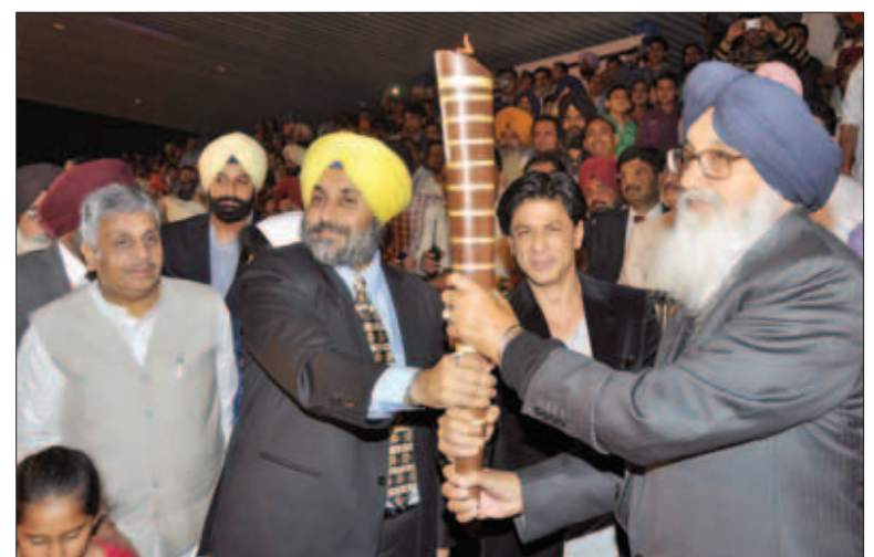
ਵਿਸ਼ਵ ਕਬੱਡੀ ਕੱਪ ਦੇ ਆਗਾਜ਼ ਮੌਕੇ ਮਸ਼ਾਲ ਨਾਲ ਮੁੱਖ ਮੰਤਰੀ ਪ੍ਰਕਾਸ਼ ਸਿੰਘ ਬਾਦਲ, ਉਪ ਮੁੱਖ ਮੰਤਰੀ ਸੁਖਬੀਰ ਬਾਦਲ, ਐਕਟਰ ਸ਼ਾਹਰੁਖ ਖ਼ਾਨ ਅਤੇ ਹੋਰ