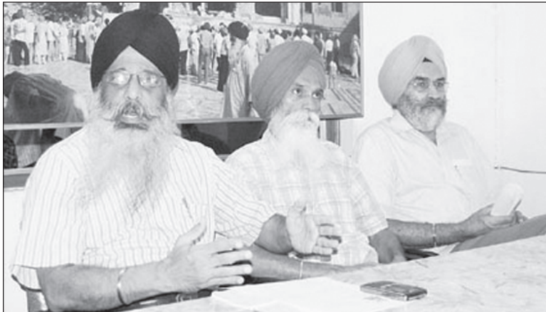
ਪੰਥਕ ਜਥੇਬੰਦੀਆਂ ਵੱਲੋਂ ਬਣਾਈ ਕਮੇਟੀ ਦੇ ਮੈਂਬਰ ਜਾਣਕਾਰੀ ਦਿੰਦੇ ਹੋਏ।

ਅਖਬਾਰਾਂ ਰਾਹੀਂ ਲੋਕਾਂ ਕੋਲੋਂ ਰਾਏ ਮੰਗੀ ਜਾਵੇਗੀ। ਵੱਖ-ਵੱਖ ਸ਼ਹਿਰਾਂ ਵਿਚ ਮੀਟਿੰਗਾਂ ਕੀਤੀਆਂ ਜਾਣਗੀਆਂ, ਦੇਸ਼ ਵਿਦੇਸ਼ ਦੀਆਂ ਸਿੱਖ ਸੰਗਤਾਂ ਤੇ ਗੁਰਦੁਆਰਾ ਕਮੇਟੀਆਂ ਨੂੰ ਇਸ ਬਾਰੇ ਆਪਣੀ ਰਾਏ ਭੇਜਣ ਦੀ ਅਪੀਲ ਕੀਤੀ ਜਾਵੇਗੀ। ਉਨ੍ਹਾਂ ਦੱਸਿਆ ਕਿ ਕਮੇਟੀ ਵੱਲੋਂ ਤਿਆਰ ਕੀਤੀ ਤਜਵੀਜ਼ ਸੰਗਤਾਂ ਦੀ ਰਾਏ ਦੀ ਤਰਜਮਾਨੀ ਕਰਦੀ ਹੋਵੇਗੀ। ਉਨ੍ਹਾਂ ਕਿਹਾ ਕਿ ਚਾਰ ਮੈਂਬਰੀ ਕਮੇਟੀ ਵੱਲੋਂ ਇਹ ਤਜਵੀਜ਼ ਦੇ ਕੇ ਸ਼੍ਰੋਮਣੀ ਕਮੇਟੀ ਦਾ ਕੰਮ ਸੌਖਲਾ ਕੀਤਾ ਜਾ ਰਿਹਾ ਹੈ। ਇਸ ਬਾਰੇ ਉਹ ਸ਼੍ਰੋਮਣੀ ਕਮੇਟੀ ਵੱਲੋਂ ਕਾਇਮ ਪੰਜ ਮੈਂਬਰੀ ਕਮੇਟੀ ਨਾਲ ਵੀ ਸੰਪਰਕ ਕਰਨਗੇ। ਉਨ੍ਹਾਂ ਸਪੱਸ਼ਟ ਕੀਤਾ ਕਿ ਇਹ ਕਮੇਟੀ ਸਿਰਫ ਸਹਿਯੋਗ ਲਈ ਬਣਾਈ ਗਈ ਹੈ ਨਾ ਕਿ ਉਸ ਕਮੇਟੀ ਦੇ ਬਰਾਬਰ ਹੈ। ਉਨ੍ਹਾਂ ਕਿਹਾ ਕਿ ਜੇਕਰ ਸ਼੍ਰੋਮਣੀ ਕਮੇਟੀ ਵੱਲੋਂ ਤਜਵੀਜ਼ 'ਤੇ ਕੋਈ ਕਾਰਵਾਈ ਨਾ ਕੀਤੀ ਗਈ ਤਾਂ ਪੰਥਕ ਜਥੇਬੰਦੀਆਂ ਇਹ ਮਾਮਲਾ ਲੋਕਾਂ ਦੀ ਕਚਹਿਰੀ ਵਿਚ ਲੈ ਕੇ ਜਾਣਗੀਆਂ।