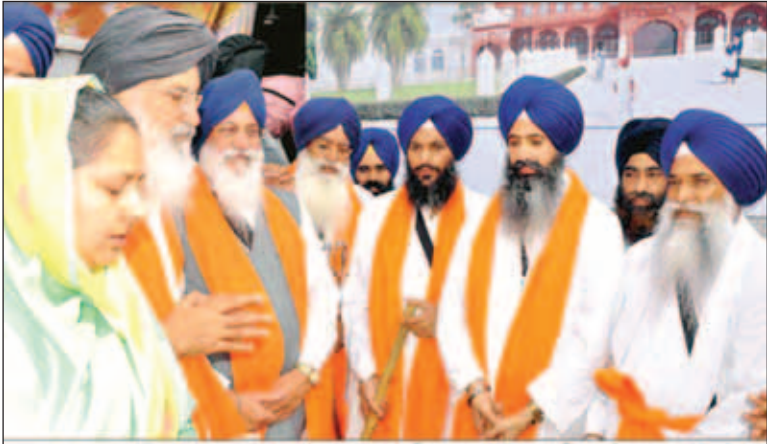
ਲੰਗਰ ਹਾਲ ਦੀ ਨਵੀਂ ਇਮਾਰਤ ਦਾ ਨੀਂਹ ਪੱਥਰ ਰੱਖਦੇ ਹੋਏ ਮੁੱਖ ਮੰਤਰੀ ਪ੍ਰਕਾਸ਼ ਸਿੰਘ ਬਾਦਲ ਅਤੇ ਹੋਰ।