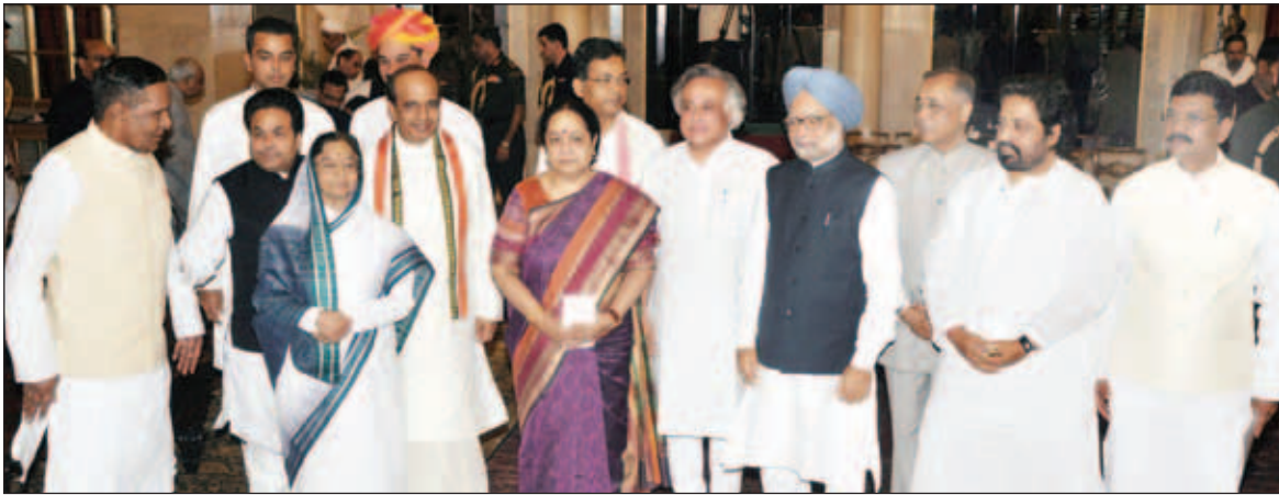
ਪ੍ਰਧਾਨ ਮੰਤਰੀ ਡਾ. ਮਨਮੋਹਨ ਸਿੰਘ ਅਤੇ ਰਾਸ਼ਟਰਪਤੀ ਪ੍ਰਤਿਭਾ ਪਾਟਿਲ ਨਵੇਂ ਮੰਤਰੀਆਂ ਨਾਲ।