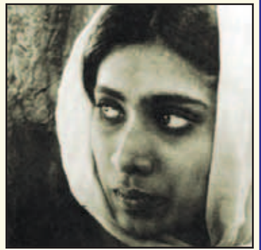
ਫਿਲਮ 'ਉਸਕੀ ਰੋਟੀ' ਦਾ ਦ੍ਰਿਸ਼

ਇਮਦਾਦ ਵੀ ਨਾ ਮਿਲੀ। ਉੱਝ, ਆਪਣੀਆਂ ਫਿਲਮਾਂ ਰਾਹੀਂ ਉਸ ਨੇ ਜੋ ਇਨਕਲਾਬ ਲਿਆਂਦਾ, ਉਹ ਬੇਜੋੜ ਸੀ। ਉਸ ਨੇ ਫਿਲਮ ਦੇ ਸਮੁੱਚੇ ਢਾਂਚੇ, ਬਿਰਤਾਂਤ ਅਤੇ ਪਾਤਰ ਉਸਾਰੀ ਨੂੰ ਮਾਲਾ ਦੇ ਮੋਤੀਆਂ ਵਾਂਗ ਸਭ ਦੇ ਸਾਹਮਣੇ ਖਿਲਾਰ ਦਿੱਤਾ। ਫਿਰ ਇਨ੍ਹਾਂ ਬਿਖਰੇ ਮੋਤੀਆਂ ਵਿੱਚੋਂ ਇਕ-ਇਕ ਮੋਤੀ ਚੁਗ ਕੇ ਫਿਲਮਾਂ ਬਣਾਉਣ ਦਾ ਕੋਤਕ ਕਰ ਕੇ ਦਿਖਾਇਆ। ਉਸ ਨੇ ਹਰ ਦ੍ਰਿਸ਼ ਨੂੰ ਮੁਕੰਮਲ ਦ੍ਰਿਸ਼ ਬਣਾਉਣ ਦਾ ਯਤਨ ਕੀਤਾ। ਉਸ ਦੀ ਹਰ ਫਿਲਮ ਦਾ ਹਰ ਦ੍ਰਿਸ਼ ਆਪਣੇ ਆਪ ਵਿਚ ਮੁਕੰਮਲ ਕਹਾਣੀ ਕਹਿੰਦਾ ਸੀ। ਇਹੀ ਉਸ ਦੀ ਪ੍ਰਾਪਤੀ ਸੀ। ਉਸ ਨੇ ਜਦੋਂ 'ਦੁਰਪਦ' ਬਾਰੇ ਦਸਤਾਵੇਜ਼ੀ ਬਣਾਈ ਤਾਂ ਉਸ ਵਿਚ ਸੰਗੀਤ ਅਤੇ ਇਮਾਰਤਸਾਜ਼ੀ ਦੀ ਬਰਾਬਰੀ ਦਿਖਾ ਕੇ ਸਭ ਨੂੰ ਦੰਗ ਕਰ ਦਿੱਤਾ। ਇਸ ਦਾ ਵੱਡਾ ਕਾਰਨ ਇਹ ਸੀ ਕਿ ਉਹ ਇੱਕਲਾ ਫਿਲਮਸਾਜ਼ ਨਹੀਂ ਸੀ, ਉਹ ਸੰਗੀਤਕਾਰ ਵੀ ਸੀ, ਗਾਇਕ ਵੀ, ਤੇ ਚਿੱਤਰਕਾਰ ਵੀ ਸੀ। ਉਹ ਸਾਰੀਆਂ ਕਲਾਵਾਂ ਜਦੋਂ ਸੰਗਮ ਦਾ ਰੂਪ ਧਾਰਦੀਆਂ ਸਨ ਤਾਂ ਉਹ ਜਲੌਐ ਪੈਦਾ ਕਰਦੀਆਂ ਸਨ ਜੋ ਸਭ ਨੂੰ ਖਿੰਚਦਾ ਸੀ।