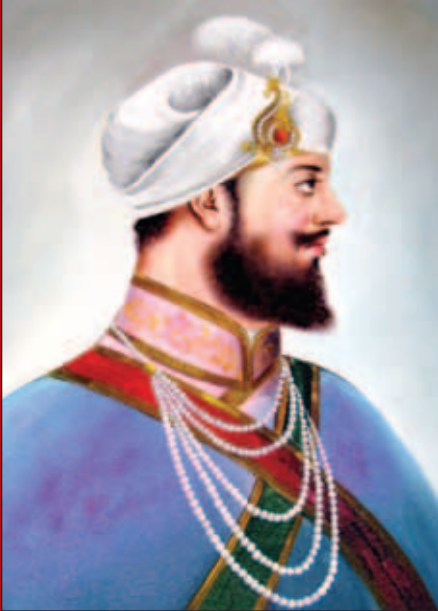
ਛੇਵੇਂ ਪਾਤਸ਼ਾਹ ਸ੍ਰੀ ਗੁਰੂ ਹਰਗੋਬਿੰਦ ਸਾਹਿਬ

3500 ਬਰੁਕਸਾਈਡ ਪਾਰਕ (ਇੰਡੀਅਨਾਪੋਲਿਸ) ਦੇ ਖੁੱਲ੍ਹੇ ਮੈਦਾਨਾਂ ਵਿਚ