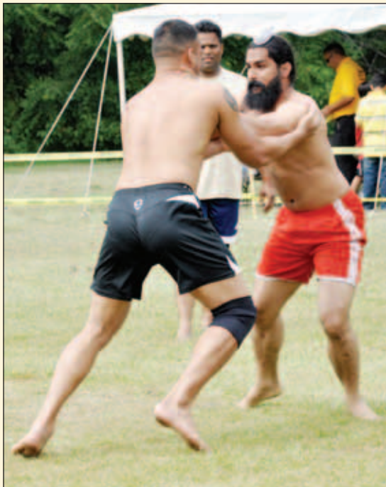
ਟੂਰਨਾਮੈਂਟ ਵਿਚ ਨਾਮੀ ਕਬੱਡੀ ਖਿਡਾਰੀ ਆਪਣੀ ਖੇਡ ਦੇ ਜੌਹਰ ਵਿਖਾਉਣਗੇ