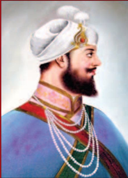
ਫੇਵੇਂ ਪਾਤਸ਼ਾਹ ਸ੍ਰੀ ਗੁਰੂ ਹਰਗੋਬਿੰਦ ਸਾਹਿਬ

3500 ਬਰੁਕਸਾਈਡ ਪਾਰਕ (ਇੰਡੀਅਨਾਪੋਲਿਸ) ਦੇ ਖੁੱਲ੍ਹੇ ਮੈਦਾਨਾਂ ਵਿਚ