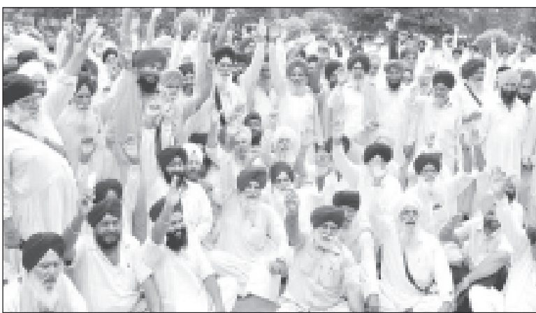
ਕਰਨਾਲ ਵਿਖੇ ਹਰਿਆਣਾ ਦੇ ਸਿੱਖ ਵੱਖਰੀ ਕਮੇਟੀ ਲਈ ਰੋਸ ਪ੍ਰਗਟਾਉਂਦੇ ਹੋਏ।

ਇਸ ਦੇ ਇਲਾਵਾ ਸਰਕਾਰ ਤੋਂ ਮੰਗ ਕੀਤੀ ਗਈ ਹੈ ਕਿ ਹੋਮਕੁੰਟ ਸਾਹਿਬ ਨੂੰ ਰਾਜ ਦਾ ਪੰਜਵਾਂ ਧਾਮ ਘੋਸ਼ਣ ਕੀਤਾ ਜਾਵੇ ਜਿਥੇ ਹਰ ਸਾਲ ਲੱਖਾਂ ਦੀ ਗਿਣਤੀ ਵਿਚ ਯਾਤਰੂ ਪੁੱਜਦੇ ਹਨ ਤੇ 4 ਧਾਮਾਂ ਦੇ ਰੂਟ 'ਤੇ ਦਿੱਤੀਆਂ ਜਾ ਰਹੀਆਂ ਸਹੂਲਤਾਂ ਦੀ ਤਰ੍ਹਾਂ ਹੋਮਕੁੰਟ ਦੇ ਯਾਤਰੂਆਂ ਨੂੰ ਵੀ ਮਦਦ ਦਿੱਤੀ ਜਾਵੇ। ਉਤਰਾਖੰਡ ਵਿਚ ਪੰਜਾਬੀਆਂ ਦੀ ਵੱਡੀ ਗਿਣਤੀ ਨੂੰ ਵੇਖਦਿਆਂ ਰਾਜ ਵਿਚ ਪੰਜਾਬੀ ਨੂੰ ਦੂਜੀ ਭਾਸ਼ਾ ਦਾ ਸਨਮਾਨ ਦਿੱਤਾ ਜਾਵੇ। ਸ. ਝੀਂਡਾ ਦਾ ਕਹਿਣਾ ਸੀ ਕਿ ਸੂਬਾ ਸਰਕਾਰ ਪੰਜਾਬੀਆਂ ਦੀ