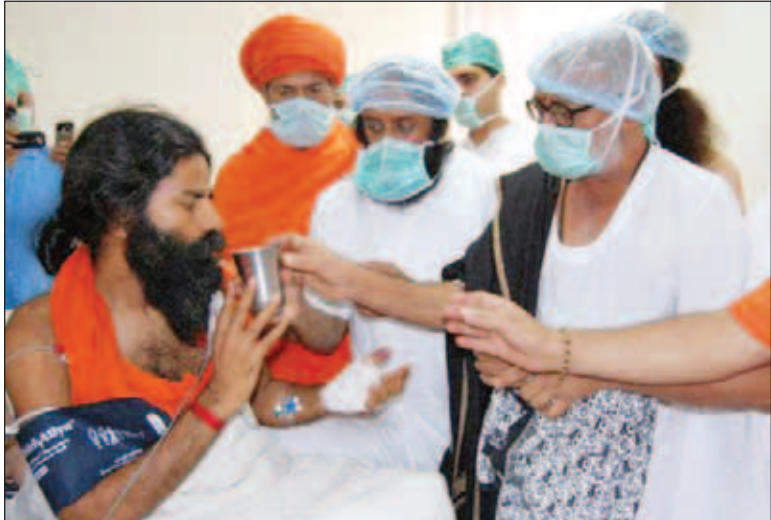
ਬਾਬਾ ਰਾਮਦੇਵ ਨੂੰ ਜੂਸ ਪਿਲਾ ਕੇ ਮਰਨ ਵਰਤ ਤੁੜਾ ਰਹੇ ਰਵੀ ਸ਼ੰਕਰ

ਤੋਂ ਵੀ ਟਾਲਾ ਵੱਟ ਗਏ। ਇਸ ਮੌਕੇ ਉਨ੍ਹਾਂ ਸਵਾਮੀ ਨਿਗਮਾਨੰਦ ਨੂੰ ਸ਼ਰਧਾਂਜਲੀ ਭੇਟ ਕੀਤੀ ਜੋ ਢਾਈ ਮਹੀਨੇ ਦੀ ਭੁੱਖ ਹੜਤਾਲ ਤੋਂ ਬਾਅਦ ਮੰਗਲਵਾਰ ਨੂੰ ਹਸਪਤਾਲ ਵਿਚ ਫੌਤ ਹੋ ਗਏ। ਉਹ ਗੰਗਾ ਦੀ ਸਫਾਈ ਲਈ ਮੁਹਿੰਮ ਚਲਾ ਰਹੇ ਸਨ। ਬਾਬਾ ਰਾਮਦੇਵ ਦੀ ਹਾਲਤ ਮਰਨ ਵਰਤ ਦੇ