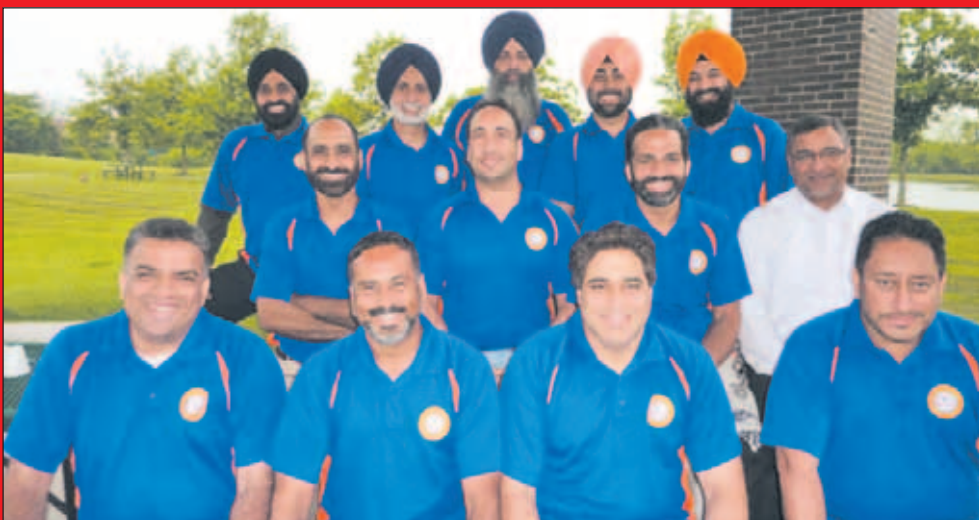
PSCA ਵਲੋਂ ਸਾਰੇ ਹੀ ਵਾਲੰਟੀਅਰਾਂ, ਮੈਂਬਰਾਂ ਤੇ ਸਹਿਯੋਗੀ ਸੱਜਣਾਂ ਦਾ ਬਹੁਤ ਬਹੁਤ ਧੰਨਵਾਦ

ਸਭਿਆਚਾਰਕ ਪ੍ਰੋਗਰਾਮ ਅਤੇ ਗਿੱਧਾ-ਭੰਗੜਾ ਵੀ ਹੋਵੇਗਾ।