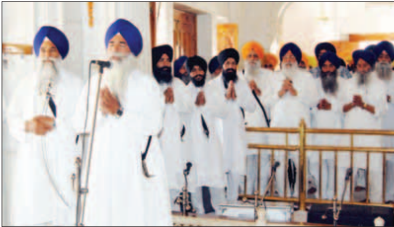
ਅੰਮ੍ਰਿਤਸਰ ਵਿਚ ਸ੍ਰੀ ਅਕਾਲ ਤਖਤ ਸਾਹਿਬ ਵਿਖੇ ਪ੍ਰੋ. ਦਵਿੰਦਰਪਾਲ ਸਿੰਘ ਭੁੱਲਰ ਦੀ ਸਲਾਮਤੀ ਲਈ ਕੀਤੀ ਜਾ ਰਹੀ ਅਰਦਾਸ ਦਾ ਦ੍ਰਿਸ਼।