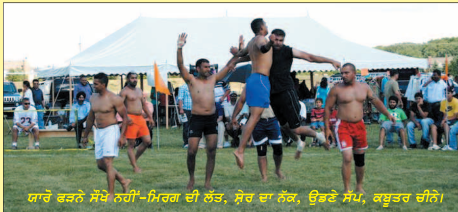
ਯਾਰੋ ਫੜਨੇ ਸੌਖੇ ਨਹੀਂ-ਮਿਰਗ ਦੀ ਲੱਤ, ਸ਼ੇਰ ਦਾ ਨੱਕ, ਉਡਣੇ ਸੱਪ, ਕਬੂਤਰ ਚੀਨੇ।

ਪਹਿਲਾ ਇਨਾਮ-2100 ਡਾਲਰ ਦੂਜਾ ਇਨਾਮ-1100 ਡਾਲਰ