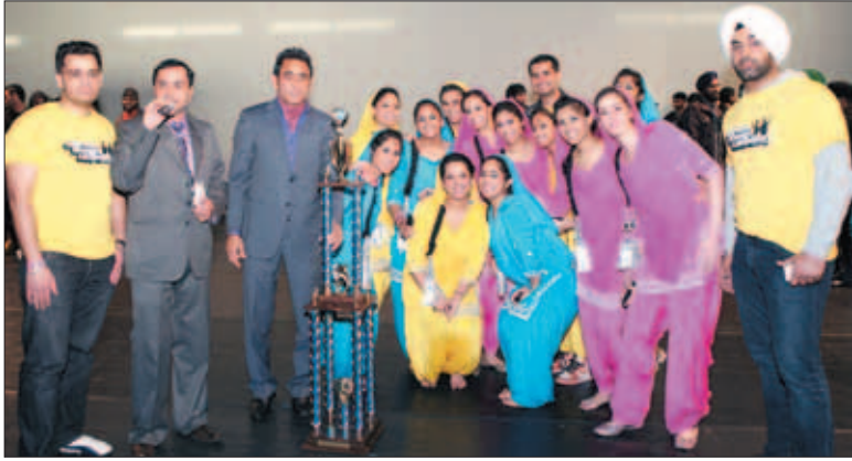
ਪਹਿਲੇ ਥਾਂ ਆਉਣ ਵਾਲੀ ਵਾਸ਼ਿੰਗਟਨ ਦੀ ਟੀਮ

ਇਨ੍ਹਾਂ ਭੰਗੜਾ ਮੁਕਾਬਲਿਆਂ ਦਾ ਪ੍ਰਬੰਧ ਅਮਰੀਕਾ-ਕੈਨੇਡਾ ਦੀਆਂ ਅਨੇਕਾਂ ਕਾਰਪੋਰੇਟ