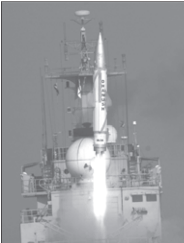
ਬੰਗਾਲ ਦੀ ਖਾੜੀ 'ਚ ਜਲ ਸੈਨਾ ਦੇ ਜਹਾਜ਼

ਨਵੀਂ ਦਿੱਲੀ/ਪਿਸ਼ਾਵਰ : ਕੌਮਾਂਤਰੀ ਪੱਧਰ 'ਤੇ ਆਪਣੀ ਤਾਕਤ ਦਾ ਪ੍ਰਦਰਸ਼ਨ ਕਰਨ ਲਈ ਭਾਰਤ ਤੇ ਪਾਕਿਸਤਾਨ ਨੇ ਪਰਮਾਣੂ ਸਮੱਗਰੀ ਲਿਜਾਣ ਦੀ ਸਮਰੱਥਾ ਰੱਖਣ ਵਾਲੀਆਂ ਮਿਸਾਈਲਾਂ ਦੀ ਸਫਲ ਅਜ਼ਮਾਇਸ਼ ਕੀਤੀ। ਭਾਰਤ ਨੇ 11 ਮਾਰਚ ਨੂੰ ਦੇਸ਼ 'ਚ ਹੀ ਤਿਆਰ ਕੀਤੀਆਂ ਦੋ ਪਰਮਾਣੂ ਸਮਰੱਥ ਬਾਲਿਸਟਿਕ ਮਿਸਾਈਲਾਂ ਤੋਂ ਸਫਲਤਾਪੂਰਵਕ ਤਜਰਬੇ ਕੀਤੇ। ਦੂਜੇ ਪਾਸੇ ਉਸੇ ਦਿਨ ਪਾਕਿਸਤਾਨ ਨੇ ਵੀ ਧਰਤੀ ਤੋਂ ਧਰਤੀ ਤੱਕ ਮਾਰ ਕਰ ਸਕਣ ਵਾਲੀ ਬੋਤੀ ਰੇਂਜ ਦੀ ਪ੍ਰਮਾਣੂ ਸਮਗਰੀ ਮਿਸਾਈਲ ਹਤਫ-99 ਜਾਂ ਅਬਦਾਲੀ ਮਿਸਾਈਲ 'ਤੇ ਸਫਲ ਤਜਰਬਾ ਕੀਤਾ ਹੈ। ਦੋਵੇਂ ਤਜਰਬੇ ਵੱਖ-ਵੱਖ ਥਾਵਾਂ ਤੋਂ ਕੀਤੇ ਗਏ।