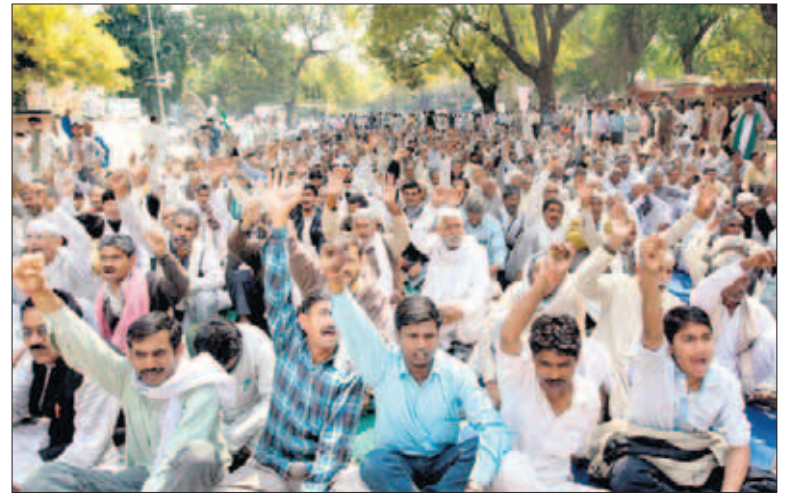
ਰਾਖਵਾਂਕਰਨ ਦੀ ਮੰਗ ਕਰ ਰਹੇ ਜਾਟ

ਜਲੰਧਰ: ਹਰਿਆਣਾ ਤੇ ਉੱਤਰ ਪ੍ਰਦੇਸ਼ 'ਚ ਜਾਟ ਰਾਖਵਾਂਕਰਨ ਦੀ ਮੰਗ ਨੂੰ ਲੈ ਕੇ ਚੱਲ ਰਹੇ ਅੰਦੋਲਨ ਦੇ ਸਮਰਥਨ ਦਾ ਐਲਾਨ ਕਰਦਿਆਂ ਜੱਟ ਸਿੱਖ ਸਭਾ ਨੇ ਮੰਗ ਕੀਤੀ ਕਿ ਪੰਜਾਬ ਸਰਕਾਰ ਵੀ ਆਰਥਿਕ ਪੱਖੋਂ ਕਮਜ਼ੋਰ ਜੱਟ ਸਿੱਖਾਂ