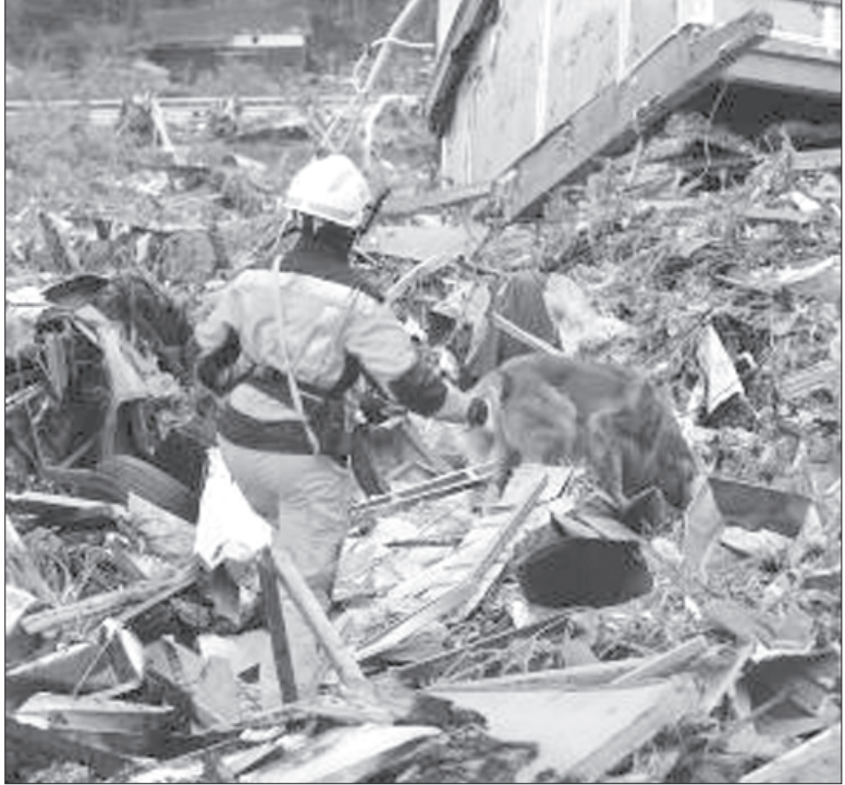
ਭੂਚਾਲ ਦੀ ਮਚਾਈ ਤਬਾਹੀ