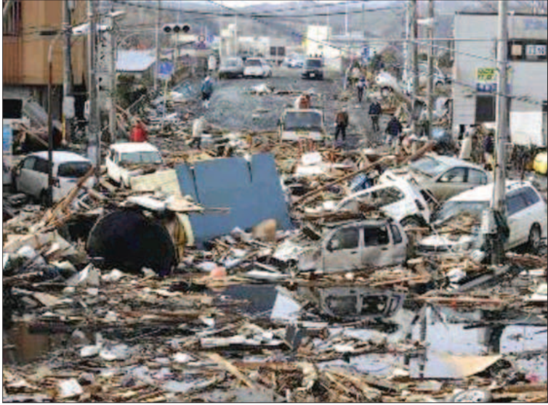
ਸੁਨਾਮੀ ਲਹਿਰਾਂ ਵਲੋਂ 'ਕੱਠਾ ਕੀਤਾ ਗਿਆ ਘਰਾਂ ਅਤੇ ਕਾਰਾਂ ਦਾ ਮਲਬਾ