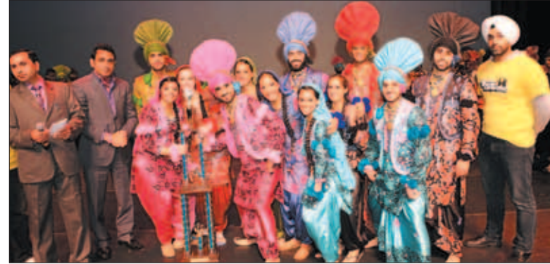
ਤੀਜੇ ਸਥਾਨ ‘ਤੇ ਰਹੀ ਵਲਵਰੀਨ ਭੰਗੜਾ, ਮਿਸ਼ੀਗਨ ਦੀ ਟੀਮ