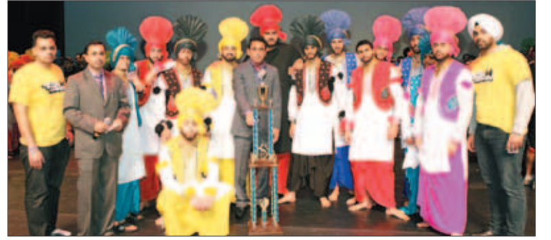
ਦੂਜੇ ਸਥਾਨ ‘ਤੇ ਆਈ ਟੋਰਾਂਟੋ, ਕੈਨੇਡਾ ਦੀ ਟੀਮ