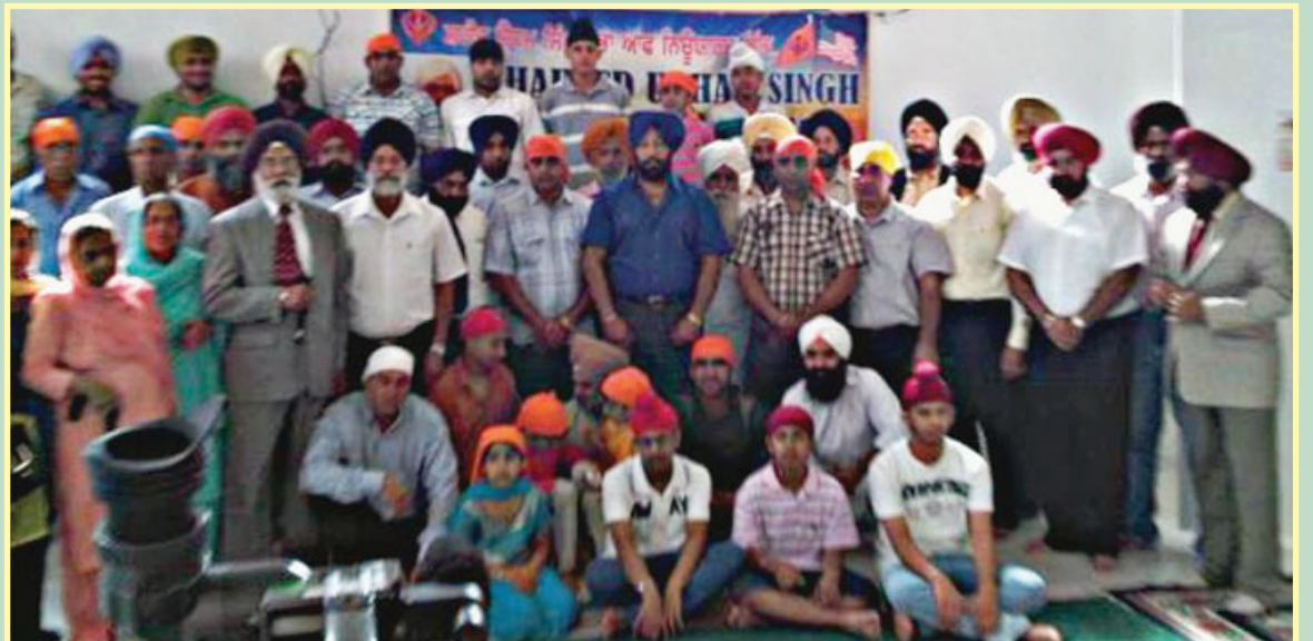
ਸ਼ਹੀਦ ਉਧਮ ਸਿੰਘ ਸਭਾ, ਨਿਊ ਯਾਰਕ ਦੇ ਅਹੁਦੇਦਾਰ ਅਤੇ ਮੈਂਬਰ

ਵਲੋਂ: ਸ਼ਹੀਦ ਉਧਮ ਸਿੰਘ ਸਭਾ, ਨਿਊ ਯਾਰਕ (ਇੰਕ)