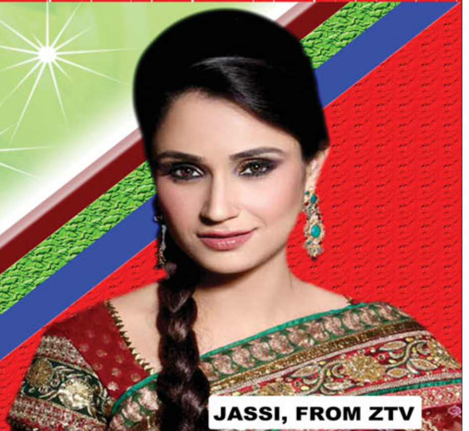
JASSI, FROM ZTV