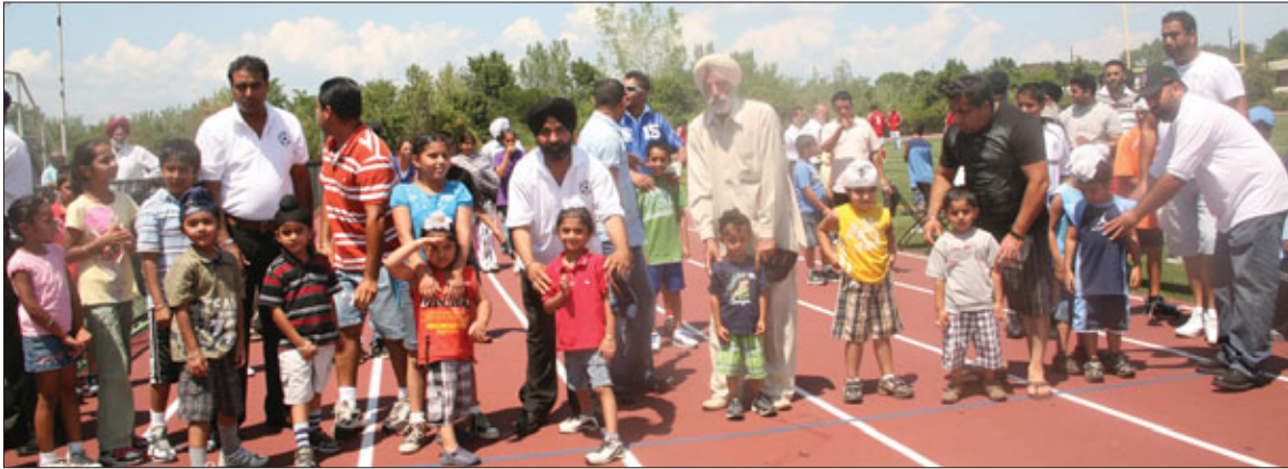
ਨਿਉ ਯਾਰਕ ਵਿਚ ਸੰਤ ਬਾਬਾ ਨਿਧਾਨ ਸਿੰਘ ਦੀ ਯਾਦ ਵਿਚ ਕਰਵਾਏ ਗਏ ਖੇਡ ਮੇਲੇ ਦੌਰਾਨ ਦੌੜ ਲਾਉਣ ਲਈ ਤਿਆਰ ਹੋ ਰਹੇ ਬੱਚੇ ਅਤੇ ਹੋਠਾਂ ਮੇਲੇ ਵਿਚ ਹਿੱਸਾ ਲੈਣ ਵਾਲੇ ਖਿਡਾਰੀਆਂ ਨਾਲ ਪ੍ਰਬੰਧਕ