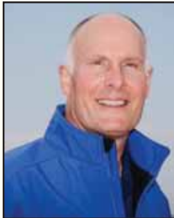
ਜੌਹਨ ਮੂਲੇਨਾਰ (ਕਾਂਗਰਸਮੈਨ)