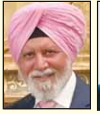
ਡਾ ਰਸ਼ਪਾਲ ਬਾਜਵਾ