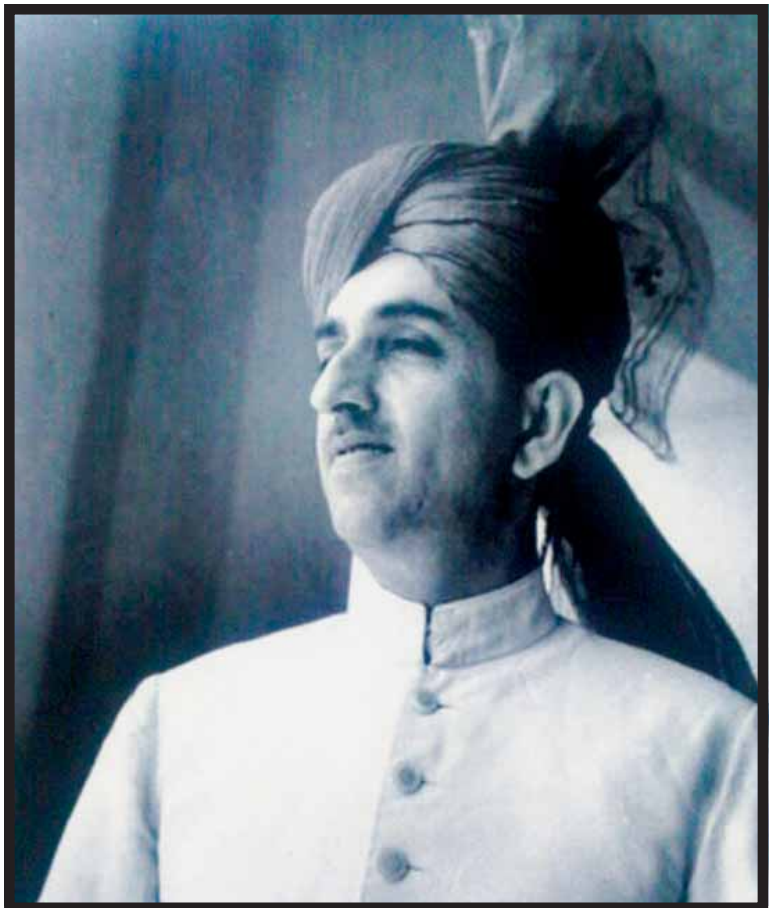
ਖ਼ਿਜ਼ਰ ਹਯਾਤ ਟਿਵਾਣਾ

1942 ਵਿਚ ਪੰਜਾਬ ਦੇ ਪ੍ਰਧਾਨ ਮੰਤਰੀ ਸਿਕੰਦਰ ਹਯਾਤ ਖਾਨ ਦੀ 50 ਸਾਲਾਂ ਦੀ ਉਮਰ ਵਿਚ ਮੌਤ ਹੋ ਗਈ ਸੀ। 1942 ਵਿਚ ਭਾਰਤ ਦੇ ਸਿਆਸੀ ਹਾਲਾਤ ਨਾਸਾਜ਼ ਸਨ। ਮਾਰਚ 1942 ਵਿਚ ਹੀ ਭਾਰਤ ਵਿਚ ਕ੍ਰਿਪਸ ਮਿਸ਼ਨ ਆਇਆ ਸੀ, ਕਾਂਗਰਸ ਨੇ ਇਸ ਦੇ ਵਿਰੋਧ ਵਿਚ ‘ਭਾਰਤ ਛੱਡੋ’ ਲਹਿਰ ਵਿੱਢੀ ਸੀ। ਸਿਕੰਦਰ ਹਯਾਤ ਖਾਨ ਹਾਲਾਂਕਿ ਜੰਗ ਵਿਚ ਹਿੰਸੇਦਾਰੀ ਪਾਉਣ ਦਾ