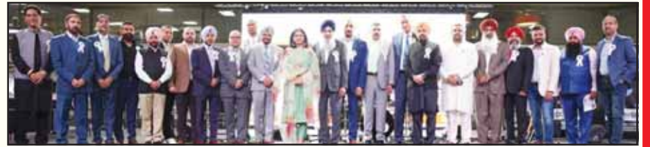
ਪੀ ਸੀ ਐੱਸ ਆਫ ਮਿਸ਼ੀਗਨ