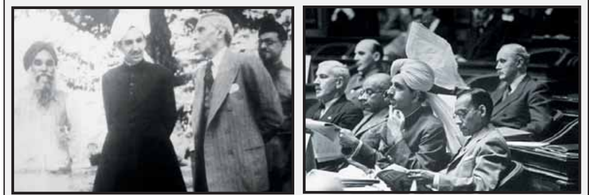
ਖ਼ਿਜ਼ਰ ਹਯਾਤ ਟਿਵਾਣਾ (ਵਿਚਕਾਰ) ਮਾਸਟਰ ਤਾਰਾ ਸਿੰਘ ਤੇ ਮੁਹੰਮਦ ਅਲੀ ਜਿਨਾਹ ਅਤੇ (ਸੱਜੇ) ਪੰਜਾਬ ਆਸੈਂਬਲੀ ਵਿਚ।