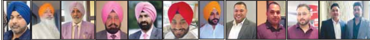
ਪੀ ਸੀ ਐੱਸ ਆਫ ਸਾਊਥਬੈਂਡ ਇੰਡੀਆਨਾ