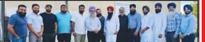
ਸੰਤ ਬਾਬਾ ਪ੍ਰੇਮ ਸਿੰਘ ਜੀ ਸਪੋਰਟਸ ਕਲੱਬ, ਸਾਊਥਬੈਂਡ ਇੰਡੀਆਨਾ