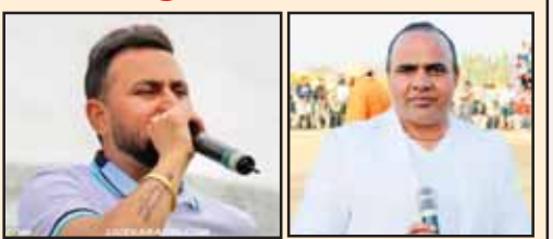
ਕਾਲਾ ਰਸ਼ੀਨ ਮੱਖਣ ਅਲੀ