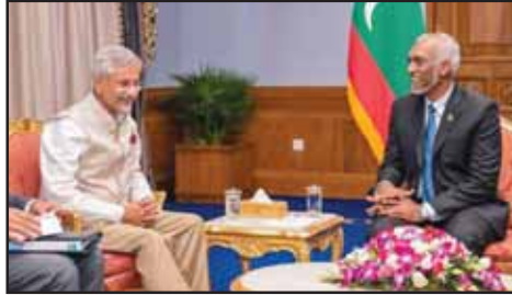
ਵਿਦੇਸ਼ ਮੰਤਰੀ ਐਸ ਜੈਸ਼ੰਕਰ ਮਾਲਦੀਵ ਦੇ ਰਾਸ਼ਟਰਪਤੀ ਡਾ. ਮੁਹੰਮਦ ਮੁੱਈਜ਼ ਨਾਲ ਗੱਲਬਾਤ ਕਰਦੇ ਹੋਏ।

ਕੰਢੇ ਵਾਲੇ ਅੰਬਾਂ ਦੇ ਰੁੱਖਾਂ ਤੋਂ ਹਨੇਰੀ ਨਾਲ ਝੜੇ ਅੰਬ ਚੁੱਕਿਆ ਕਰਦੇ ਸਨ। ਮੈਨੂੰ ਇਹ ਜਾਣ ਕੇ ਵਿਸ਼ੇਸ਼ ਪ੍ਰਸੰਨਤਾ ਹੋਈ ਕਿ ਭਾਰਤ ਨੇ ਪਿਛਲੇ ਕੁਝ ਸਾਲਾਂ ਵਿਚ ਮਾਲਦੀਵ ਲਈ 22 ਕਰੋੜ ਅਮਰੀਕਨ ਡਾਲਰ ਦਾ ਨਿਵੇਸ਼ ਕੀਤਾ ਹੈ। ਵਿਦੇਸ਼ ਮੰਤਰੀ ਦੇ ਇਹ ਵੀ ਕਿਹਾ ਕਿ ਭਾਰਤ ਉਥੇ ਸੈਰ ਸਪਾਟੇ ਦੇ ਵਸੀਲੇ ਪੈਦਾ ਕਰਨ ਲਈ ਵਧੇਰੇ ਨਿਵੇਸ਼ ਦਾ ਰਾਹ ਲਭ ਰਿਹਾ ਹੈ। ਮਾਲਦੀਵ ਸਮੁੰਦਰ ਦੀ ਸਤਾਹ ਤੋਂ ਕੇਵਲ ਅੱਠ ਫੁੱਟ ਉੱਚਾ ਹੈ ਪਰ ਇਸਨੇ