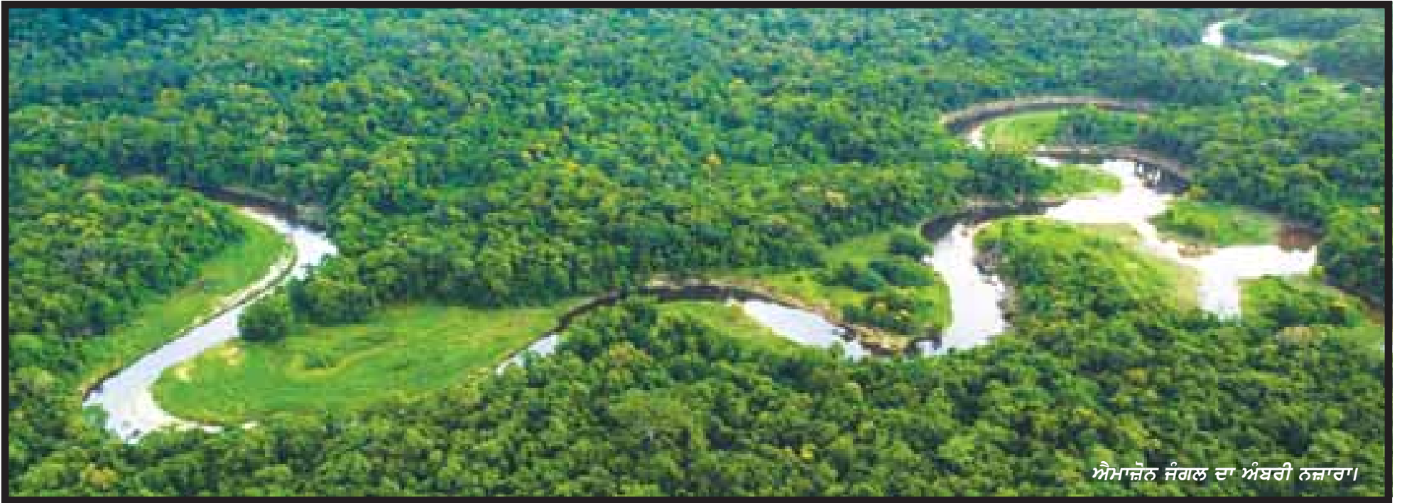
ਐਮਾਜ਼ੋਨ ਜੰਗਲ ਦਾ ਅੰਬਰੀ ਨਜ਼ਾਰਾ।

ਪਾਣੀ ਸਾਡੀ ਸਮਾਜਿਕ, ਆਰਥਿਕ ਤੇ ਸਿਆਸੀ ਸ਼ਕਤੀ ਹੈ। 2030 ਤੱਕ ਜਿਹੜੇ 33 ਮੁਲਕ ਗੰਭੀਰ ਜਲ ਸੰਕਟ ਦੇ ਸ਼ਿਕਾਰ ਹੋ ਜਾਣਗੇ, ਭਾਰਤ ਉਨ੍ਹਾਂ ਵਿਚੋਂ ਇੱਕ ਹੈ। ਭਾਰਤ ਦੇ ਜਿਹਨਾਂ 13 ਰਾਜਾਂ ਵਿਚ ਗੰਭੀਰ ਜਲ ਸੰਕਟ ਪੈਦਾ ਹੋ ਰਿਹਾ ਹੈ, ਪੰਜਾਬ ਉਨ੍ਹਾਂ ਵਿਚ ਇੱਕ ਹੈ। ਮੁਲਕ ਦੇ ਜਿਹੜੇ 258 ਜ਼ਿਲ੍ਹਿਆਂ ਵਿਚ ਗੰਭੀਰ ਜਲ ਸੰਕਟ ਬਣ ਰਿਹਾ ਹੈ, ਪੰਜਾਬ ਦੇ 17 ਜ਼ਿਲ੍ਹੇ ਉਨ੍ਹਾਂ ਵਿਚ ਸ਼ੁਮਾਰ ਹਨ। ਜੇ ਅਸੀਂ ਨਾ ਸੰਭਾਲ ਅਤੇ ਜ਼ਮੀਨ ਹੇਠਲੇ ਪਾਣੀ ਦੀ ਮੁੜ ਤੇ ਲਗਾਤਾਰ ਭਰਪਾਈ ਨਾ ਕੀਤੀ, ਤਦ ਪੰਜਾਬ ਦੇ ਜ਼ਮੀਨਦੇਜ਼ ਪਾਣੀ ਦੀ ਸਤਹਿ 2039 ਵਿਚ 300 ਮੀਟਰ (984 ਫੁੱਟ) 'ਤੇ ਪੁੱਜ ਜਾਵੇਗੀ ਜਿਹੜੀ ਪਹਿਲਾਂ ਹੀ ਕਰੀਬ 80 ਸੈਂਟੀਮੀਟਰ ਪ੍ਰਤੀ ਸਾਲ ਦੇ ਹਿਸਾਬ ਨਾਲ ਥੱਲੇ ਡਿੱਗ ਰਹੀ ਹੈ।