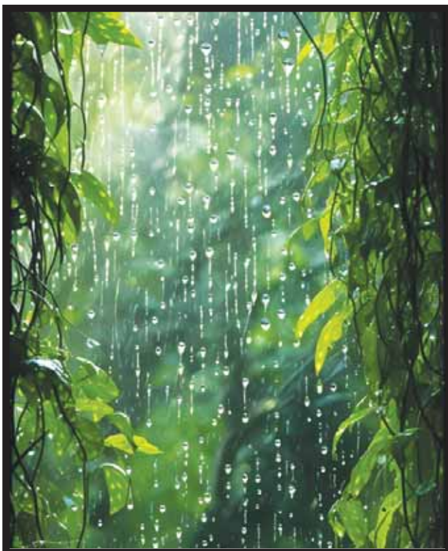
ਰੁੱਖਾਂ ਉੱਤੇ ਵਰ੍ਹ ਰਹੇ ਮੀਂਹ ਦਾ ਨਜ਼ਾਰਾ।

ਵਰਖਾ ਦੀ ਹਰ ਟਿੱਪ ਕਮਾਉਣੀ ਜਲ ਸੰਕਟ ਦਾ 'ਰਾਮ ਬਾਣ' ਹੈ। ਮੁਹਿੰਮ ਜੋ ਤੁਰੰਤ ਵਿੱਢਣ ਦੀ ਲੋੜ ਹੈ, ਉਹ ਹੈ: ਖੇਤ ਦਾ ਪਾਣੀ ਖੇਤ 'ਚ, ਖੇਤ ਦੀ ਮਿੱਟੀ ਖੇਤ 'ਚ; ਪਿੰਡ ਦੀ ਮਿੱਟੀ ਪਿੰਡ 'ਚ, ਪਿੰਡ ਦਾ ਪਾਣੀ ਪਿੰਡ 'ਚ। ਇਹ ਨਾਅਰਾ ਡੂੰਘੇ ਅਰਥ ਸਮੋਈ ਬੈਠਾ ਹੈ। ਵਰਖਾ ਦਾ ਤਵਾਜ਼ਨ ਭਾਵੇਂ ਗਤਬਤਾ ਗਿਆ ਹੈ ਪਰ ਇਹ ਜਿੰਨੀ, ਜਿਥੇ ਅਤੇ ਜਿਸ ਵੀ ਰੂਪ ਵਿਚ ਪੈਂਦੀ ਹੈ, ਨੂੰ ਕਮਾਉਣ/ਸੰਭਾਲਣ ਅਤੇ ਧਰਤੀ ਵਿਚ ਸੰਚਾਰ ਕਰਾਉਣ ਤੋਂ ਬਿਨਾਂ ਕੋਈ ਚਾਰਾ ਨਹੀਂ। ਜਲ ਸੋਮਿਆਂ ਨੂੰ ਜਿੰਦਾ ਰੱਖਣ ਦਾ ਸਦੀਵੀ ਹੱਲ ਇਹੀ ਹੈ।