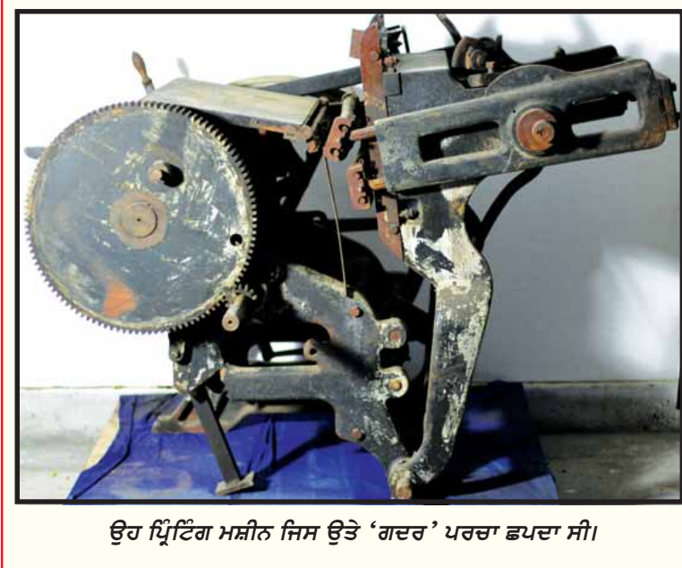
ਉਹ ਪ੍ਰਿੰਟਿੰਗ ਮਸ਼ੀਨ ਜਿਸ ਉਤੇ 'ਗਦਰ' ਪਰਚਾ ਛਪਦਾ ਸੀ।

ਦੇ ਦੇਸ਼ ਭਗਤਾਂ ਨੇ ਵੀ ਆਪਣੀ ਗਦਰੀ ਤਹਿਰੀਕ ਵਿਚ ਇਸ ਅਸੂਲ ਨੂੰ ਸਭ ਤੋਂ ਜ਼ਰੂਰੀ ਰੱਖਿਆ ਹੈ। ਅਮਰੀਕਨ ਗਦਰ ਦੀ ਤਹਿਰੀਕ ਨਾਲ ਹਿੰਦੁਸਤਾਨੀਆਂ ਨੇ ਹੋਰ ਵੀ ਬਹੁਤ ਸਾਰੇ ਸਬਕ ਸਿੱਖੇ ਹਨ ਅਤੇ ਹਰ ਤਰ੍ਹਾਂ ਨਾਲ ਇਹੀ ਮਾਲੂਮ ਹੁੰਦਾ ਸੀ ਕਿ ਅਮਰੀਕਾ ਦਾ ਅਸਰ ਹਿੰਦੁਸਤਾਨ ਤੇ ਅੱਛਾ ਹੀ ਹੋਵੇਗਾ। ਪਰ ਅਪ੍ਰੈਲ ਸੰਨ 1917 ਵਿਚ ਜਦ ਉਸ ਜ਼ਮਾਨੇ ਵਿਚ ਅੰਗਰੇਜ਼ੀ ਬਾਦਸ਼ਾਹ ਆਪਣੀ ਪੂਜਾ ਤੋਂ ਬੜਾ ਸਖਤ ਜ਼ੁਲਮ ਕਰਦੇ ਹੁੰਦੇ ਸਨ ਅਤੇ ਜੋ ਗਦਰੀ ਪੂਜਾ ਭਗਤ ਬਾਦਸ਼ਾਹੀ ਅਤੇ ਮਜ਼ਹਬੀ ਅਰਥਾਤ ਪਾਦਰੀਆਂ ਦੇ ਜ਼ੁਲਮ ਤੋਂ ਤੰਗ ਆ ਕੇ ਗਦਰ ਕਰਨ ਵਾਸਤੇ ਤਿਆਰ ਹੋ ਜਾਂਦੇ ਸਨ, ਉਨ੍ਹਾਂ ਨੂੰ ਬੜੀ ਬੇਰਹਿਮੀ ਨਾਲ ਕਤਲ ਕਰ ਦਿੱਤਾ ਜਾਂਦਾ ਸੀ। ਇਸ ਵਾਸਤੇ ਅਮਰੀਕਾ ਦਾ ਪਤਾ ਲੱਗਣ ਤੋਂ ਯੂਰਪ ਦੇ ਗਦਰੀ ਬਹੁਤ ਦੁੱਖ ਸਹਿੰਦੇ ਹੋਏ ਅਮਰੀਕਾ ਵਿਚ ਆ ਵਸੇ। ਅੰਗਰੇਜ਼ਾਂ ਨੇ ਇੱਥੇ ਵੀ ਉਨ੍ਹਾਂ ਦਾ ਪਿੱਛਾ ਨਾ ਛੱਡਿਆ ਅਤੇ ਸਤਾਰਵੀਂ ਸਦੀ ਵਿਚ ਪੂਰਬੀ ਅਮਰੀਕਾ ਅੰਗਰੇਜ਼ਾਂ ਦੀ ਇਕ ਨਵੀਂ ਆਬਾਦੀ ਹੋ ਗਈ।