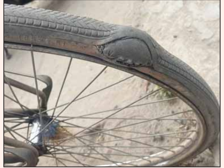
ਦਿਨ ਤਾਂ ਉਹ ਵੀ ਚੰਗੇ ਹੈ ਸੀ ਸਾਦਗੀ ਨਾਲ ਲੰਘਾਉਂਦੇ ਰਹੇ। ਨਵਾਂ ਟਾਇਰ ਵੀ ਜੁੜਦਾ ਨਾ ਸੀ ਬੱਸ ਨਵਾਂ ਜੁਗਾੜ ਬਣਾਉਂਦੇ ਰਹੇ। ਵਿੱਚ ਟਾਇਰ ਦੇ ਪੱਚ ਧਰਾਕੇ ਆਪਣਾ ਡੰਗ ਟਪਾਉਂਦੇ ਰਹੇ