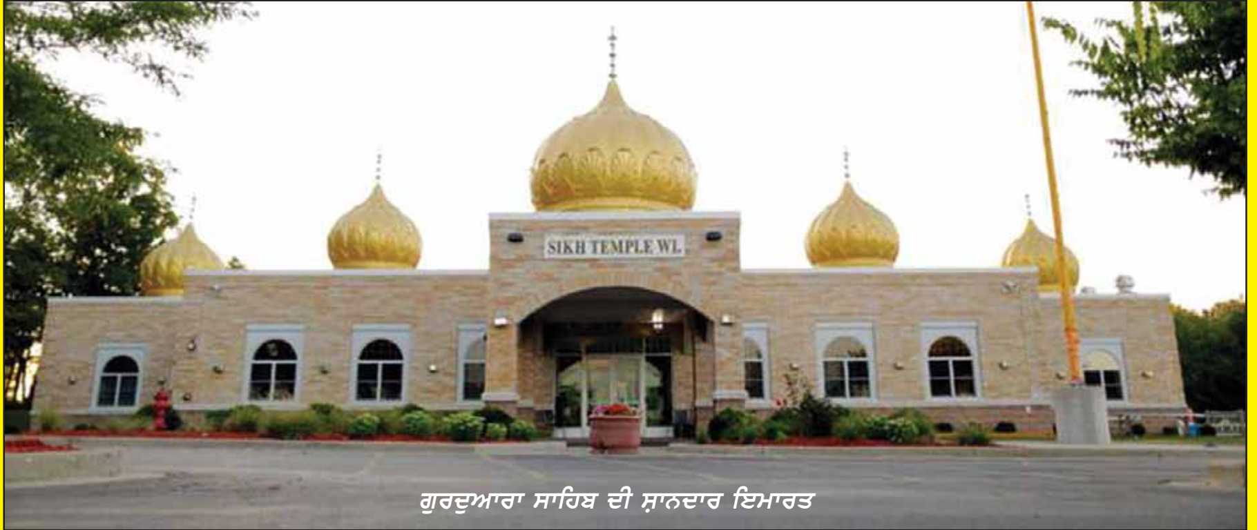
ਗੁਰਦੁਆਰਾ ਸਾਹਿਬ ਦੀ ਸ਼ਾਨਦਾਰ ਇਮਾਰਤ