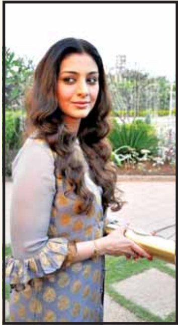
ਫਿਲਮ ‘ਚਾਂਦਨੀ ਬਾਰ’ ਵਿਚ ਅਦਾਕਾਰਾ ਤੱਬੂ ਅਤੇ (ਸੱਜੇ) ਤੱਬੂ ਦੀ ਇਕ ਹਾਲੀਆ ਤਸਵੀਰ।