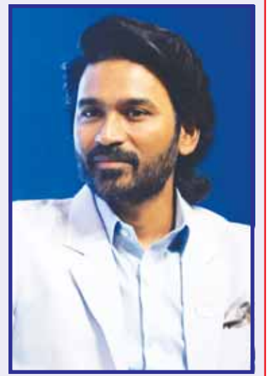
ਉੱਪਰ ਸੰਗੀਤਕਾਰ ਇਲੀਆਰਾਜਾ ਜਿਸ ਉੱਤੇ ਫਿਲਮ ‘ਇਲੀਆਰਾਜਾ’ ਬਣਾਈ ਗਈ ਹੈ, (ਵਿਚਕਾਰ) ਫਿਲਮ ਦਾ ਪੋਸਟਰ ਅਤੇ (ਸੱਜੇ) ਫਿਲਮ ਦਾ ਨਾਇਕ ਧਨੁਸ਼।