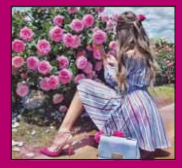
ਚਾਰ ਚੁਫੇਰਾ ਮਨ ਨੂੰ ਮੋਹਦਾ ਫੁੱਲ ਖਿੜਨ ਦੀ ਰੁੱਤ ਜਦ ਆਵੇ। ਗੁਲਜ਼ਾਰ ਦੇ ਕੋਲੋਂ ਲੰਘਣ ਵਾਲਾ ਰੰਗਾਂ ਦੇ ਵਿਚ ਰੰਗਿਆ ਜਾਵੇ। ਗੁਲਾਬੀ ਜਿਹੀ ਭਾਗ ਮਾਰਨ ਲੱਗੇ ਜਦ ਪੱਟਾ ਪੱਤੀ ਨੂੰ ਛੂਹ ਜਾਵੇ। -ਜਗਮੀਤ ਸਿੰਘ ਪੰਧੋਰ ਕਲਾਹੜ (ਲੁਧਿਆਣਾ)

ਵਿਚ ਬਗੀਚੀ ਨਾਲ ਗੁਲਾਬਾਂ, ਗੱਲਾਂ ਕਰ ਰਹੀ ਜਾਪੇ, ਇਹ ਰੰਗ ਕੁੜੀਆਂ ਮਨ ਭਾਵੇ, ਵਿਚ ਬਣੀ ਫੁੱਲ ਆਪੇ। ਮਿਲਦੀ ਜੁਲਦੀ ਹੈ ਗੁਰਗਾਬੀ,