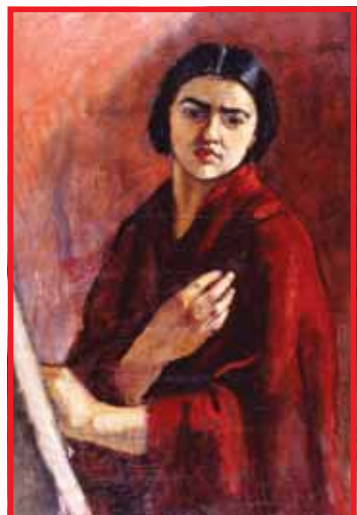
ਆਪਣੇ ਵਕਤ ਦੀ ਉਘੀ ਚਿੱਤਰਕਾਰ ਅੰਮ੍ਰਿਤਾ ਸ਼ੇਰਗਿੱਲ ਦੇ ਆਪਣੇ ਬਣਾਏ ਚਿੱਤਰ (ਸੈਲਫ ਪੋਰਟਰੇਟ)।