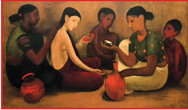
ਚਿੱਤਰਕਾਰ ਅੰਮ੍ਰਿਤਾ ਸ਼ੇਰਗਿੱਲ ਅਤੇ (ਸੱਜੇ) ਉਸ ਦਾ ਬਣਾਇਆ ਇਕ ਚਿੱਤਰ।

ਚਿੱਤਰਕਾਰ ਅੰਮ੍ਰਿਤ ਦੀ ਮੁਸਕਾਨ ਮੈਨੂੰ ਸਦਾ ਪਿਆਰੀ-ਪਿਆਰੀ ਲੱਗਦੀ ਰਹੇਗੀ। ਅੰਮ੍ਰਿਤ ਹੁਣ ਜਿਉਂਦੀ ਨਹੀਂ ਪਰ ਉਸ ਦੀ ਮੁਸਕਾਨ ਅੱਜ ਵੀ ਹਾਜ਼ਰ ਹੈ। ਇਸ ਨੂੰ ਕੈਮਰਾਮੈਨ ਦਾ ਕੋਸ਼ਲ ਕਿਹਾ ਜਾਣਾ ਚਾਹੀਦਾ ਹੈ ਕਿ ਕਿਵੇਂ ਉਸ ਨੇ ਸੁਹਣੇ ਵਾਲ ਵਾਲੀ ਕੁੜੀ ਦੇ ਚਿਹਰੇ ਉਪਰ ਉਹੀ ਮੁਸਕਰਾਹਟ ਪੇਸ਼ ਕੀਤੀ ਜੋ ਅੰਮ੍ਰਿਤ ਦੇ ਬੁੱਲ੍ਹਾਂ 'ਤੇ ਨੱਚੀ ਸੀ ਜਦੋਂ ਮੈਂ ਉਸ ਨੂੰ ਪਹਿਲੀ ਵਾਰ 1936 ਵਿਚ ਦੇਖਿਆ ਸੀ। ਸ਼ਿਮਲੇ ਦੀ ਸਮਰ ਹਿੱਲ ਵਾਲੀ ਥਾਂ ਉਸ ਦੇ ਬਜ਼ੁਰਗ ਅਤੇ ਚਿੱਤਨਸ਼ੀਲ ਪਿਤਾ