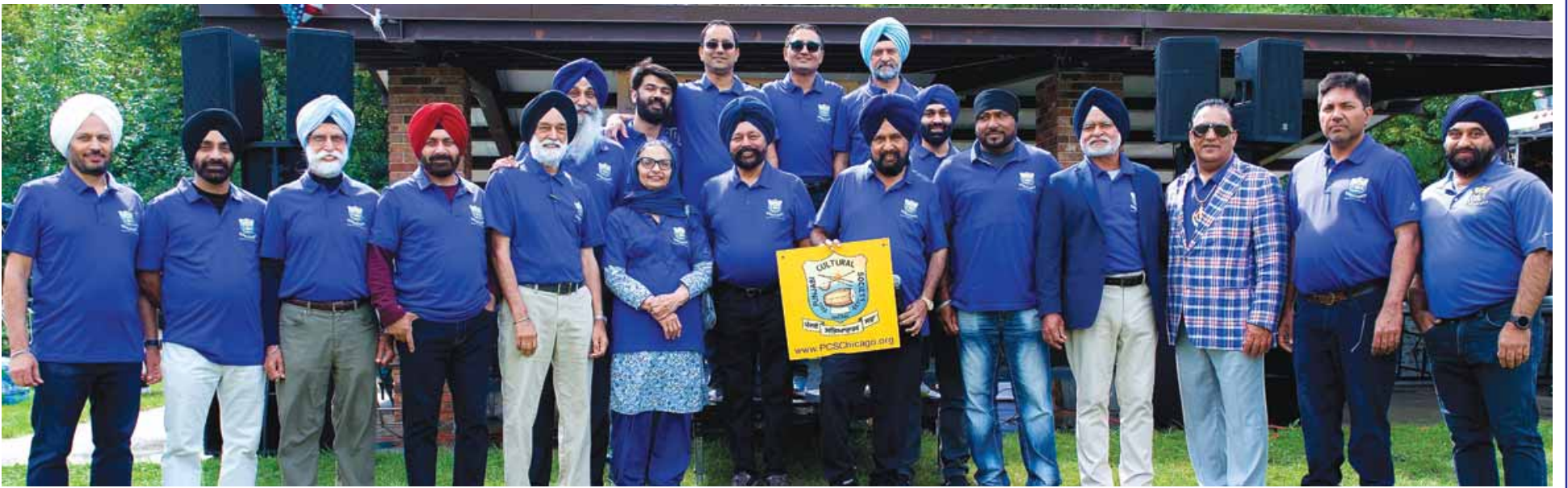
ਪੰਜਾਬੀ ਕਲਚਰਲ ਸੁਸਾਇਟੀ (ਪੀ.ਸੀ.ਐਸ.), ਸ਼ਿਕਾਗੋ ਵਲੋਂ ਲੰਘੀ 17 ਸਤੰਬਰ ਨੂੰ ਕਰਵਾਏ ਗਏ 'ਪੰਜਾਬੀ ਮੇਲਾ-2023' ਦੌਰਾਨ ਯਾਦਗਾਰੀ ਤਸਵੀਰ ਖਿਚਵਾਉਂਦੇ ਹੋਏ ਪੀ.ਸੀ.ਐਸ. ਬੋਰਡ ਦੇ ਮੈਂਬਰ। ਪੀ.ਸੀ.ਐਸ. ਦਾ ਇਹ ਮੇਲਾ ਹਰ ਵਾਰ ਵਾਂਗ ਮਨੋਰੰਜਨ ਭਰਪੂਰ ਰਿਹਾ। (ਵੇਰਵੇ ਅਤੇ ਤਸਵੀਰਾਂ ਅਗਲੇ ਅੰਕ 'ਚ)