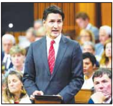
ਪ੍ਰਧਾਨ ਮੰਤਰੀ ਜਸਟਿਨ ਟਰੂਡੋ।