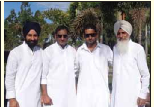
ਕੰਗ ਪਰਿਵਾਰ (ਕਾਰਗੋ ਸਲਿਊਸ਼ਨਜ਼)