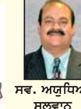
ਸਵ. ਅਯੁਧਿਆ ਸਲਵਾਨ