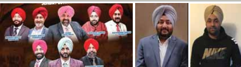
(ਪੰਜਾਬ ਸਪੋਰਟਸ ਕਲੱਬ ਮਿੱਡਵੈਸਟ)