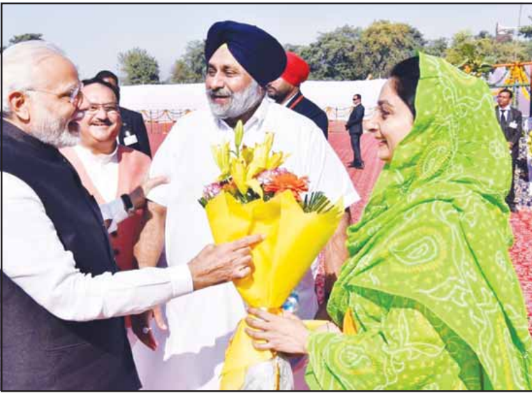
ਪ੍ਰਧਾਨ ਮੰਤਰੀ ਨਰਿੰਦਰ ਮੋਦੀ ਦੀ ਸੁਖਬੀਰ ਸਿੰਘ ਬਾਦਲ ਅਤੇ ਹਰਸਿਮਰਤ ਕੌਰ ਬਾਦਲ ਨਾਲ ਇਕ ਪੁਰਾਣੀ ਤਸਵੀਰ।

ਯਾਦ ਰਹੇ ਕਿ ਪਿਛਲੇ ਦਿਨੀਂ ਦੋਵਾਂ ਧਿਰਾਂ (ਅਕਾਲੀ ਦਲ-ਭਾਜਪਾ) ਨੇ ਨੇੜੇ ਆਉਣ ਦੀਆਂ ਕੋਸ਼ਿਸ਼ਾਂ ਕੀਤੀਆਂ ਸਨ ਪਰ ਸੀਟਾਂ ਦੀ ਵੰਡ ਨੂੰ ਲੈ ਕੇ ਤਾਣੀ ਉਲਝ ਗਈ ਸੀ। ਅਕਾਲੀ ਦਲ ਪਹਿਲਾਂ ਵਾਂਗ 'ਵੱਡੇ ਭਰਾ' ਵਜੋਂ ਗੱਠਜੋੜ ਦਾ ਹਿੱਸਾ ਬਣਨ ਦੀ ਇੱਛਾ ਰੱਖਦਾ ਹੈ ਪਰ ਭਾਜਪਾ ਅਕਾਲੀ ਦਲ ਦੀ ਮੌਜੂਦਾ ਹਾਲਤ ਨੂੰ ਅੱਗੇ ਰੱਖ ਕੇ ਉਸ ਦਾ ਵਜ਼ਨ ਤੋਲ ਰਹੀ ਹੈ। ਸਿਆਸੀ ਮਾਹਿਰ ਦਾ ਕਹਿਣਾ ਹੈ ਕਿ ਭਾਜਪਾ ਇਹ ਚੰਗੀ ਤਰ੍ਹਾਂ ਸਮਝਦੀ ਹੈ ਕਿ ਅਕਾਲੀ ਦਲ (ਬਾਦਲ) ਦਾ ਹੁਣ ਉਸ ਬਿਨਾਂ ਸਰਨ ਵਾਲਾ ਨਹੀਂ। ਇਸ ਲਈ ਸੁਖਬੀਰ ਦੀ ਅਗਵਾਈ ਨੂੰ ਚੁਣੌਤੀ ਦੇ ਕੇ ਦਬਾਅ ਬਣਾਇਆ ਜਾ ਰਿਹਾ ਹੈ। ਦਰਅਸਲ,