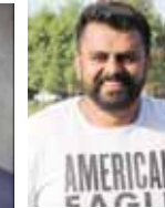
ਲੱਕੀ ਸਪਰਾ ਬੇਕਰਜ਼ਫੀਲਡ