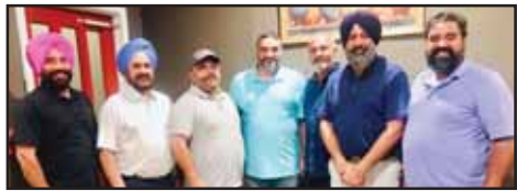
ਪੰਜਾਬ ਸਪੋਰਟਸ ਕਲੱਬ ਸ਼ਿਕਾਰੋ ਦੇ ਅਹੁਦੇਦਾਰ