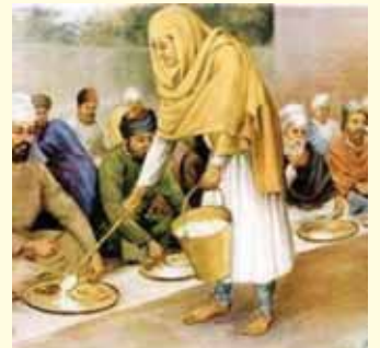
ਮਾਤਾ ਖੀਵੀ ਜੀ

ਆਸਾ ਕੀ ਵਾਰ ਮ: ੧ ॥ ਭੰਡਿ ਜੰਮੀਐ ਭੰਡਿ ਨਿੰਮੀਐ ਭੰਡਿ ਮੰਗਣੁ ਵੀਆਹੁ॥ ਭੰਡਹੁ ਹੋਵੈ ਦੋਸਤੀ ਭੰਡਹੁ ਚਲੈ ਰਾਹੁ॥ ਭੰਡੁ ਮੁਆ ਭੰਡੁ ਭਾਲੀਐ ਭੰਡਿ ਹੋਵੈ ਬੰਧਾਨੁ॥ ਸੋ ਕਿਉ ਮੰਦਾ ਆਖੀਐ ਜਿਤੁ ਜੰਮਹਿ ਰਾਜਾਨ॥