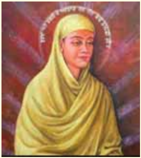
ਬੇਬੇ ਨਾਨਕੀ ਜੀ

26 ਮਾਰਚ ਐਤਵਾਰ ਦੇ ਸਮੁੱਚੇ ਦੀਵਾਨ ਦੀ ਸੇਵਾ, ਜਿਸ ਵਿਚ ਲੰਗਰ, ਕੀਰਤਨ, ਵਿਆਖਿਆ, ਅਰਦਾਸ, ਹੁਕਮਨਾਮਾ ਅਤੇ ਕੜਾਹ ਪ੍ਰਸ਼ਾਦ ਵਰਤਾਉਣ ਤਕ ਦੀ ਸੇਵਾ ਸੰਭਾਲ ਸਭ ਗੁਰੂਘਰ ਦੀਆਂ ਬੀਬੀਆਂ ਵਲੋਂ ਨਿਭਾਈ ਜਾਵੇਗੀ। ਗੁਰੂ ਨਾਨਕ ਸਾਹਿਬ ਜੀ ਵਲੋਂ ਇਸਤ੍ਰੀ ਜਾਤੀ ਨੂੰ ਮਿਲੇ ਮਾਣ ਨੂੰ ਸਾਕਾਰ ਕਰਦਿਆਂ, ਗੁਰਦੁਆਰਾ ਸਾਹਿਬ ਵ੍ਹੀਟਨ ਦੀ ਸੰਗਤ ਵਲੋਂ ਐਤਵਾਰ 26 ਮਾਰਚ 2023 ਦਾ ਦੀਵਾਨ ਔਰਤਾਂ ਨੂੰ ਸਮਰਪਿਤ ਕੀਤਾ ਗਿਆ ਹੈ। ਅਜ ਤੋਂ ਤਕਰੀਬਨ ਸਾਢੇ ਪੰਜ ਸੌ ਸਾਲ ਪਹਿਲਾਂ ਜਗਤ ਗੁਰੂ, ਧੰਨ ਗੁਰੂ ਨਾਨਕ ਪਾਤਸ਼ਾਹ ਜੀ ਨੇ ਸਮਾਜ ਵਿੱਚ ਔਰਤ ਪ੍ਰਤੀ ਮਾੜੇ ਵਰਤਾਰੇ ਨੂੰ ਦੇਖਦਿਆਂ ਆਵਾਜ਼ ਬੁਲੰਦ ਕੀਤੀ ਸੀ।