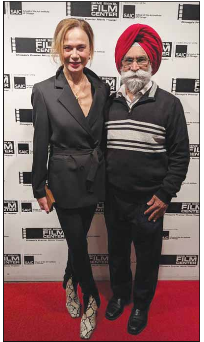
ਆਸਕਰ ਨਾਮਜ਼ਦ ਹਾਲੀਵੁਡ ਐਕਟਰਸ ਲੀਨਾ ਮਾਰੀਆ ਓਲਿਨ ਤੇ ਫਿਲਮ ਜਗਤ ਦੇ ਸੁਰਿੰਦਰ ਸਿੰਘ ਭਾਟੀਆ।

'ਰਿਵੇਰਾ' (2017-2020), ਅਤੇ ਡਰਾਮਾ ਲਈ 'ਹੰਟਰਜ਼' (2020-2023) ਸ਼ਾਮਲ ਹਨ। 2008 ਵਿਚ, ਓਲਿਨ ਨੇ ਆਸਕਰ-ਨਾਮਜ਼ਦ ਫਿਲਮ ਦਿ ਰੀਡਰ (2008) ਵਿਚ ਛੋਟੀ ਪਰ ਮਹੱਤਵਪੂਰਨ ਭੂਮਿਕਾ ਨਿਭਾਈ। ਆਪਣੀ ਫਨਕਾਰੀ ਦੇ ਖਾਸ ਅੰਦਾਜ਼ ਵਿਚ ਇਸ ਮਿਸਾਲੀ ਕਿਰਦਾਰ ਨੂੰ ਨਿਭਾ ਕੇ ਉਸਨੇ ਦਰਸ਼ਕਾਂ ਤੋਂ ਬੇਹੱਦ