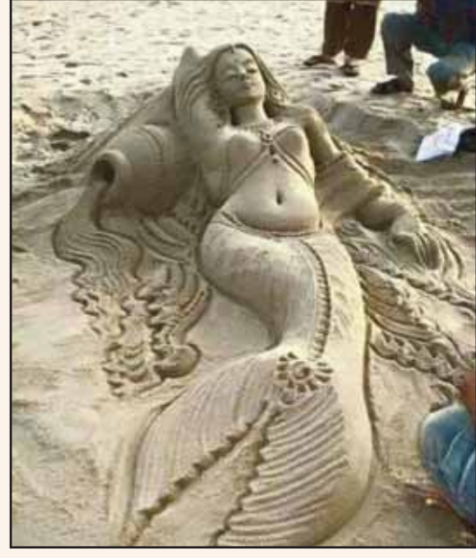
ਕੀ ਕਹਿਣੇ ਕਲਾਕਾਰ ਦੇ, ਕਲਾ ਕਰੇ ਕਮਾਲ, ਜਿੱਥੇ ਲਾਵੇ ਹੱਥ ਮਿੱਟੀ ਨੂੰ, ਕਰ ਸੋਨਾ ਦਏ ਵਿਖਾਲ। ਸਾਗਰ ਕੰਢੇ ਰੇਤ ਵਿਚੋਂ ਹੈ, 'ਮਰਮੇਡ ਰਾਣੀ' ਬਣਾਈ, ਨਿੱਘੀ ਧੁੱਪ ਵੇਖ ਭੁੱਲੀ ਤਾਂ, ਸੁੱਟ ਘੜਾ ਓਟ ਲਗਾਈ। ਕਰਦੇ ਲੋਕੀਂ ਅਸ਼ ਅਸ਼ ਦੇਖੋ, ਖੜ੍ਹ ਖੜ੍ਹ ਫੋਟੋ ਖਿਚਵਾਵਣ, ਪੇਟ ਦੀ ਖਾਤਰ ਹੱਥ ਜੋੜੋ, ਦਰਸ਼ਕ ਤਰਸ ਕਮਾਵਣ !