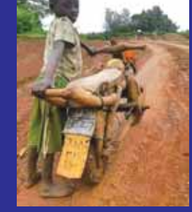
ਨਾਲ ਚੈਨ ਦੇ ਬਹਿਣ ਨੂੰ ਦਿੰਦੇ, ਮਨ ਦੇ ਪਏ ਅਧੂਰੇ ਸੁਪਨੇ। ਲੱਕੜ ਨਾਲ ਕਲਾਕਾਰੀ ਕਰ ਕੇ, ਕਰ ਲਏ ਇੱਕ ਦਿਨ ਪੂਰੇ ਸੁਪਨੇ। ਕੋਲੋਂ ਦੀ ਲੰਘ ਜਾਂਦੇ ਸੀ ਜੋ, ਹਾਣ ਦੇ ਸਾਥੀ ਬੁਲਟ ਚਲਾ ਕੇ। ਲੱਕੜ ਦੀ ਬਾਈਕ ਦੀਆਂ ਸਿਫਤਾਂ ਕਰਦੇ, ਹੁਣ ਨਾ ਲੰਘਣ ਪਟਾਕੇ ਪਾ ਕੇ। -ਗੁਰਦੇਵ ਸਿੰਘ ਵਪਾਲੀ