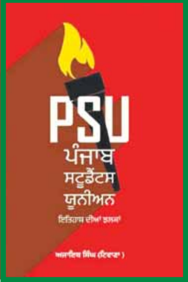
ਪੰਜਾਬ ਸਟੂਡੈਂਟਸ ਯੂਨੀਅਨ ਬਾਰੇ ਲਿਖੀ ਕਿਤਾਬ ਦਾ ਮੁਖੜਾ।

ਅਹਿਮ ਭੂਮਿਕਾ ਨਿਭਾਈ ਅਤੇ ਉਸ ਵਕਤ ਤੇ ਉਸ ਤੋਂ ਬਾਅਦ ਲੜੇ ਗਏ ਘੋਲ ਅੱਜ ਦੀ ਵਿਦਿਆਰਥੀ ਲਹਿਰ ਦੀ ਬੁਨਿਆਦ ਬਣ ਚੁੱਕੇ ਹਨ। ਉਸ ਵਕਤ ਪੰਜਾਬ ਸਟੂਡੈਂਟਸ ਯੂਨੀਅਨ ਨੇ ਸੂਬੇ ਦੀ ਸਿਆਸਤ ਵਿਚ ਆਪਣਾ ਵੱਖਰਾ ਅਤੇ ਵਿਲੱਖਣ ਰੋਲ ਨਿਭਾਇਆ।